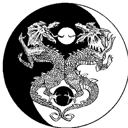
Рис. 2. Схема монады

В Китае данный символ называется тай-цзи – «великий предел». Графическое его изображение имеет вид, в который вписаны два поля, похожие на большие капли черного и белого цвета. Черный цвет символизирует инь, белый – ян. В центре белой капли помещена черная точка, а в черной – белая (рис. 2).