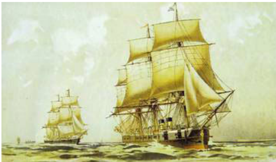
Броненосный фрегат «Минин».

Американцы высоко оценили дружественный акт русских. Престиж России был восстановлен, а англичане «получили по носу» (за поражение русских в Крымской войне 1853–1856 гг.).