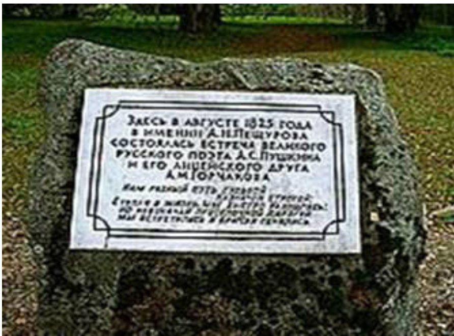
Памятный камень, установленный в имении Лямоново.

Расстояние от п. Красногородска до д. Лямоны – 28 км. Добраться до туда можно рейсовым автобусом.