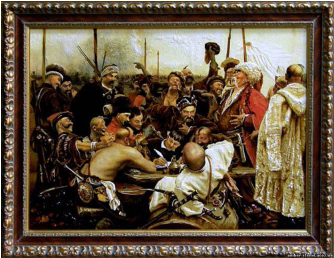
Репин «Запорожцы пишут письмо турецкому султану»

Наш род идет от Запорожских казаков. Практически в каждой сотне Войска запорожского служил казак по фамилии – Максименко.