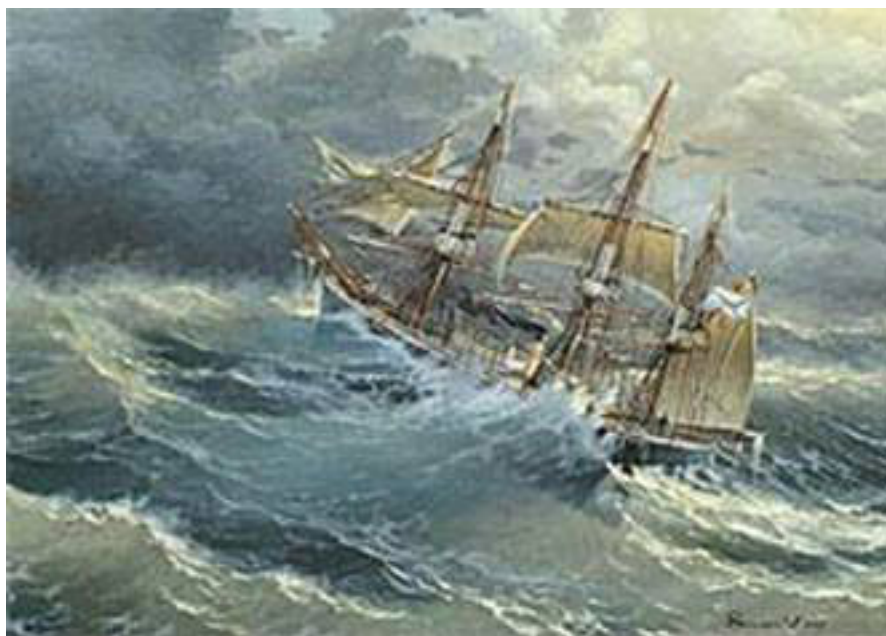
Гайдамак в океане. Орг., масло, 2008 г.