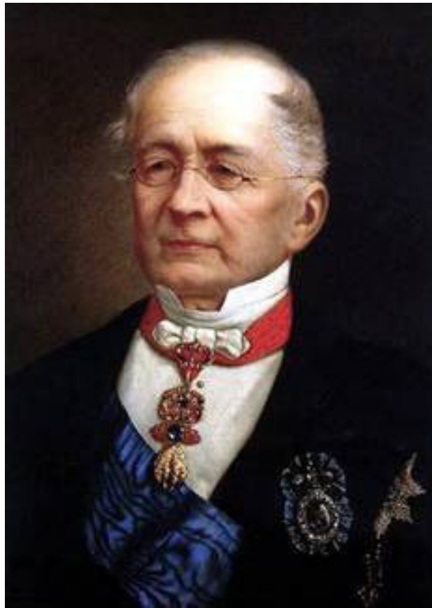
Горчаков Александр Михайлович

Государственный деятель, государственный канцлер, министр иностранных дел.