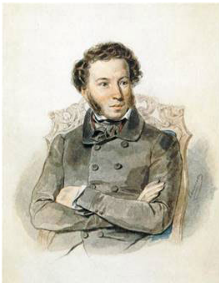
Портрет А. С. Пушкина, 1836

На посту губернатора Пещуров оставался до 29 ноября 1839 г. По указу Николая I был назначен сенатором. «Псковскому гражданскому губернатору тайному советнику А. Н. Пещурову, Всемилостивейше повелеваю присутствовать в Правительствующем сенате, с сохранением получаемого им по званию гражданского губернатора оклада, т. е. жалованья по 6000 руб. и столовых по 6000 руб. всего 12000 рублей в год», – так писали «Псковские губернские ведомости» 20 декабря 1839 г. В 1842 г. он проводил ревизию в Оренбургской губернии.