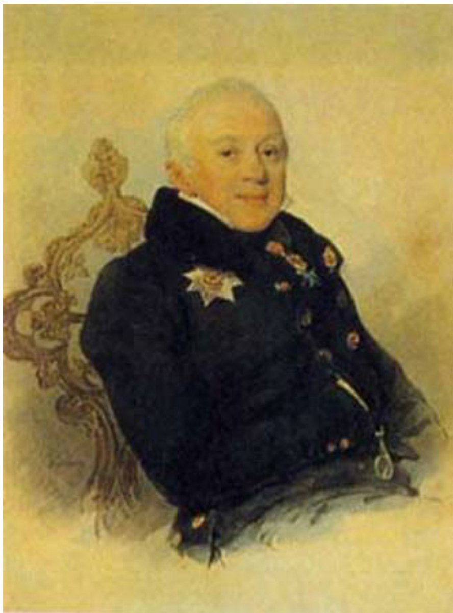
Алексей Никитич Пешуров, автор Соколов Петр Федорович.

До 1803 г. служил в лейб-гвардии Семеновском полку. Отставной штабс-капитан. В 1823–1828 гг. он был Опочецким уездным предводителем дворянства, а в 1827–1829 гг. – Псковским губернским предводителем дворянства. В 1829–1830 гг. – губернатор Витебской губернии.