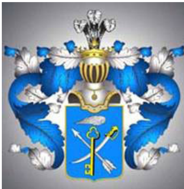
Герб Рода Пешуровых.