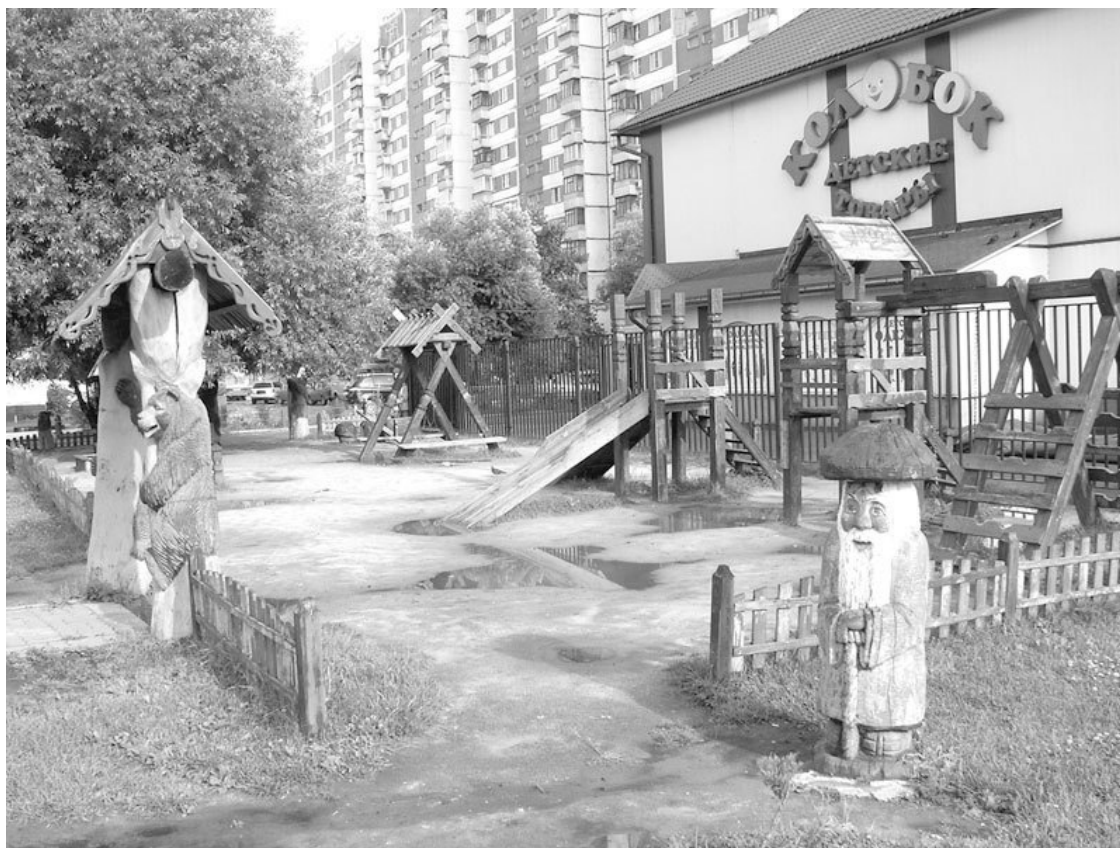
Детская площадка в Щербинке

ного производства; но с властями не так-то просто было бороться, не мытьем, так катаньем они начали монтировать установку того же профиля, и вновь без экологической экспертизы. Местная администрация подкупает население подачками в виде земли под гаражи, городской инфраструктурой. Но экология за последние годы неизменно ухудшается, растет число заболеваний – онкологических и аллергических. По многим показателям Щербинка уже превысила ПДК, предельно допустимые концентрации того же свинца в городской среде увеличились более чем в 5 раз. Пожалуй, это самые загрязненные территории из всей Новой Москвы.