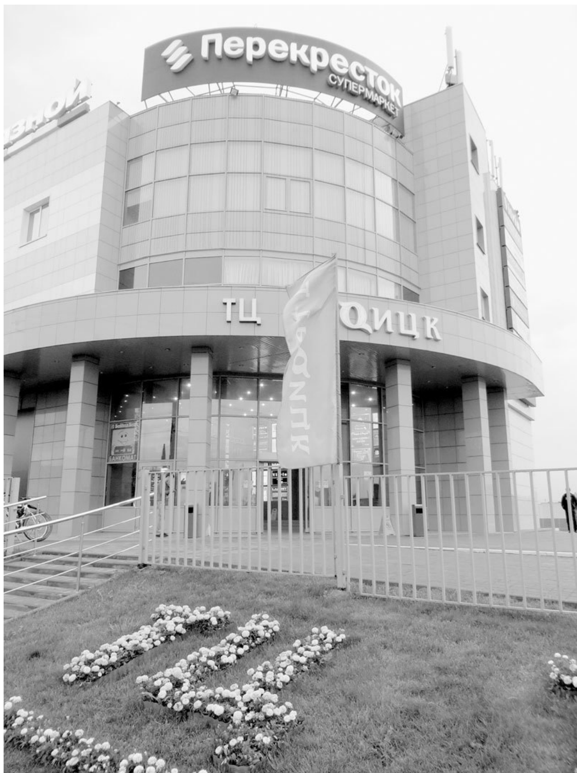
Торговый центр, носящий имя города

Часть площади в главном здании института использовалась как жилая и была заселена основными научными работниками. Воду возили в бочках, в комнатах устанавливались буржуйки, которые растапливали немецким порохом, оставшимся от военных, квартировавших здесь во время войны. Ввиду отсутствия рабочей силы все бытовые заботы ложились на плечи научного коллектива – заготовка дров, ведение подсобного хозяйства, ремонтные работы.