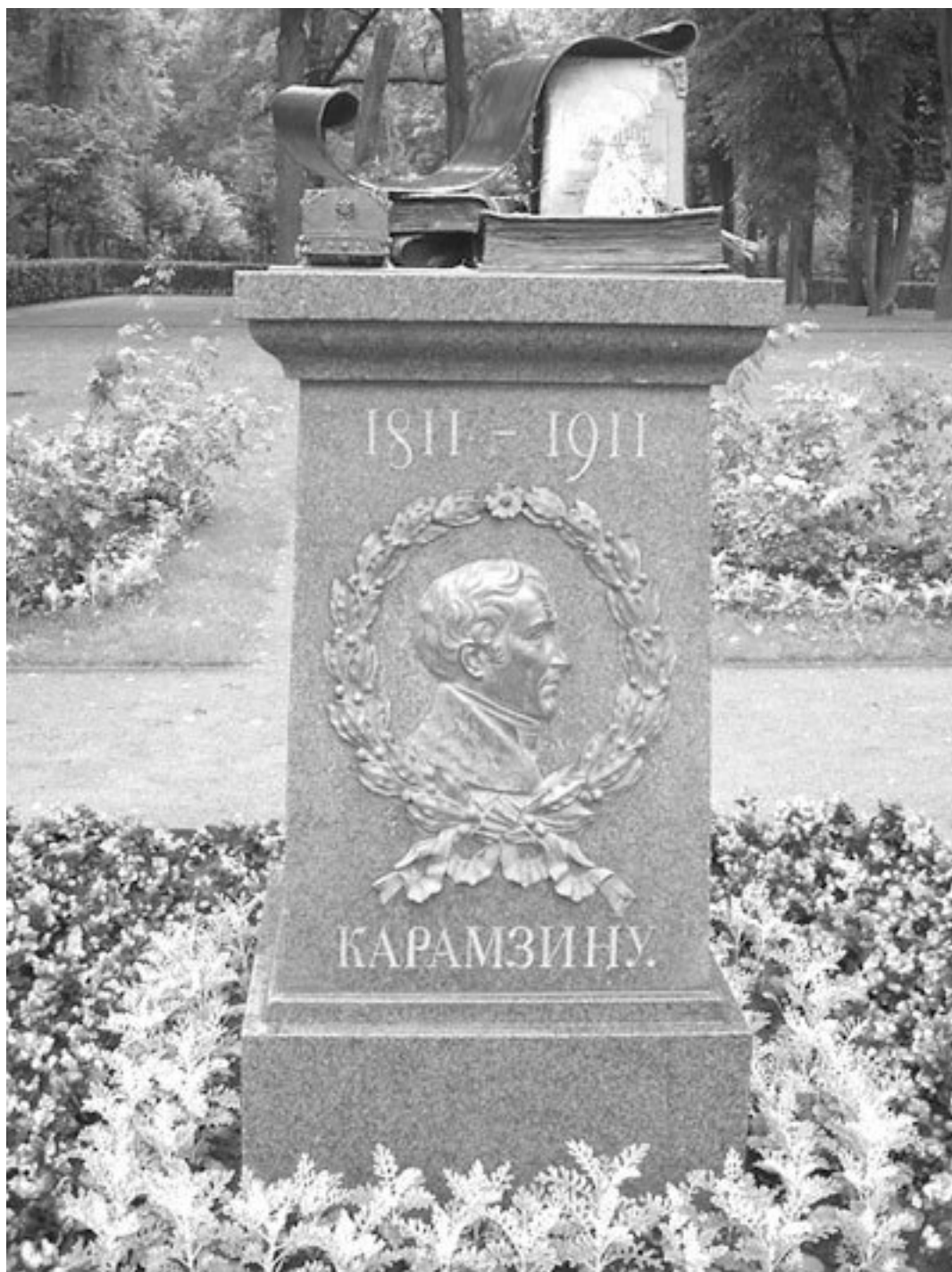
Памятник Н. М. Карамзину

Бросается в глаза ухоженность усадебных построек, парковых аллей и малой скульптуры на федеральных объектах по сравнению с запущенностью не менее уникальных имений, но уже рангом ниже – региональных.