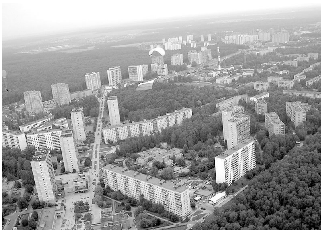
Троицк с высоты птичьего полета

Другой точкой роста станет Внуково . Здесь планируется крупный аэрополис площадью 1,5 миллиона квадратных метров. Он выполняет логистические функции и служит центром притяжения всей прилегающей территории. Кроме офисных зданий во Внукове уже строятся выставочный центр и гоночная трасса.