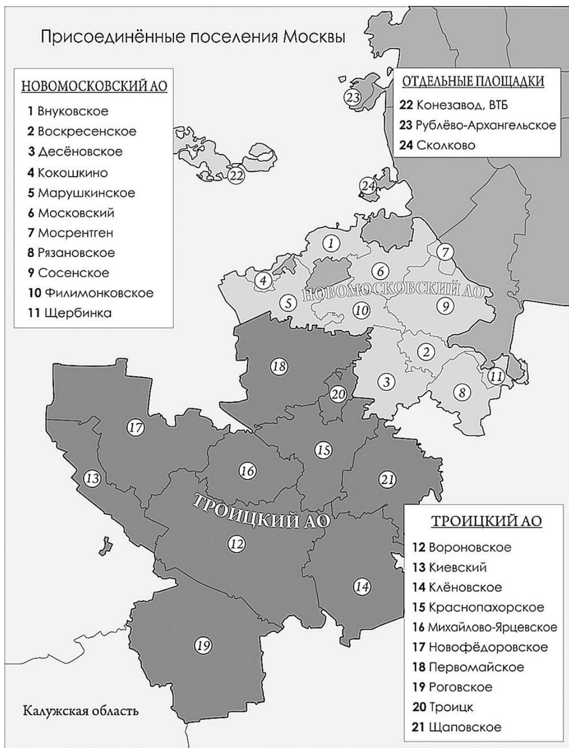
Карта Москвы и присоединенных территорий

Вовлечение новых территорий в столичное развитие приводит и к расширению туристической деятельности – экскурсионной, музейно-выставочной, паломнической, а также оздоровительно-лечебной рекреации и появлению различных видов отдыха и спорта на природе.