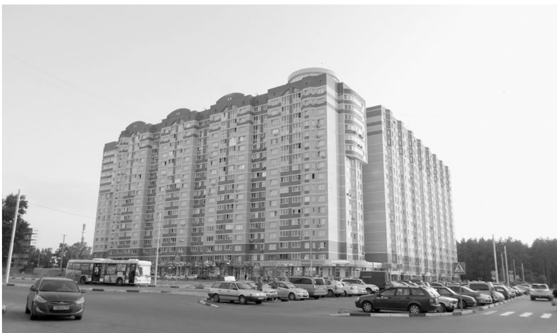
Современный жилой дом, прозванный троичанами «Титаник»

В Пахре собрались те, кого Москва не приняла на жительство. Что же собой представляло поселение? Самым красивым зданием был ИЗМИРАН, «Магнитка» (Курчатовский институт) пряталась за забором и была окружена тайной. Пятиэтажное каменное жилье можно было пересчитать по пальцам, много было финских домиков, сараев, а вокруг прямо-таки «зеленое море тайги». Старожилы говорят, что лучше помнят лес того времени, чем сам поселок. И при этом замечают, что грибы собирали, едва выйдя из подъезда.