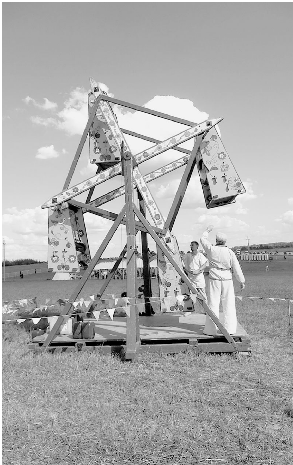
«Старинная» карусель. Парк исторических реконструкций близ села Воскресенское