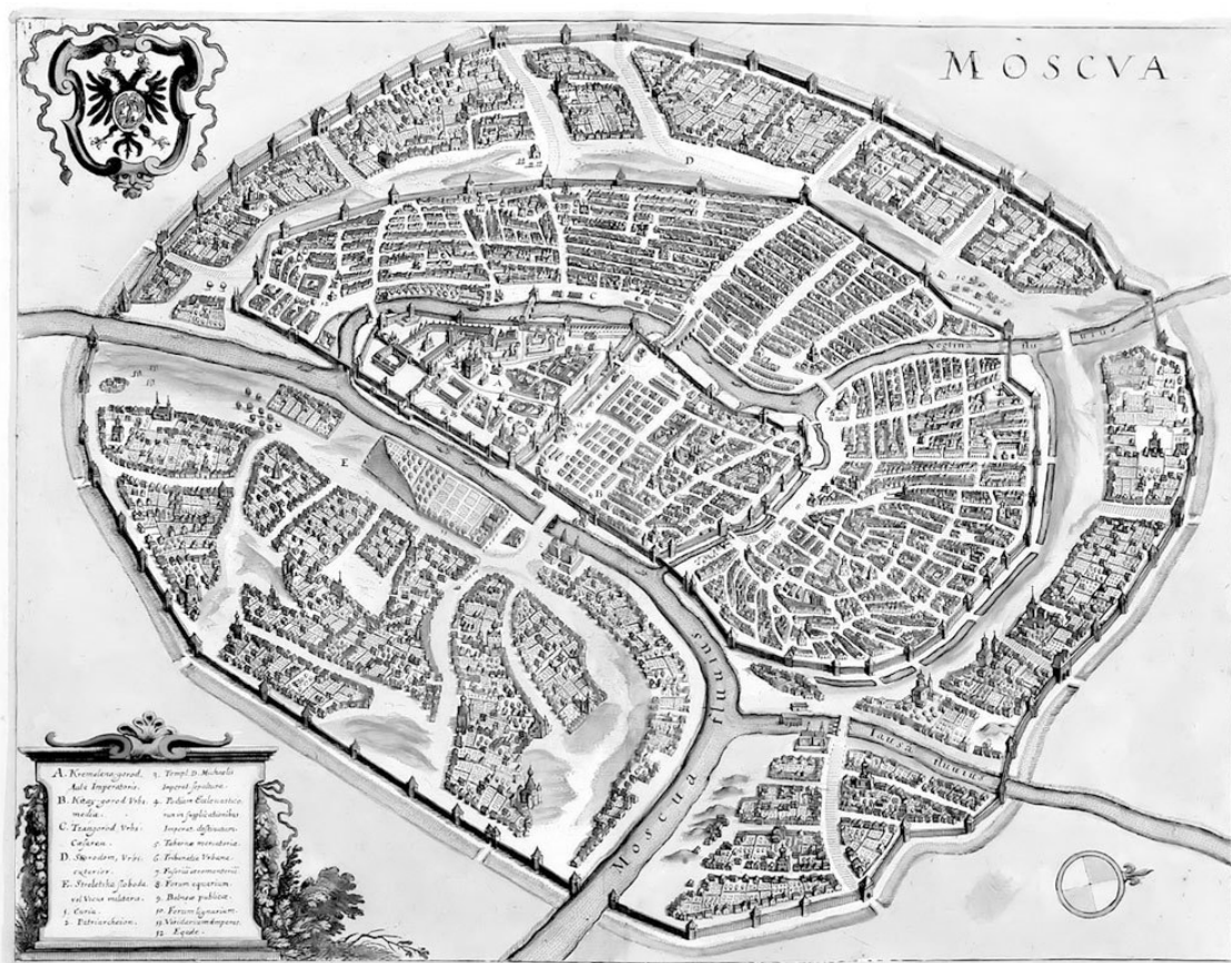
Москва в пределах современного Садового кольца. Карта XVII в.