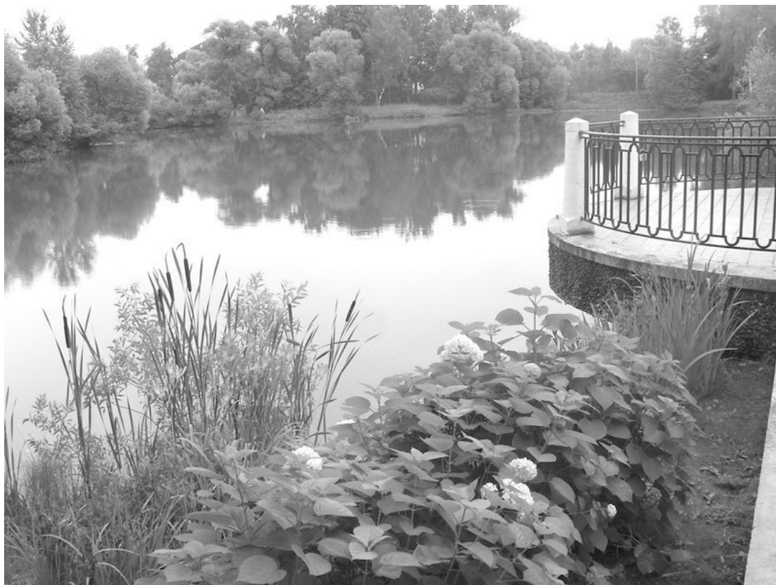
Пруд возле усадьбы

В 20-е годы XIX в. семья Вяземских живет здесь неотлучно, под особым надзором полиции. За фрондерство последовала государственная опала. Впрочем, это не мешало собираться литераторам и читать свои произведения, не всегда выражающие лояльные к власти взгляды. В 1898 г. усадьба переходит к родственникам Вяземских – Шереметевым. Музейный комплекс продолжает тщательно сохраняться.