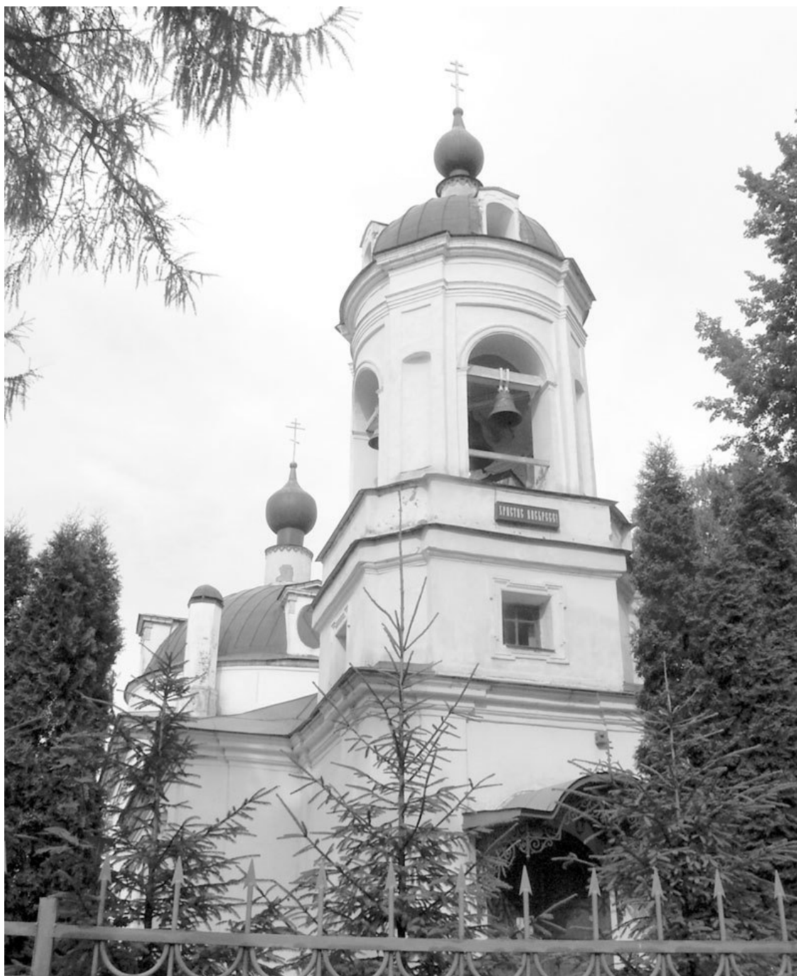
Церковь Троицы Живоначальной возле усадьбы Остафьево

Летописные источники сообщают, что на Руси первый храм в честь Святой Троицы построен в 1342 году. Троицкие обители в Московии традиционно связаны с именами Сергия Радонежского, Дмитрия Донского, Стефана Яворского, Амвросия Оптинского, святителя Феофана (Говорова), Евфимия Болховитинова. Троице-Сергиева лавра – вот уже несколько столетий чтимый верующими и просвещенными миллионами центр духовности, благодати (или добротолубия), гуманизма.