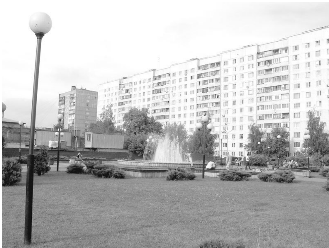
Спальный район Щербинки

Современными градостроительными предприятиями являются: штамповочно-механический (в народе его называют «Штамповка») и лифтостроительный заводы, а также электроплавленных огнеупоров, металлоконструкций, авиационного технологического оборудования, защитных покрытий, Щербинское экспериментальное Кольцо – железнодорожный полигон по испытанию техники. Вокруг этого производственного стержня и сложилась современная Щербинка. Эти же атрибуты отразились и на гербе города: рельс и кольцо символизируют железнодорожное экспериментальное кольцо, НИИ железнодорожного транспорта; кирпичная арка – завод электроплавленных огнеупоров, шестерня – лифтостроительный завод; лучи символизируют жизнь и молодость, лазурь указывает на аэропорт «Остафьево». Если судить по этому геральдическому рисунку, то складывается впечатление, что место представляет собой промзону с кучей дымящих труб и кольцевым железнодорожным полигоном. В определенном смысле так и является. На особом счету – завод художественных промыслов и сувениров, а также «Государыня» – музейная коллекция фарфоровых персон.