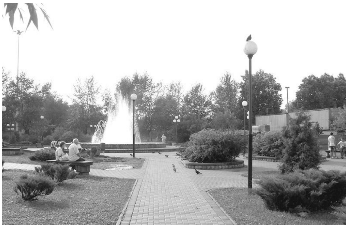
Место отдыха горожан

Все члены семьи с техническим образованием, но это же и помогает в производственном процессе. Вначале рисуется эскиз, потом делается болванка, и она же обжигается. Затем ее расписывают, шьют платье, вышивают и плетут, обрамляют бисером и укладывают прически. И куклы, одетые в достоверно выполненный исторический костюм, объехали уже полмира. Но это были изделия из папье-маше. Из того времени почти ничего не осталось, что-то осело у чиновников, ездивших на международные выставки, какие-то изделия попали в частные коллекции.