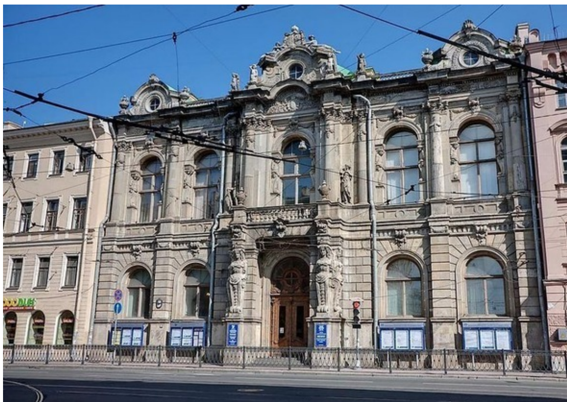
Вид дворца на Литейном проспекте (фото автора конца 1990-х годов)

Мы подошли чуть ближе. Стали с интересом рассматривать фасад. Это был настоящий маленький дворец. Каменная облицовка, декоративные колонны над входом, женские аллегорические статуи, кариатиды, гербы в центральном аттике – все было исполнено в изысканной манере, говорившей о хорошем вкусе и профессионализме неизвестного зодчего.