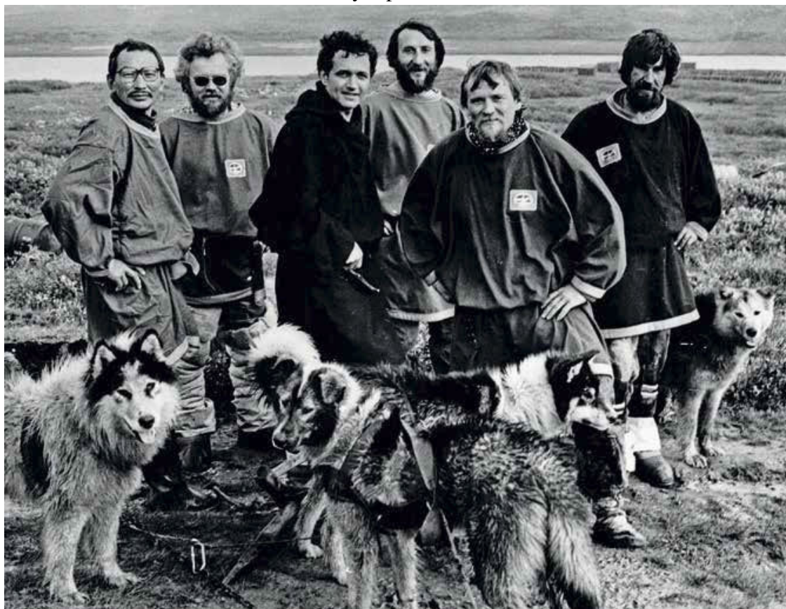
Участники экспедиции в ненецкой тундре.

Не обо всем с трассы на этом первом этапе экспедиция могла сообщать читателям «Советской России». Ну можно ли, например, было сообщить, не испугав читателей, как на реке Индигирке ледяная пурга уложила людей и собак на тридцать восемь часов. «Лежали