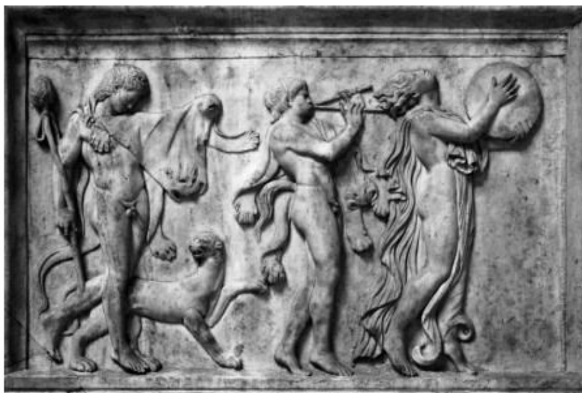
Вакханка с бубном

Ещё одним средством, широко используемым шаманами, являются растения или грибы-галлюциногены. Для вхождения в трансовое состояние шаман мог применять и другие средства: нахождение в тёмном помещении, длительное сидение в неподвижной позе (наподобие медитации), пребывание в вырытой в земле яме, созерцание пламени, воздержание от пищи в течение нескольких дней, удаление в пустынное место.