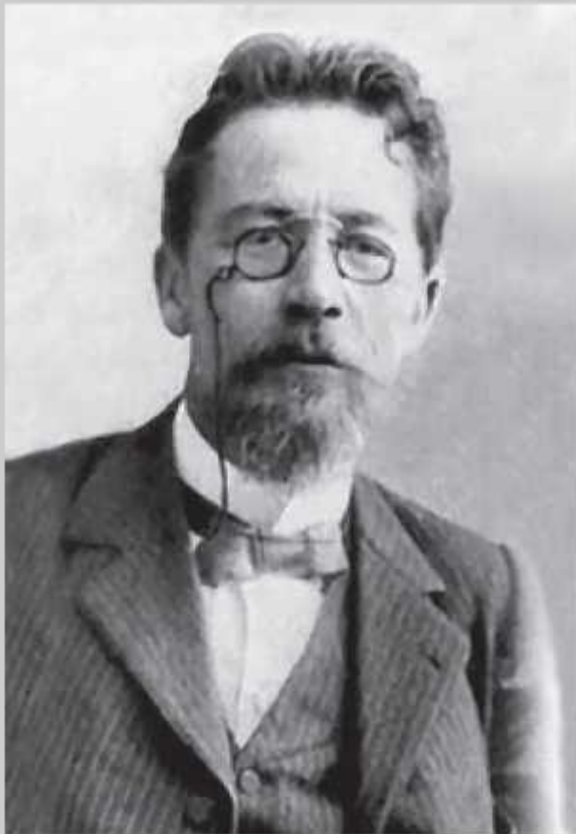
Антон Павлович Чехов

Ялту в период Гражданской войны с полным на то основанием следует признать одним из самых значительных культурных центров бывшей Российской империи. Суди сам, уважаемый читатель. В 1917–1920 годах в Ялте были образованы и энергично работали следующие учреждения и организации: Народный университет, Народная консерватория, Библиотечное общество, Дом-музей А.П.Чехова, Литературное общество имени А.П.Чехова, Медицинское