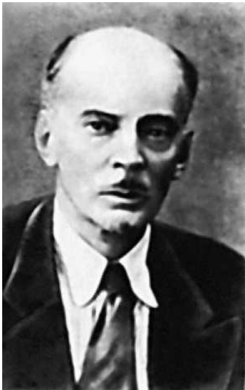
Сергей Константинович Маковский

Последняя встретившаяся мне информация о деятельности Общества – объявление о том, что на предполагавшемся 13 августа 1920 года заседании Общества писатель И.А.Амфи-театров (Кадашев) прочтет свою пьесу «Волшебный фонарь».