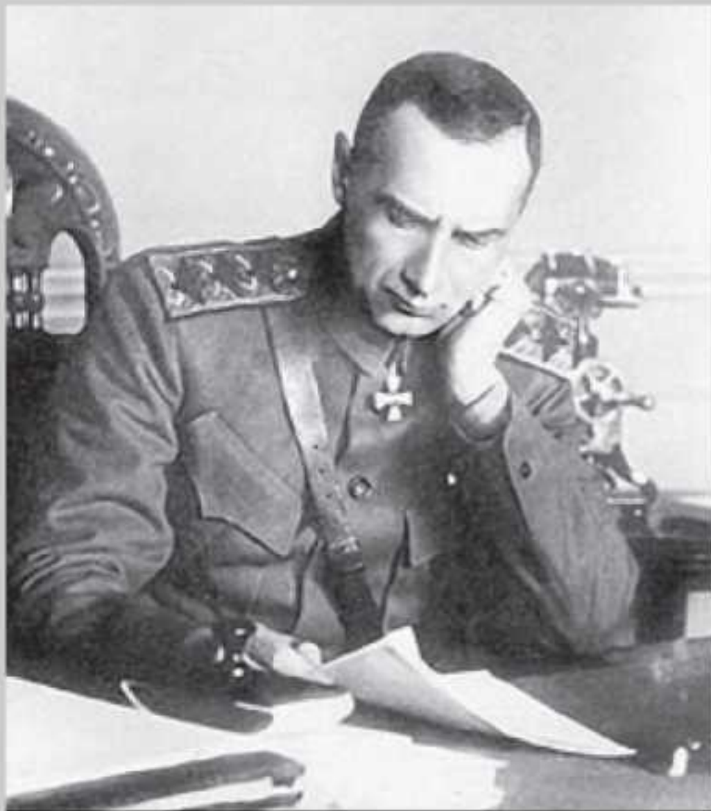
Александр Васильевич Колчак

Имя Колчака долгое время разъединяло соотечественников. В наши дни исследователи возвращаются к этой загадочной и трагической фигуре.