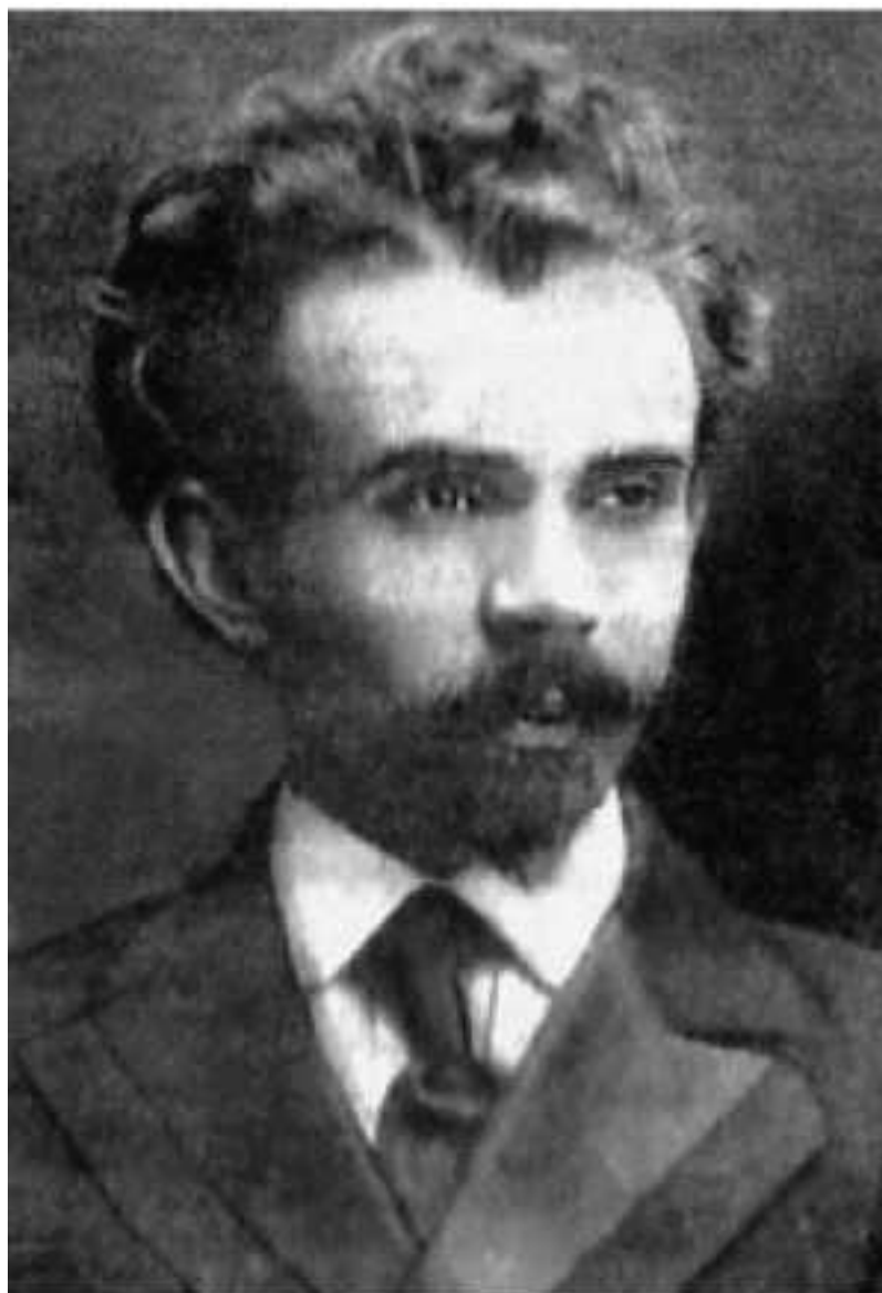
Николай Каллиникович Гудзий

Опираясь на собственный опыт, берусь утверждать, что публикации предшествовала весьма трудоемкая работа. Автор скрупулезно выявила материалы об Обществе, напечатанные на страницах семи ялтинских газет, выходивших в 1918–1920 годах, а именно: «Известия Ялтинского Совета рабочих и солдатских депутатов», «Наш путь», «Наша газета», «Южный курьер», «Ялтинская коммуна», «Ялтинские известия», «Ялтинский голос». В результате З.Ливицкой удалось установить точные хронологические рамки существования Общества (ноябрь 1917 – ноябрь 1920 гг.), его структуру, основные направления и формы деятельности, персональный состав членов (среди которых были и такие видные деятели науки и культуры, как писатель Г.Д.Гребенщиков, литературовед профессор Н.К.Гудзий, писатель и врач С.Я.Елпатьевский, писатель В.Н.Ладыженский, историк искусства, художественный критик, поэт и мемуарист С.К.Маковский, будущий знаменитый писатель В.В.Набоков, его отец, видный политический и государственный деятель В.Д.Набоков, писательница Т.Л.Щепкина-Куперник, друг А.П.Чехова протоиерей Сергей Щукин и др.), персональный состав руководителей Общества (председателями правления Общества последовательно состояли С.Я.Елпатьевский, Н.К.Гудзий, Т.Л.Щепкина-Куперник), тематику многих заслушанных на заседаниях Общества докладов.