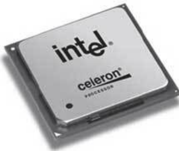
Рис. 1.2. Процессор Intel Celeron

Процессор (рис. 1.2,1.3) – двигатель компьютера. Его выбор определяет скорость вычислительных операций. Наиболее критичными по требованиям к процессору являются математические и статистические пакеты, мощные графические редакторы (например, 3ds Max), программы для обработки звуковой и видеоинформации, мультимедийные приложения и игры.