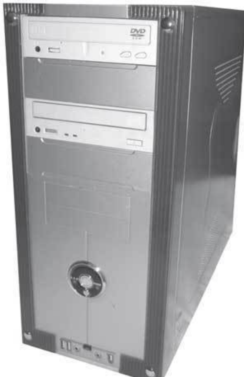
Рис. 1.1. Корпус ATX

После выбора модели корпуса необходимо задуматься о его типе и размере. По типу корпуса делятся на вертикальные и горизонтальные. Сейчас наиболее распространены вертикальные корпуса (типа «башня» (tower)), которые, в свою очередь, в зависимости от высоты бывают следующих разновидностей: