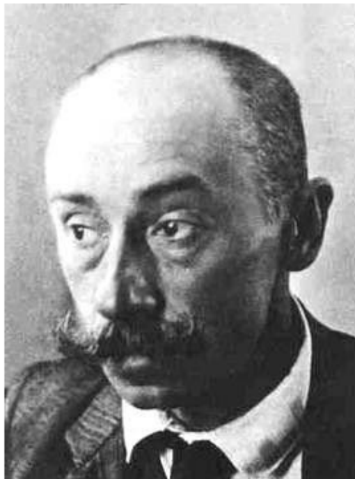
Константин Фёдорович Богаевский, фото

Создано в интеллектуальной издательской системе Ridero