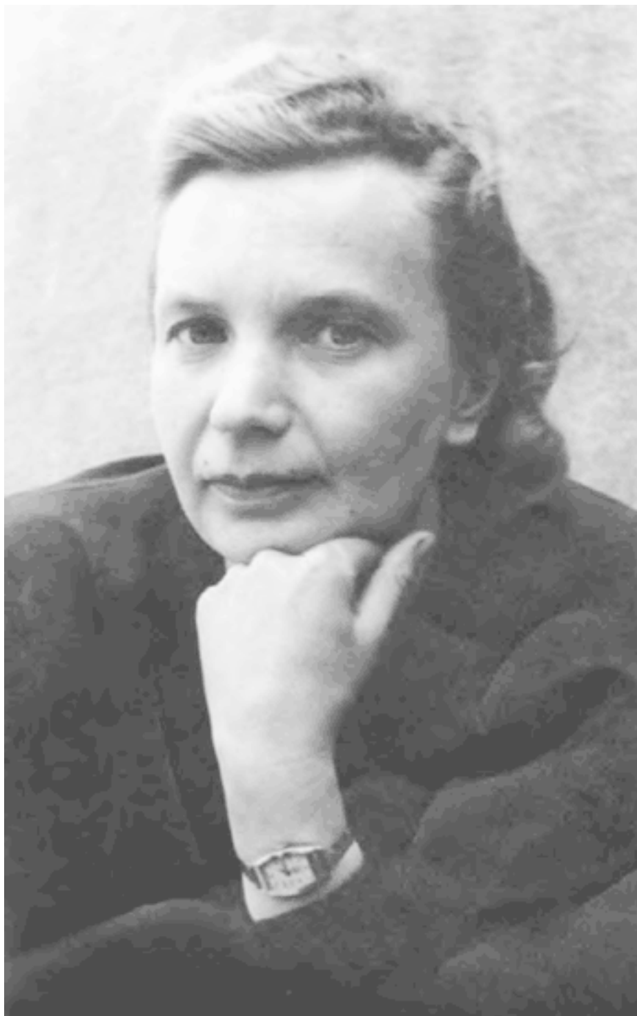
Мама, 1948 год

Часа через два наши машины свернули с трассы, и мои спутники постепенно начали просыпаться. После Венева замелькали знакомые названия: Урусово, Истомино, Подосинки... Но ни одного узнаваемого пейзажа или вида. И вот, наконец, указатель – Шишлово.