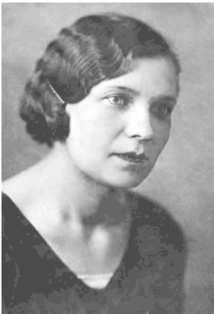
Моя мама. 1936 год

Хронологически первое памятное событие относится к сентябрю 1941 года, точнее, к первой бомбежке Москвы. Мне тогда было чуть более двух лет, но отчетливо вижу себя, стоящего в кроватке с веревочной сеткой, черную тарелку радио над своей головой, издающую непонятные мне призывы, маму, судорожно хватающую какие-то вещи и меня. Затем стол во дворе нашего дома, на котором мама меня одевала, и дальше бомбоубежище в полуподвале дома, где было много-много людей и очень мало места. При всем этом какое-то жуткое ощущение тревоги, исходившее, по всей видимости, от мамы. Конечно, детали комнаты и двора столь четко запечатлелись, наверное, в связи с тем, что там было прожито еще почти двадцать лет, но меня никогда не покидала уверенность, что помню все это я именно с того дня. Последующие бомбежки уже не вызывали такой паники, и мама, наверное, так не пугалась, поэтому другие случаи в памяти настолько четко не сохранились.