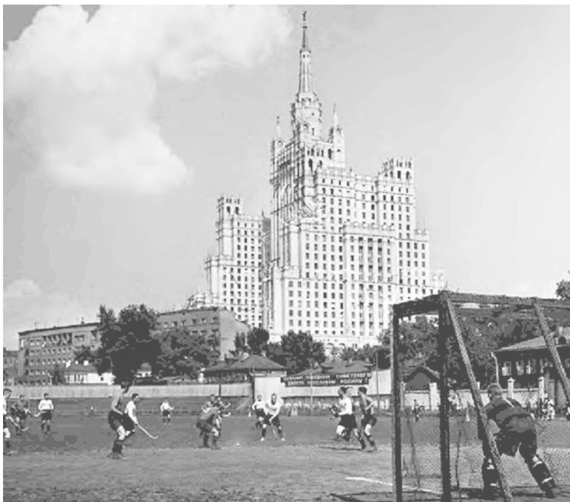
Стадион Метрострой (предположительно 1955 г.).

Увлечение спортом было поистине массовым, и охватывало практически всех моих ровесников. Так, я занимался гимнастикой, сначала в своей школьной секции, затем в районной детской спортивной школе в спортзале студенческого общежития института физкультуры им. Лесгафта, откуда меня направили в городскую детскую спортшколу, размещавшуюся в средней школе № 57 на Арбате, в Староконюшенном переулке. Три раза в неделю пешком ходил на тренировки с Красной Пресни на Арбат через старые арбатские переулки, – это было еще до того, как их уничтожил Калининский проспект. Там я получил второй юношеский разряд в соревнованиях на первенство Москвы. Талантов особых не имел, поэтому, как я считал, для меня это было неплохо.