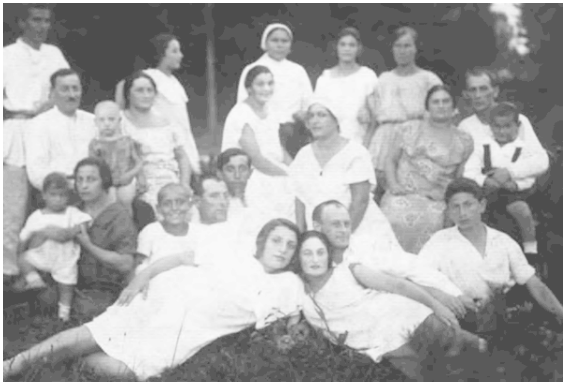
Мои родственники с папиной стороны: дедушка, бабушка, папа и все его родные и двоюродные сестры и братья. Приблизительно 1928 год

жение, что дедушкиным братом был Григорий Наумович Каминский, тоже родом из тех мест, что и мои родственники, один из руководителей ВКП(б), с 1937 года нарком здравоохранения СССР, расстрелянный в феврале 1938 года по приказу Сталина. Однако, кроме некоторого внешнего сходства по фотографиям и сведений о том, что у дедушки действительно был брат примерно того же года рождения, пока никаких доказательств этому не имею. Тетушки мои и мама об этом либо ничего не знали, либо, скорее всего, до конца своих дней боялись что-нибудь сказать о бывшем враге народа, хотя и реабилитированном в 1957 году.