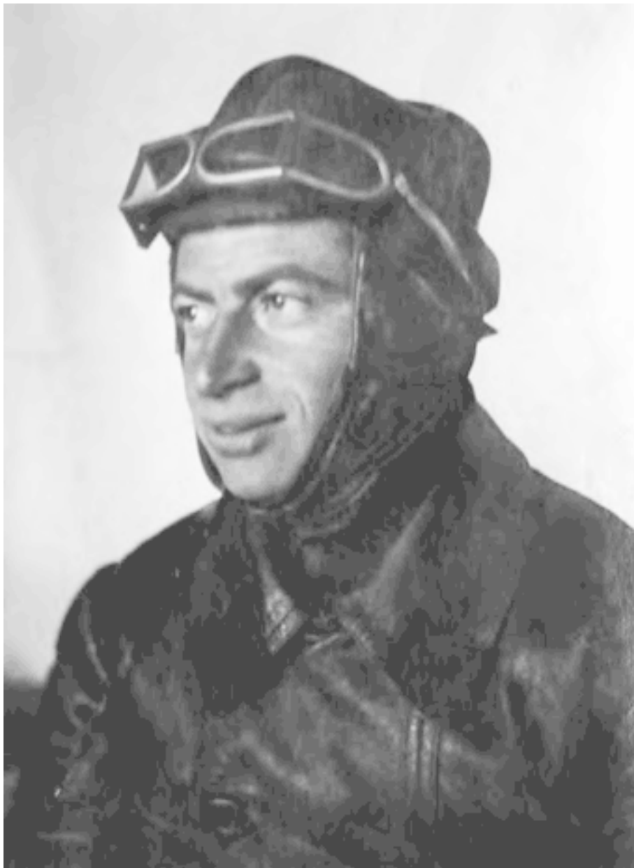
Мой папа – танкист на Дальнем Востоке