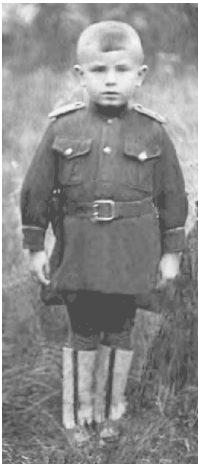
Новая лейтенантская форма мне очень нравилась. 1945 год

Я стараюсь придать и обнинским воспоминаниям какую-то хронологическую последовательность, хотя значения это никакого не имеет, просто так легче вспоминать. Так вот, следующее весьма важное для меня событие, запомнившееся на всю жизнь и послужившее мне хорошим уроком, произошло, видимо, осенью того же года. Дело в том, что в обнинской детской колонии, как и в той, что на Шаболовке в Москве, изготавливались снаряды. А в конце