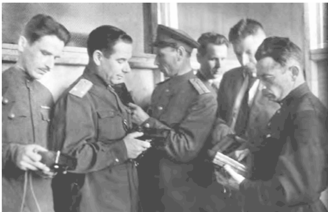
Руководители Обнинской детской колонии с новой мирной продукцией. Мой папа – крайний справа. 1945 год

войны колония получила задание об освоении мирной продукции, которой стали симпатичные радиодинамики в разноцветных пластмассовых корпусах, наверное, по какой-нибудь немецкой технологии. Эту продукцию уже не скрывали, показывали всем опытные образцы, и даже сфотографировали с ними все руководство колонии. Однако осенью у нас дома я услышал разговор папы с кем-то из начальства о том, что колонию ликвидируют, а на ее месте пленные немцы будут строить какой-то секретный объект. Думаю, я бы не придал этому разговору никакого значения, если бы не слова «пленные немцы», которые не могли мне не запомниться. Все, что было связано с немцами, или на нашем детском языке фрицами, нас страшно интересовало, так как мы не представляли их нормальными людьми. В нашем воображении они рисовались страшными и звероподобными. Такое представление усугублялось еще и видом огромной немецкой самоходной артиллерийской установки мрачного грязно-желтого цвета, подбитой на одну гусеницу и брошенной фашистами при отступлении в начале 1942 года. Она стояла в лесу недалеко от нашего дома, и мы с ребятами часто играли там, изображая попеременно, то наших, то немцев, находили стреляные гильзы, патроны и много других интересных и ценных для нас вещей, свидетелей недавних боев.