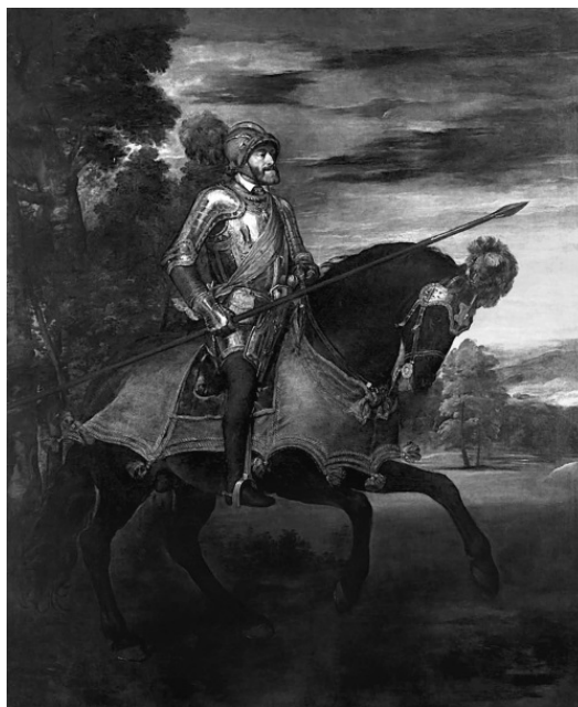
Император Карл V в сражении при Мюльберге.