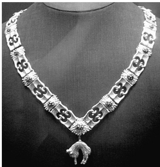
Знак ордена Золотого Руна, прикрепленный к центральному звену-огниву