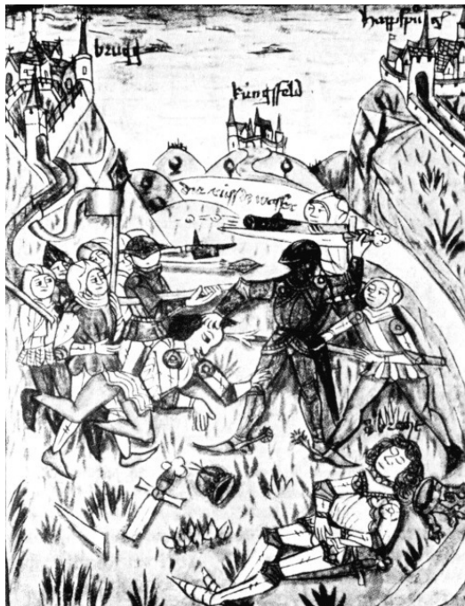
Убийство короля Альбрехта I.

1322 г. разбил Фридриха и Леопольда в битве у Мюльдорфа. Кстати, выбор Альбрехтом I имен для своих сыновей не случаен: Фридрихами и Леопольдами были многие Бабенберги, представители прежнего австрийского герцогского рода, вымершего в середине XIII века. Называя собственных потомков в честь представителей первого австрийского герцогского рода, Альбрехт хотел символически породниться с Австрией, завоеванной его отцом.