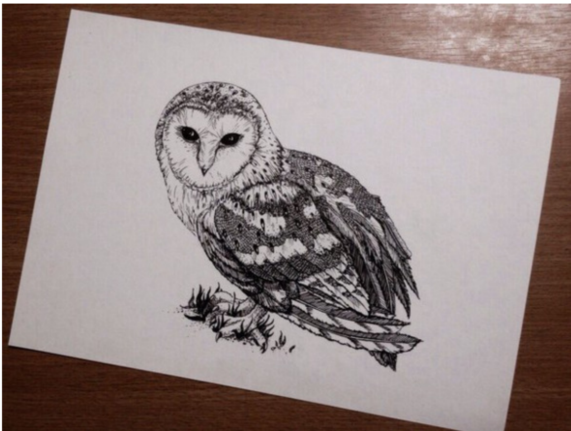
иллюстрация Валерии Стручковой