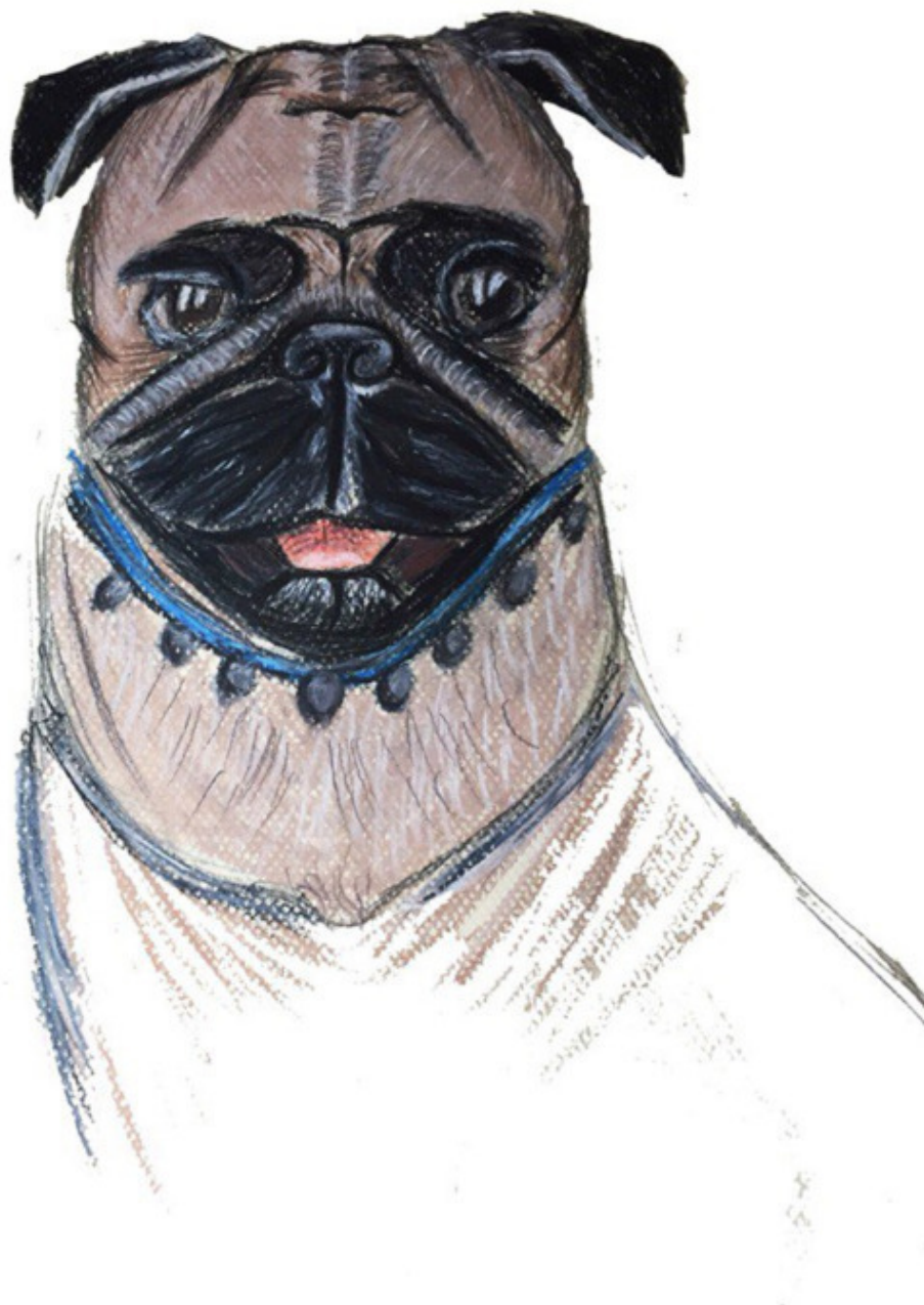
рисунок Юлии Нагубневой

А люди спуют суетливо, Сердца затворив на замок, И мокнет под плачущим ливнем Ненужный бумажный листок.