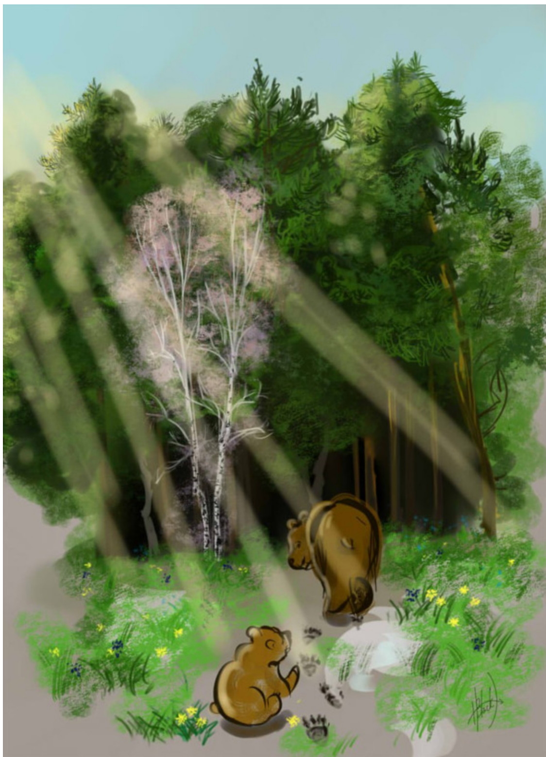
иллюстрация Ольги Черных

Со дня рождения сверкает, — Лишь тот, поверьте мне, всегда Лишь тот живёт и выживает. Достоинств этих всех набор — Натура моего удела,