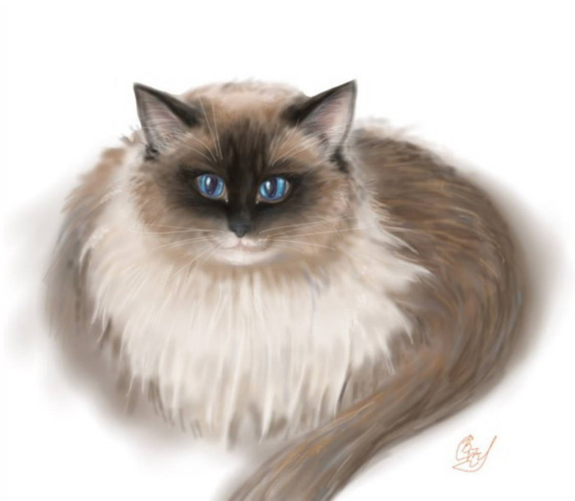
иллюстрация Валерии Стручковой