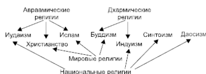
Рис. 1. Современные религии

По степени распространенности различают мировые и национальные религии. Мировые религии распространены на значительной территории и оказали (и оказывают до сих пор) огромное влияние на ход всемирной истории. К ним относят христианство , ислам и буддизм . Национальные религии, широко распространенные в прошлом, в настоящее время представлены лишь иудаизмом (религия евреев), индуизмом (религия индийцев), даосизмом (религия китайцев) и синтоизмом (религия японцев). Иногда иудаизм, христианство и ислам объединяют в группу авраамических религий (от имени Авраама, почитаемого во всех трех патриархом). Эти религии также называют монотеистическими (от греческих слов «моно» – «один» и «теос» – «бог»), так как они провозглашают единобожие – почитание Единственного Бога-Творца. В противоположность им, индуизм и основанный на нем буддизм объединяют под именем дхармических (от санскритского слова «дхарма» – «закон») религий. Их общей чертой является вера в перерождение всех живых существ после смерти в новом теле. Дхармические, как и многие другие религии, являются политеистическими (от греческих слов «поли» – «много» и «теос» – «бог»), то есть допускающими поклонение многим богам. Приверженцы монотеистических религий называют политеистов «язычниками».