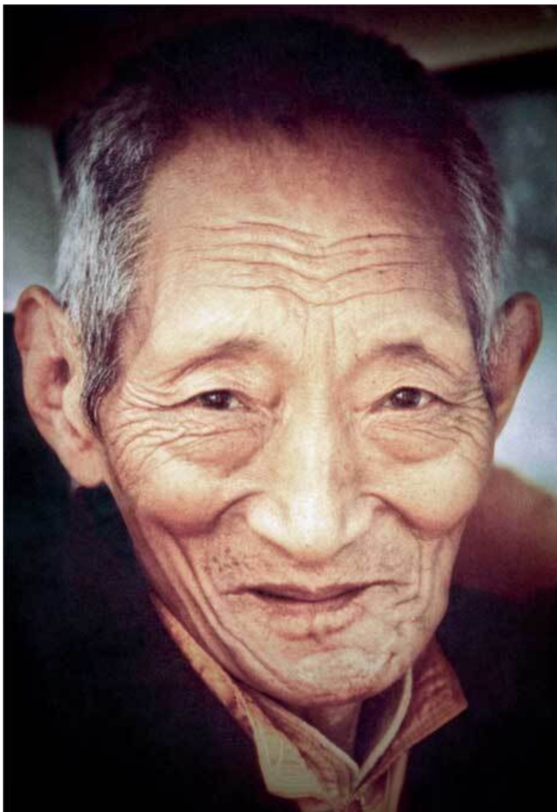
Калу Ринпоче Углубленный буддизм. Том II. От Хинаяны к Ваджраяне