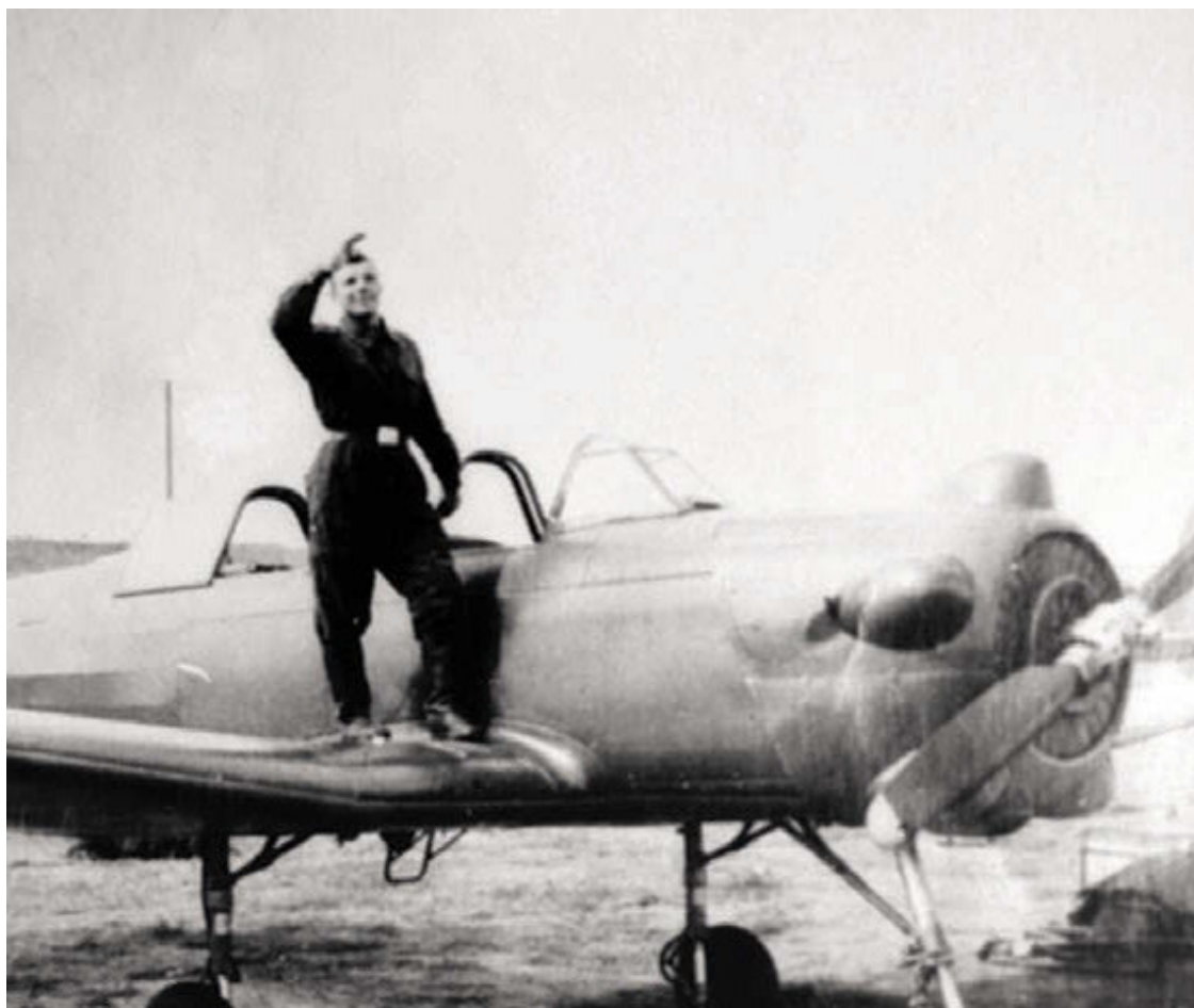
1956 год. Город Оренбург. Я стою на крыле самолета

Случилось так, что во время моего первого самостоятельного полета на аэродроме присутствовал корреспондент местной газеты, в которой появилась моя фотография в летном шлеме и такое упоминание обо мне: «Сегодня учащийся индустриального техникума комсомолец Юрий Гагарин совершает свой первый самостоятельный полет. Юноша волнуется. Но движения его четки и уверенны. Перед полетом он тщательно осматривает кабину, проверяет приборы и только после этого выводит свой Як-18 на линию исполнительного старта. Гагарин поднимает правую руку, спрашивает разрешения на взлет. «Взлет разрешаю», – передает по радио руководитель полетов К. Ф. Пучик. В воздух одна за другой взмывают машины...» В тот день я понял, что на всю жизнь полюбил небо.