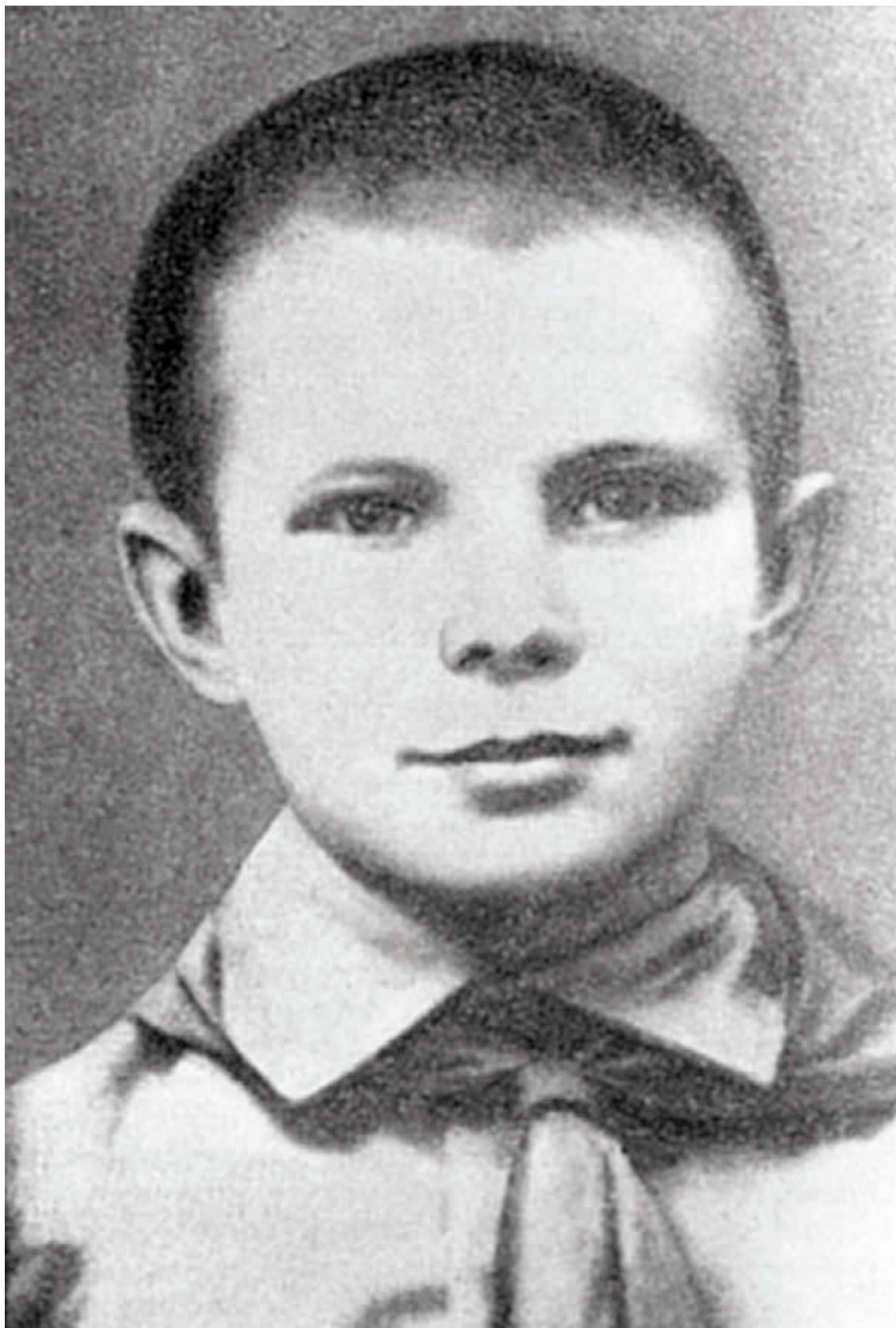
Это одна из немногих фотографий, сделанных в школьные годы