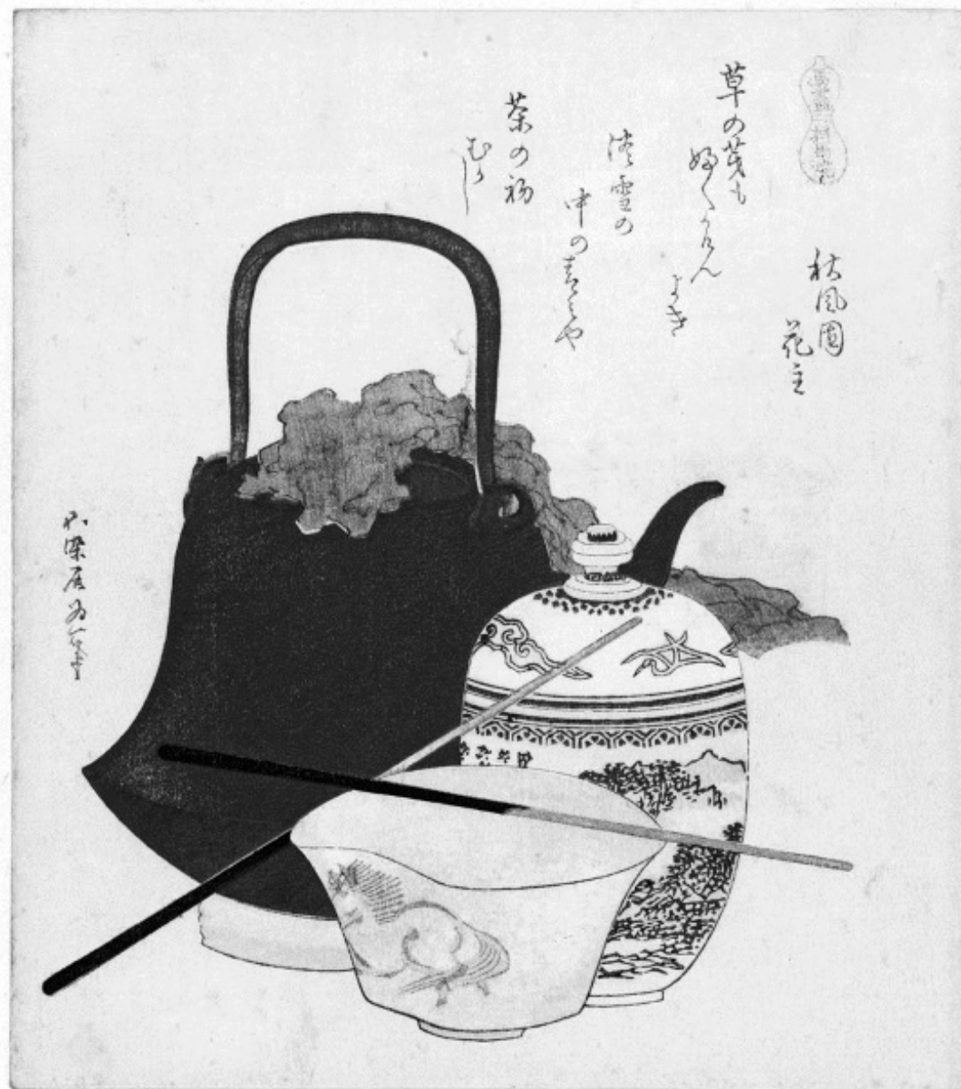
Кацусико Хокусай. Натюрморт.

окружающему город, и, если дома самураев некрасивы снаружи, но совершенны и величавы внутри, люди не будут доверять ни господину, ни самим самураям. С другой стороны, внутренние покои дома, где живут жена и члены семьи, также должны быть правильно обустроены, какими бы невидимыми для чужого глаза они ни были.