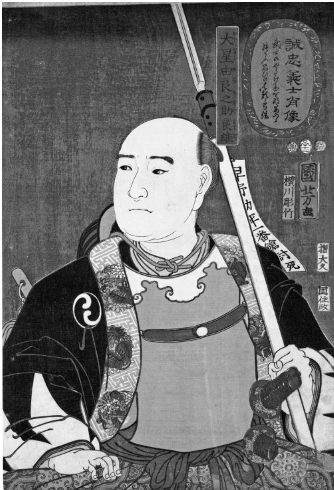
Утагава Куниёси. Портрет добродетельного самурая. 1852.

С другой стороны, тот, кто не отважен, лишь внешне предан господину и почтителен к родителям, не имея никаких искренних побуждений таким оставаться. Безразличный к указа-