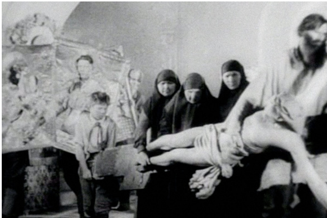
«Бежин луг», 1935. Авторы: режиссер и сценарист Сергей Эйзенштейн; сценаристы Исаак Бабель, Александр Ржешевский, Иван Тургенев; композитор Гавриил Попов

снятый по сценарию Александра Ржешевского, Эйзенштейна сначала унизили, запретив его «Бежин луг» и заставив его каяться в допущенных там мнимых ошибках, а затем довели до инфаркта, ставшего для него роковым, объявив вторую серию «Грозного» грубой политической ошибкой, удостоенной разного Постановления ЦК партии.