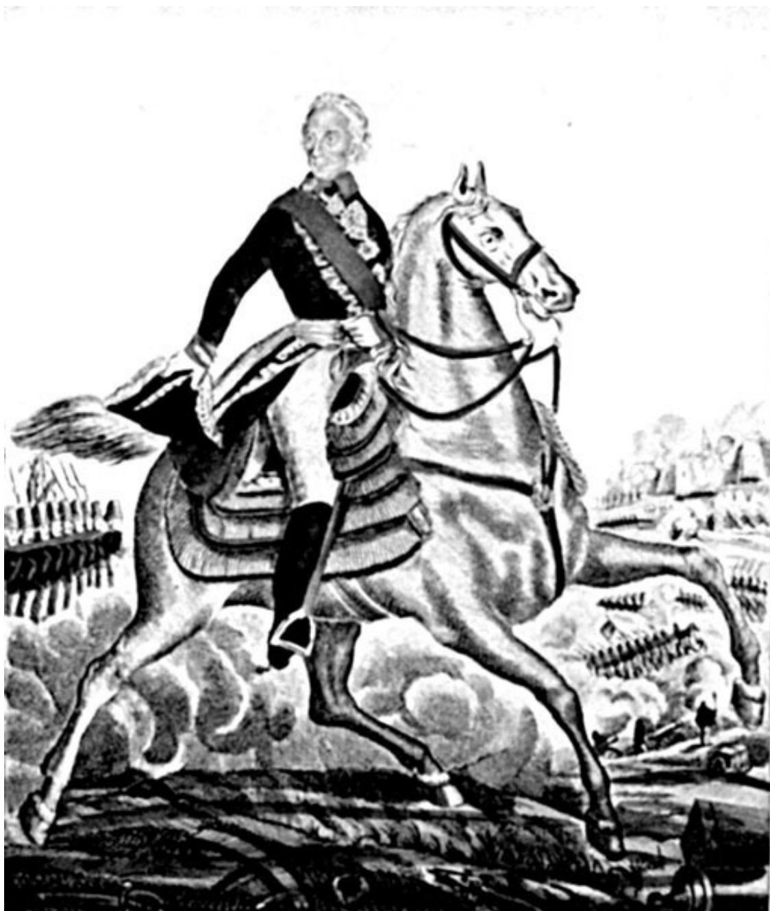
Лубочный образ А.В. Суворова

Здесь в ходе Семилетней войны начинает складываться боевой стиль будущего полководца: тотальная продуманность боя, быстрое и решительное осуществление своего замысла. Причем настолько быстрое и решительное, что фактически неожиданное для противника. Иными словами, противник, возможно, и ожидал, что Суворов нагрянет именно отсюда, но никогда не ожидал такой скорости и такой силы удара. Суворов рискует, но всегда рискует оправданно, не пробует, не пытается, не старается, а тщательно готовит и наносит молниеносный удар, предпочитая холодное оружие (штыки или сабли).