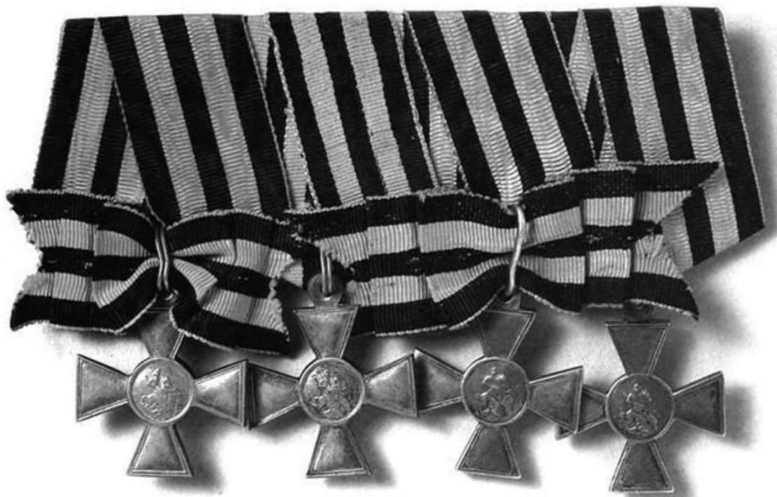
Полный «георгиевский бант»

Казалось бы, проблема легко решалась с помощью орденов, но не тут-то было. Ведь награждение любым орденом до 1845 г. влекло за собой получение кавалером потомственного дворянства. Т. е. все солдаты-орденоносцы автоматически становились бы дворянами, и в сословной структуре Российской империи начался бы настоящий хаос. Поэтому было решено учредить особый «знак отличия», который ценился бы выше медалей, но при этом не считался орденом, хотя и копировал бы его внешний вид.