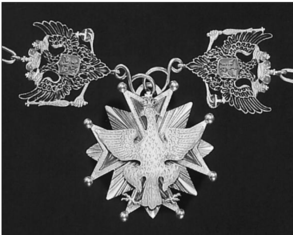
Орден Белого Орла

Первым иностранным орденом, вошедшим в наградную систему России, в 1797 г. стал орден Св. Анны, вторым в 1798-м – орден Св. Иоанна Иерусалимского. В 1831 г. к нему прибавилась еще одна зарубежная награда – польский орден Белого Орла, учрежденный в 1705-м курфюрстом Саксонии и королем Польши Августом II Сильным. Это была высшая награда Речи Посполитой, которой в течение XVIII века удостоились многие выдающиеся деятели России, включая Петра I, А.Д. Меншикова, Б.П. Шереметева, Я.Б. Брюса.