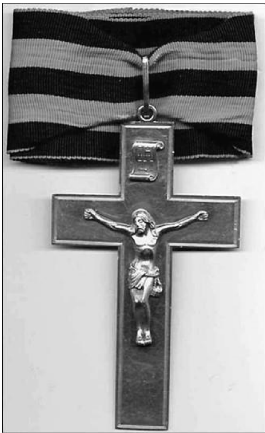
Золотой наперсный крест на Георгиевской ленте