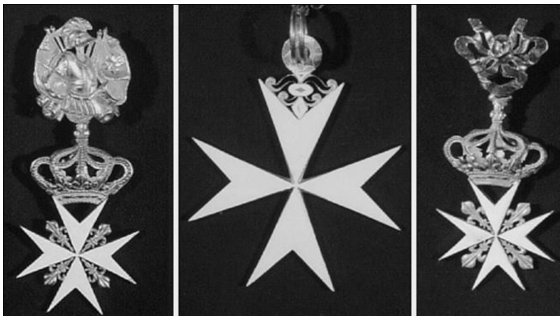
Орден Св. Иоанна Иерусалимского (Мальтийский крест)

Появлению этого ордена в системе российских наград невольно поспособствовал... Наполеон Бонапарт. Когда в 1798 г. его войска захватили остров Мальта, руководство Мальтийского ордена обратилось к императору России Павлу I с просьбой принять орден под свое покровительство. Павел ответил согласием, и 29 ноября 1798 г. орден Святого Иоанна Иерусалимского был включен в систему российских наград, а сам государь стал считаться Великим магистром ордена.