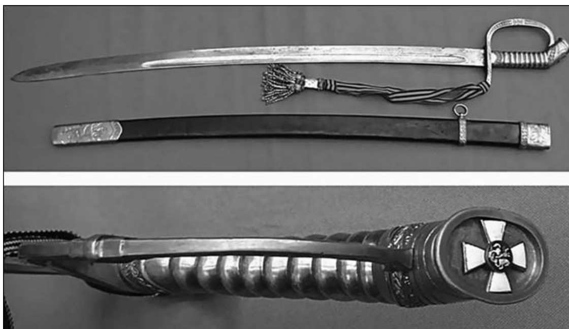
Наградная георгиевская шашка. Конец XIX в.

Первое наградное оружие, врученное в России, сейчас хранится в музее-заповеднике «Царское Село». Эта сабля, золотая надпись на клинке которой гласит о том, что ее пожаловал стольнику Богдану Матвеевичу Хитрово царь Михаил Федорович, правивший в 1613–1645 гг. Но был ли это знак отличия за боевой подвиг или просто знак милости государя – неизвестно. А вот «шпага золотая с богатыми украшениями алмазами», врученная 27 июля 1720 г., досталась князю Михаилу Михайловичу Голицыну за блистательную победу над шведской эскадрой при Гренгаме. С этого дня начинается история наградного оружия России.