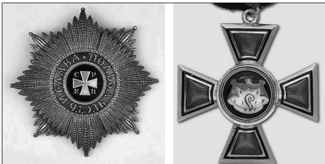
Орден Святого Равноапостольного Князя Владимира

Орден Св. Владимира предназначался для награждения как за военные, так и за гражданские заслуги. Это был первый русский орден, которым мог быть награжден обычный чиновник, не относившийся к высшим должностным лицам страны и не совершивший выдающихся подвигов на поле боя.