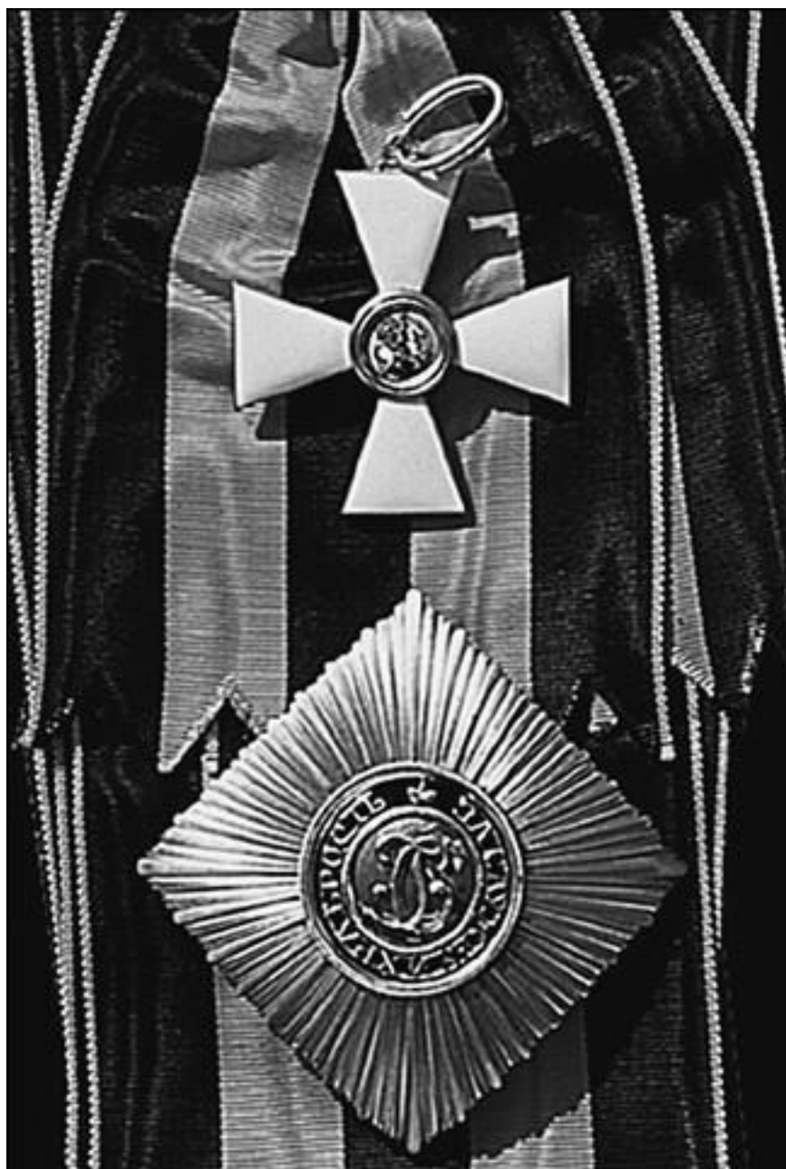
Орден Святого Великомученика и Победоносца Георгия (Россия)

Сразу заметим, что старшие степени ордена Св. Георгия были исключительно редкими даже среди высших военачальников. Так, 1-ю степень за всю историю ордена получили всего 25 человек, 2-ю – 125. Этими степенями награждал только император лично. Весьма редкой была и 3-я степень – ее удостоилось 650 человек. Самой распространенной была низшая, 4-я степень, кавалерами которой стали, по разным данным, от 10 до 15 тысяч человек (из них за боевые отличия – около 6700, за выслугу лет – свыше 7300, за 18 кампаний – около 600, за 20 кампаний – 4). Полными кавалерами ордена были всего четыре человека: генерал-фельдмаршалы светлейший князь Михаил Илларионович Голенищев-Кутузов-Смоленский, князь Михаил Богданович Барклай-де-Толли, граф Иван Иванович Дибич-Забалканский и граф Иван Федорович Паскевич-Эриванский, светлейший князь Варшавский. Может вызывать удивление отсутствие в этом списке величайшего русского полководца А.В. Суворова, но это объясняется просто: Суворов сразу получил 3-ю степень «Георгия», минуя 4-ю, а затем был награжден 2-й и 1-й степенями. Кроме Суворова, 3-ю, 2-ю и 1-ю степень ордена