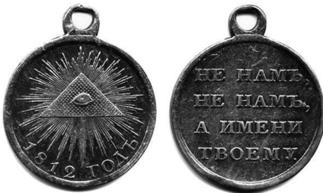
Медаль «В память отечественной войны 1812 года»

Впервые медаль была вручена 30 августа 1813 г. в Троицком соборе Александро-Невской лавры. В числе первых награжденных оказались генерал от инфантерии А.П. Тормасов, генерал-лейтенант А.Б. Фок, генерал-майор И.М. Бегичев. В действующей армии награждения начались позже, 20 ноября. В первую очередь медали получали штабисты и офицеры лейб-гвардейских полков. А поскольку награду хотели поскорее получить все, ювелиры вскоре наладили оперативный выпуск «частных» медалей и продавали их офицерам, до которых «официальная» награда пока не добралась. Поскольку порядок награждения, как уже было сказано выше, был утвержден лишь в декабре, весной 1814 г. 70 офицеров и солдат были лишены медали как не имевшие права ее носить.