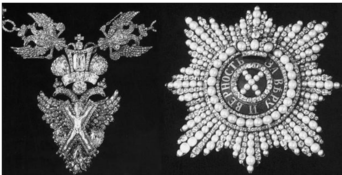
Орден Святого Апостола Андрея Первозванного

Орден был наименован в память апостола Андрея, который издавна почитался как первый проповедник христианства на Руси и ее покровитель (хотя многие историки считают рассказы о путешествии апостола в Киев и Новгород не более чем апокрифом). Так или иначе, около 70 г. в греческом городе Патры апостол был распят на косом кресте, который получил название «Андреевский». Поэтому синий Андреевский крест стал знаком нового ордена. На концах этого знака размещались буквы S.A.P.R. (Sanctus Andreus Patronus Russiae – «Святой Андрей покровитель России»). Знак надевался на муаровую голубую ленту, которая носилась через правое плечо. Орденская звезда была восьмилучевой, с девизом «За веру и верность» в центре аверса. В XVIII веке звезда ордена часто вышивалась на одежде, начиная с XIX века она выполнялась из серебра. Звезда носилась на левой стороне груди выше всех прочих наград; в том случае, если орден вручался за боевые заслуги, к знаку и звезде с 1855 г. присоединялись скрещенные мечи. Кроме того, в торжественных случаях знак ордена носился на груди на фигурной цепи.