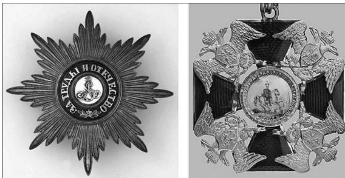
Орден Святого Благоверного Князя Александра Невского

Знак ордена представлял собой золотой крест, покрытый с обеих сторон красной эмалью (до 1816 г. – «рубиновым стеклом»). Между четырьмя концами креста размещались золотые двуглавы орлы с распушенными крыльями, «перунами» и лавровыми венками в когтях. В центре аверса был изображен Св. Александр Невский, а на реверсе – его латинский вензель SA под княжеской короной (на знаках, жалующимся лицам нехристианского вероисповедания, изображения святого с 1844 г. заменялись изображением двуглавого орла). Крест носился на шейной ленте, а в особо торжественных случаях – у бедра на наплечной ленте. Звезда ордена была серебряной, восьмиконечной, с вензелем Св. Александра Невского в центре и орденским девизом «За труды и отечество». Орденская лента красная, надевалась через левое плечо. К знаку и звезде, жалующимся за военные заслуги, с 1855 г. прилагались скрещенные мечи. В 1856 г. к ордену предполагалось ввести парадную цепь, но дальше утвержденного Александром II проекта дело не пошло. Как бы отдельную степень ордена представляли собой его алмазные знаки, которые жаловались отдельно.