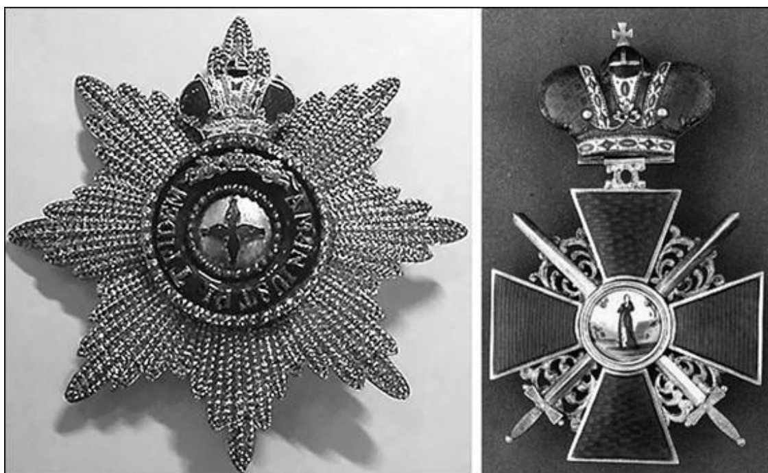
Орден Святой Анны

Один из наиболее распространенных и любимых в России орденов, имевший ласковое прозвище «Аннушка», был учрежден 14 февраля 1735 г. в Голштинском герцогстве. Дело в том, что в 1725 г. правитель этого небольшого немецкого государства герцог Карл-Фридрих женился на дочери Петра I Анне. Но три года спустя она скончалась во время родов, и в память о жене герцог решил создать особую награду. Голштинский орден Святой Анны имел одну степень и мог вручаться очень ограниченному кругу людей – число кавалеров не должно было превышать пятнадцать.