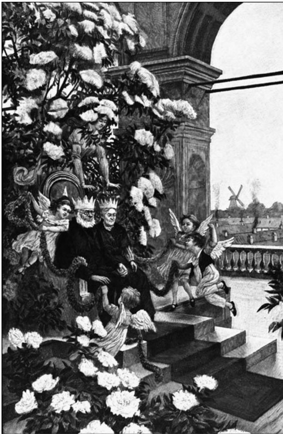
Бузинная матушка. Иллюстрация Х. Тегнера (1913). Апофеоз благодушия и довольства

Для такого междусобойчика Андерсену и нужны были волшебные существа. Они вели себя по-человечески, дружески болтали или угрюмо отмалчивались. Г. Гейне вспоминал, как