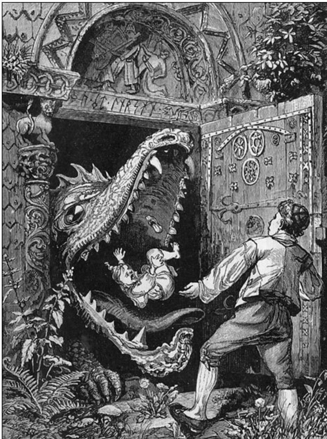
Фронтиспис нью-йоркского издания «Норвежских сказок» П. К. Асбьёрнсена (1883)