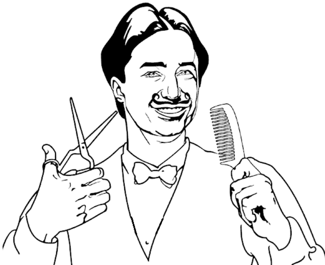
Рис. 1.4. Деревенский парикмахер

задача достаточно сложно излагается в терминах теории множеств, но для ее популяризации придумана очень интересная и простая формулировка. Итак.