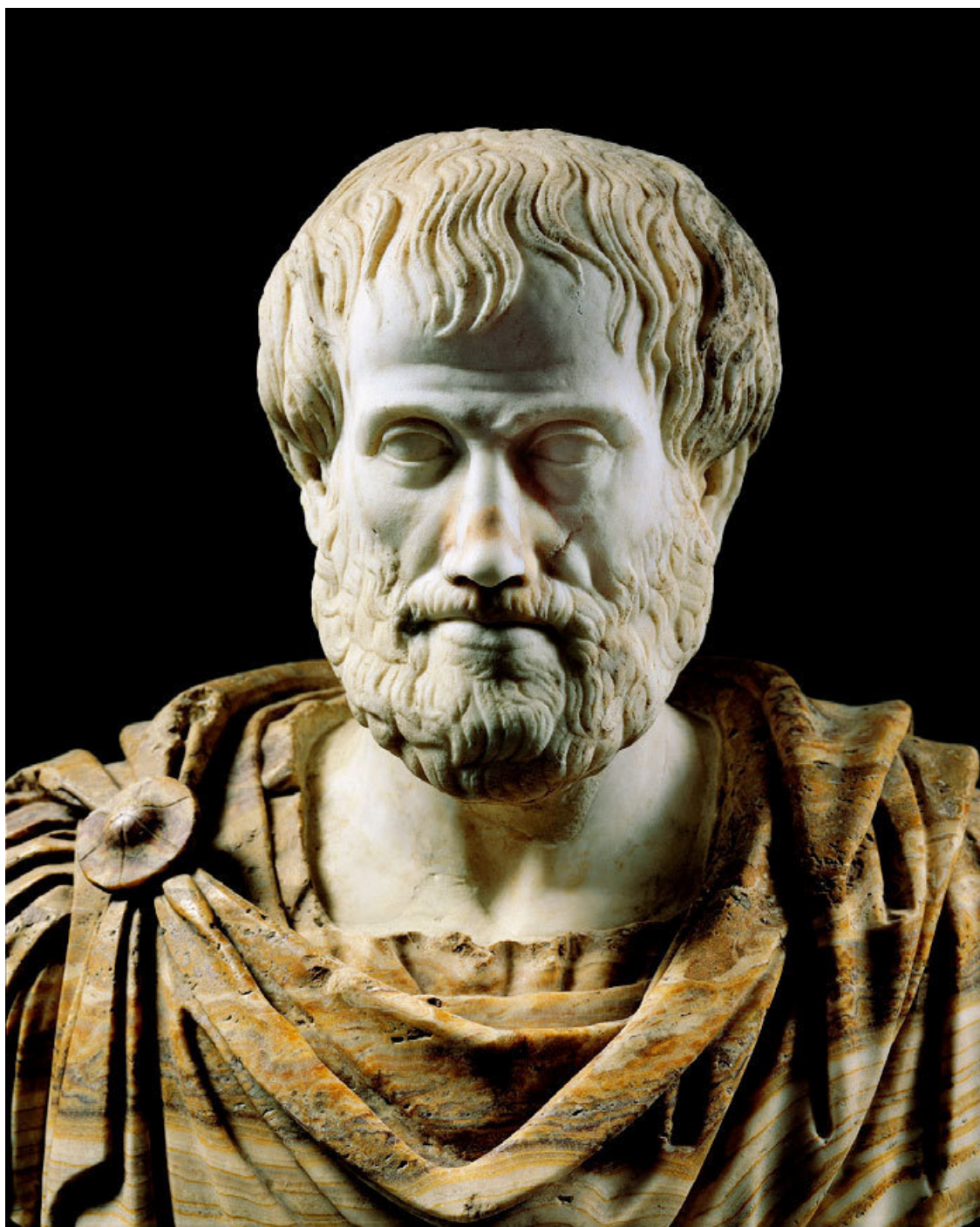
Рис. 1.3. Аристотель

Для справки. Аристотель – древнегреческий философ. Ученик Платона. С 343 г. до н. э. – воспитатель Александра Македонского. В 335 г. до н. э. основал Ликей (др.-греч. Λύκειο – Лицей), или перипатетическую школу. Натуралист классического периода. Наиболее влиятельный из философов древности; основоположник формальной логики. Создал понятийный аппарат, который до сих пор пронизывает философский лексикон и стиль научного мышления. Аристотель был первым мыслителем, создавшим всестороннюю систему философии, охватившую все сферы человеческого развития: социологию, философию, политику, логику, физику. Скульптура на рис. 1.3 естественно представляет предполагаемый облик философа.