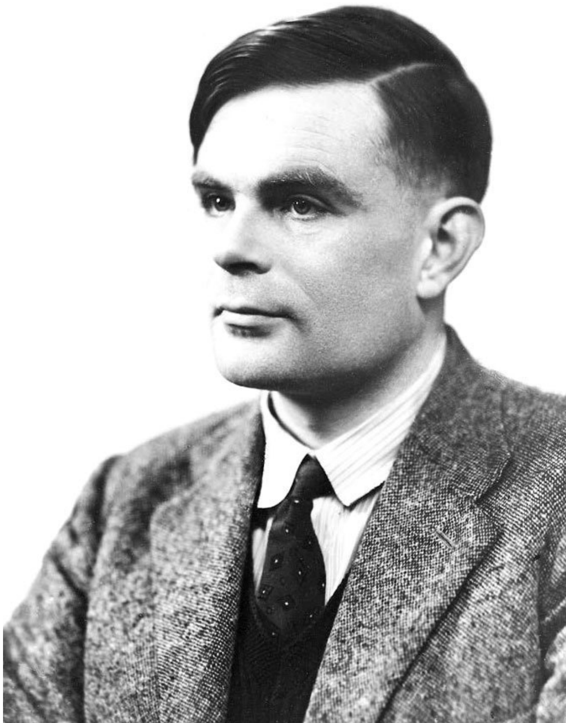
Рис. 1.2. Алан Мэтисон Тьюринг

Европейский математик Алан Тьюринг предложил следующий критерий: