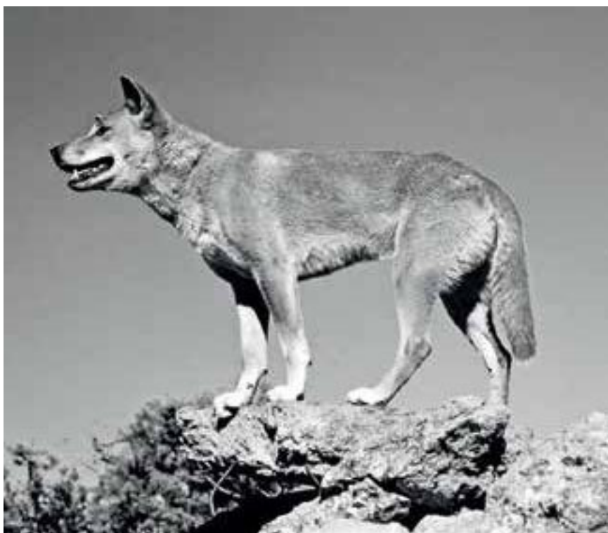
Дикая собака динго.

Родословная этих разбойников восходит, как говорят, к добродушной дворняжке, помогавшей старику-сторожу в сопредельных с заповедником келлермановских дубняках охранять спиленный лес. Собака потеряла присмотр, стала добывать в лесу что могла: постепенно отбилась от рук и, оценившись в лесу, дала начало племени дикарей.