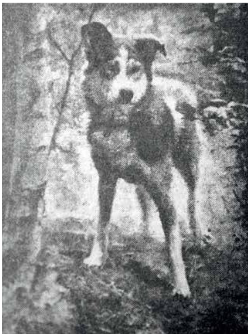
Одичавший домашний пес в Хоперском лесу.