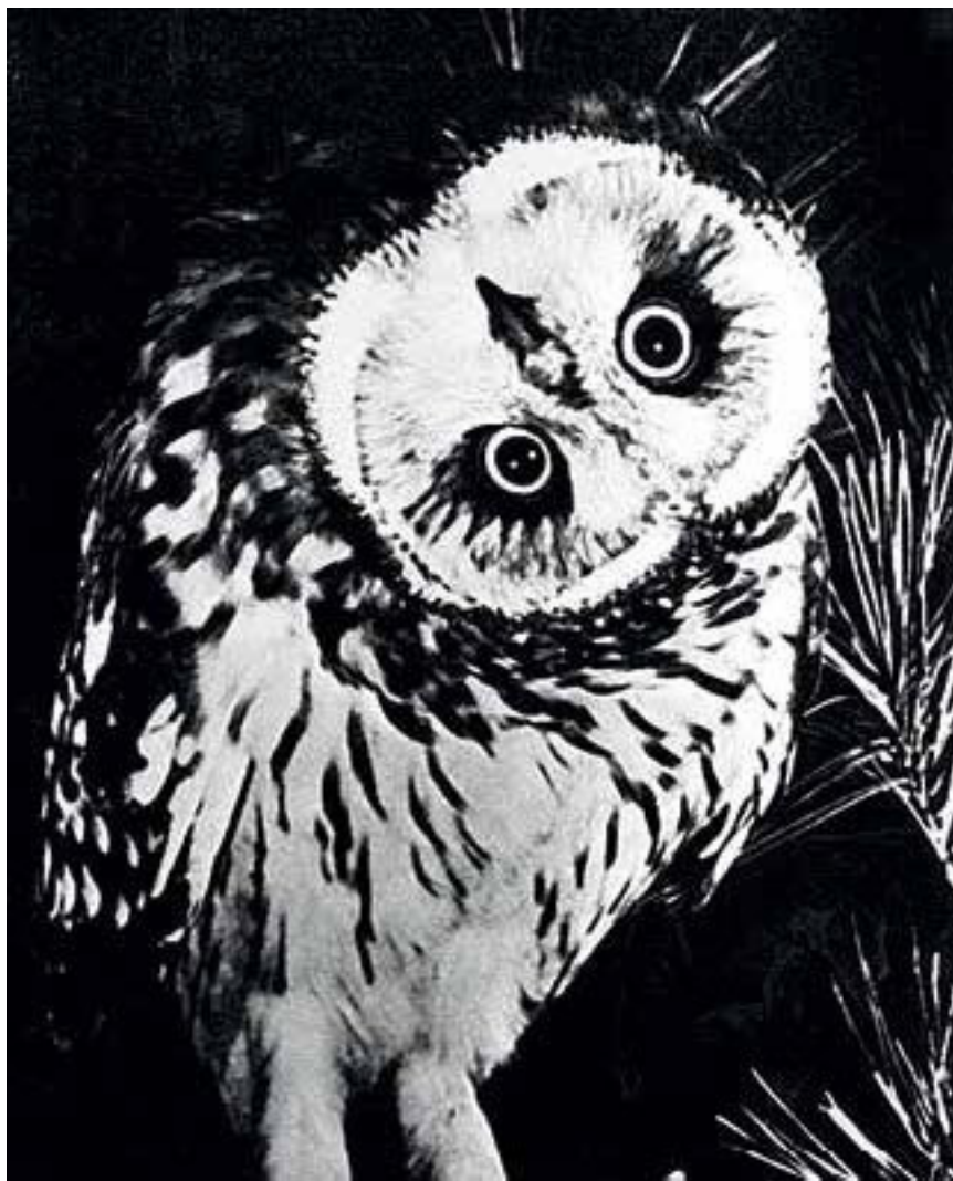
Фото из архива В. Пескова. 9 октября 1970 г.