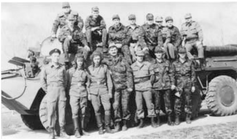
Оперативники отдела на практическом вождении БТР (полигон ОМСДОН)