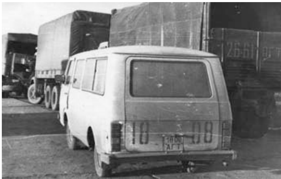
Микроавтобус РАФ одного из руководителей НФА сопровождает колонну ОМСДОН