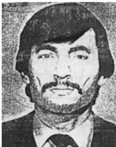
Один из главарей боевого крыла НФА Неймат Панахов