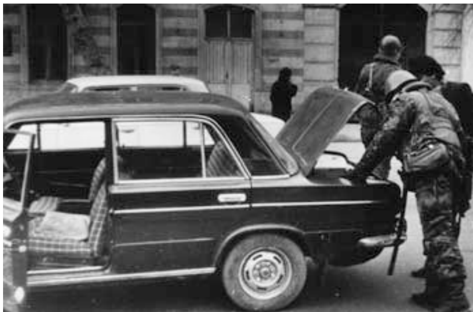
Блок-пост ОМСДОН в сквере возле комендатуры района 26 Бакинских комиссаров