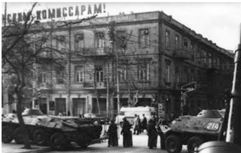
Блок-пост ОМСДОН в сквере возле комендатуры района 26 Бакинских комиссаров

Между тем под стенами гостиницы в нескольких местах «фронтовики» выкопали длинные канавки. Когда следом подогнали бензовоз и из шланга в эти траншеи стали сливать бензин, мы все реально ощутили, что дело затевается нешуточное и оно «пахнет керосином». Паниковать не стали, а приготовили всю имеющуюся противопожарную технику к действию. Назначили по участкам старших и наметили дополнительные пути эвакуации из здания.