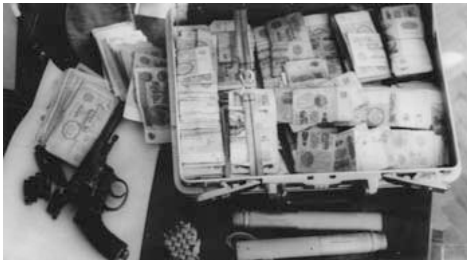
Оружие, патроны, сигнальные ракеты, большие деньги, изъятые в штабе НФА