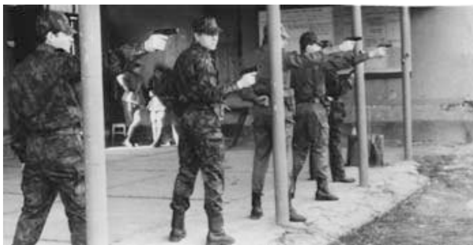
Надёжный «Макарыч» (ПМ) в руках опера только на крайний случай