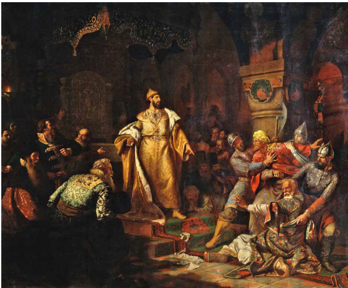
Одна из самых известных легенд об Иване III: Иван III разрывает ханскую грамоту. Художник Шустов Н. С.

Главной стратегической целью был избран Смоленск, на который двинулась рать Юрия Захарьича, к которому затем подошли на помощь Д. В. Щеня и И. М. Воротынский. Здесь произошло одно из первых известных нам местнических столкновений: Даниил Щеня стал воеводой большого полка, а Юрий Захарьич – сторожевого. Он недоволен написал великому князю: «То мне стеречи князя Данила». В ответ последовал грозный окрик государя всея Руси: «Гараздо ли так чинишь, говоришь: в сторожевом полку быти тебе непригоже, стеречь княж Данилова полку? Ино тебе стеречь не князя Данила, стеречи тебе меня и моего дела. А каковы воеводы в большом полку, таковы чинят и в сторожевом полку, ино не сором тебе быть в сторожевом полку». Новый командующий, Даниил Щеня, показал себя с лучшей стороны и наголову разгромил со своими воинами 4 июля 1500 г. литовскую армию гетмана Константина Острожского в битве при Ведроши. В ноябре 1501 г. войска князя Александра Ростовского разбили рать Михаила Ижеславского под Мстиславлем. Смоленск все больше оказывался в окружении русских армий.