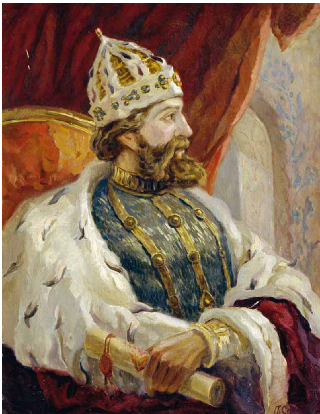
Царь Иван III. Художник Сергеев П. Г.