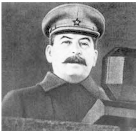
И.В. Сталин на трибуне Мавзолея во время легендарного парада 7 ноября 1941 г.

Д.Т. Язов: – Сталину до финала дойти не позволили. Сошлись на кандидатуре Александра Невского. Слов нет, кандидатура достойная, но кто бы вспомнил о ней, спустя несколько веков, если бы не всё тот же Иосиф Виссарионович. Это он в грозные дни ноября 1941 года, когда немцы стояли у стен Москвы, произнёс с трибуны мавзолея: «Пусть вдохновляет Вас в этой войне мужественный образ наших великих предков – Александра Невского, Дмитрия Донского, Кузьмы Минина, Дмитрия Пожарского, Александра Суворова, Михаила Кутузова». Это был легендарный военный парад 7 ноября 1941 года. Под сталинское напутствие прямо с Красной площади войска уходили на фронт. Кто может вычеркнуть из этой суровой истории имя великого вождя и прославленного полководца?