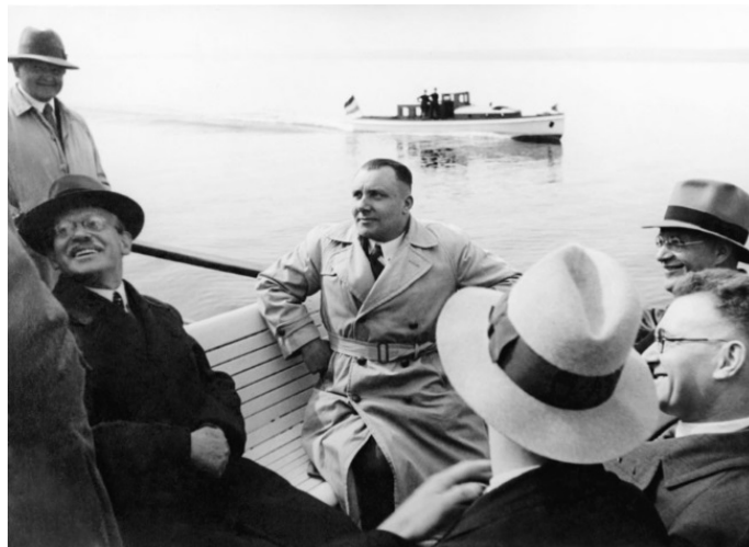
Мартин Борман – личный секретарь и ближайший соратник Гитлера

Внешне Мартин Борман был больше похож на безобидного провинциального бухгалтера, чем на одного из первых лиц Третьего рейха. Приземистый человек с приличным брюшком и головой, вечно втянутой в плечи. Всегда висящая мешком военная униформа. Заурядный образ дополнял бесформенный портфель, торчащий из-под мышки. Однако этого человека боялись все!