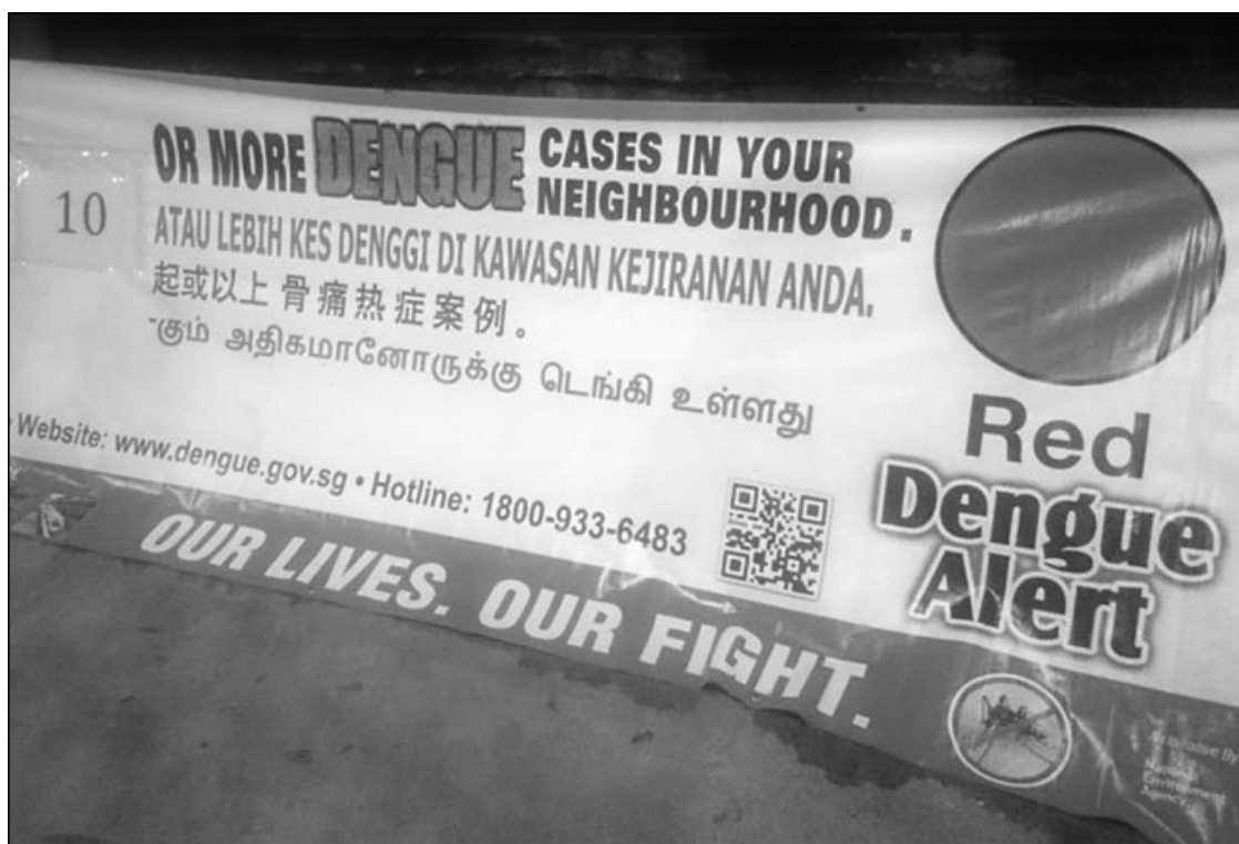
Плакат, предупреждающий об опасности лихорадки денге

В наши дни эта болезнь отступила. Но и теперь достаточно одного подозрения на желтую лихорадку, чтобы отправить человека в изолятор. Ведь, несмотря на успехи современной медицины, смертность от этой болезни по-прежнему высока (20–50 %).