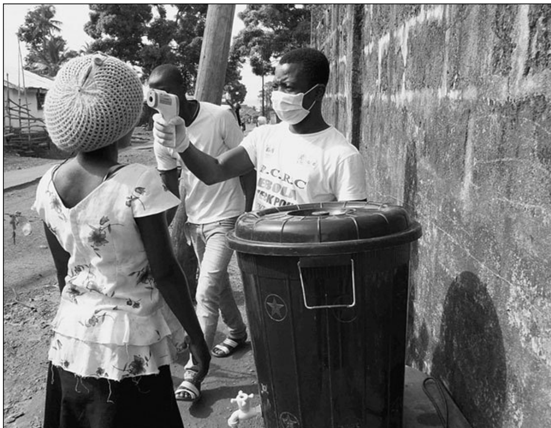
Выявление симптомов Эболы в Сьерра-Леоне

К концу года, прогнозировали тогда сотрудники ВОЗ, число инфицированных должно было достичь 20 тысяч человек, а по расчетам ученых из Колумбийского университета, даже 200 тысяч человек. В те дни специалисты в страхе обсуждали, удастся ли остановить болезнь.