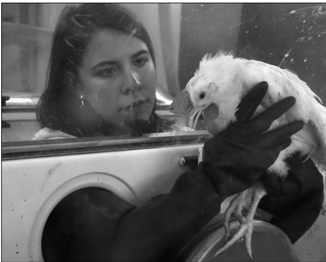
С каждым годом количество вирусов птичьего гриппа в Азии растет

Одно из очень распространенных в дикой природе заболеваний – это птичий грипп. На протяжении многих тысячелетий птицы являются переносчиками вирусов гриппа. Только в наши дни в различных районах планеты встречается не менее пятнадцати возбудителей птичьего гриппа. Как правило, они не опасны для человека, поскольку протеины, расположенные на поверхности этих вирусов, имеют такую форму, что не могут пристыковаться к рецепторам наших клеток, а потому сами вирусы не способны проникнуть внутрь клеток – так же, как вы, читатель, с ключами, лежащими у вас в кармане, не сумеете попасть в квартиру этажом выше или ниже.