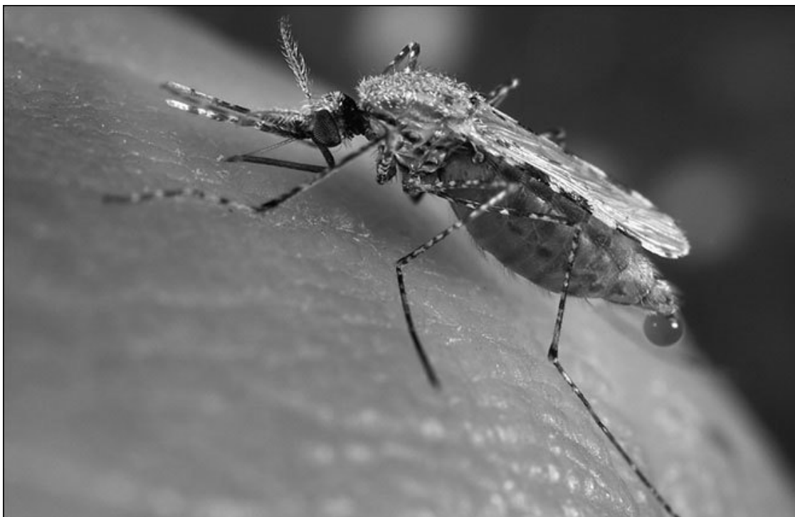
Анофелесы (малярийные комары), переносчики паразитов, широко распространены

Разумеется, лучший способ борьбы с инфекционными болезнями – вакцинация. С ранних лет прививки защищают нас от опасных недугов. Вот только возбудителями малярии являются не вирусы и бактерии, а одноклеточные паразиты. Пока же в распоряжении врачей нет ни одной надежной вакцины против болезней, вызываемых ими.