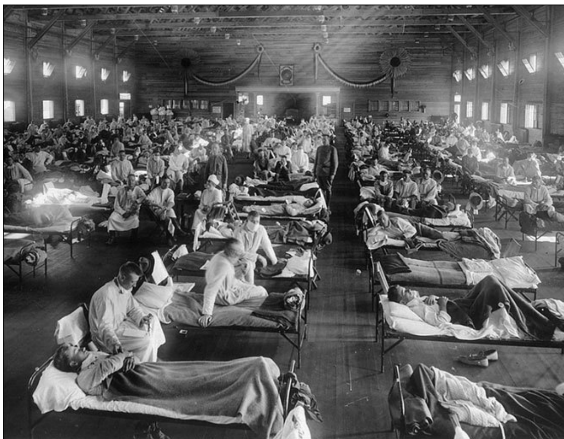
Многочисленные жертвы пандемии испанки. 1918 год

Только за последние 15 лет мир трижды жил в ожидании страшной, надвигающейся на всех эпидемии. Трижды мир охватывала паника. Сообщения из китайских больниц были сродни сводкам с Западного фронта, где перемены если и ожидались, то к худшему. Трижды мир обожгло воспаленным, чумным дыханием болезни, но призрак ее ускользал, не оставляя в людях ни потрясений, ни тревог. Так было в 2003 году во время вспышки атипичной пневмонии, в 2004–2005 годах во время эпидемии птичьего и в 2009 году – свиного гриппа. Пресса же подхватывает самые фантастические слухи и повторяет их, пока людей не переполнит отвращение и к этим слухам, и к проблеме, породившей их.