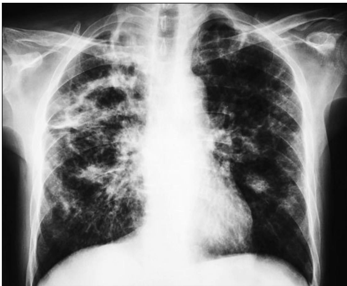
Рентгенограмма грудной полости больного туберкулезом

С давних времен туберкулез был спутником бедности. Вот и сегодня он встречается прежде всего там, где уровень жизни невысок, в странах третьего мира. Наиболее высока заболеваемость им в Юго-Восточной Азии и Африке. Очень тяжелое положение сложилось в Индии. По статистике, здесь каждую минуту один человек умирает от туберкулеза. В последние два десятилетия участились случаи заболевания им в странах Восточной Европы и бывшего СССР.