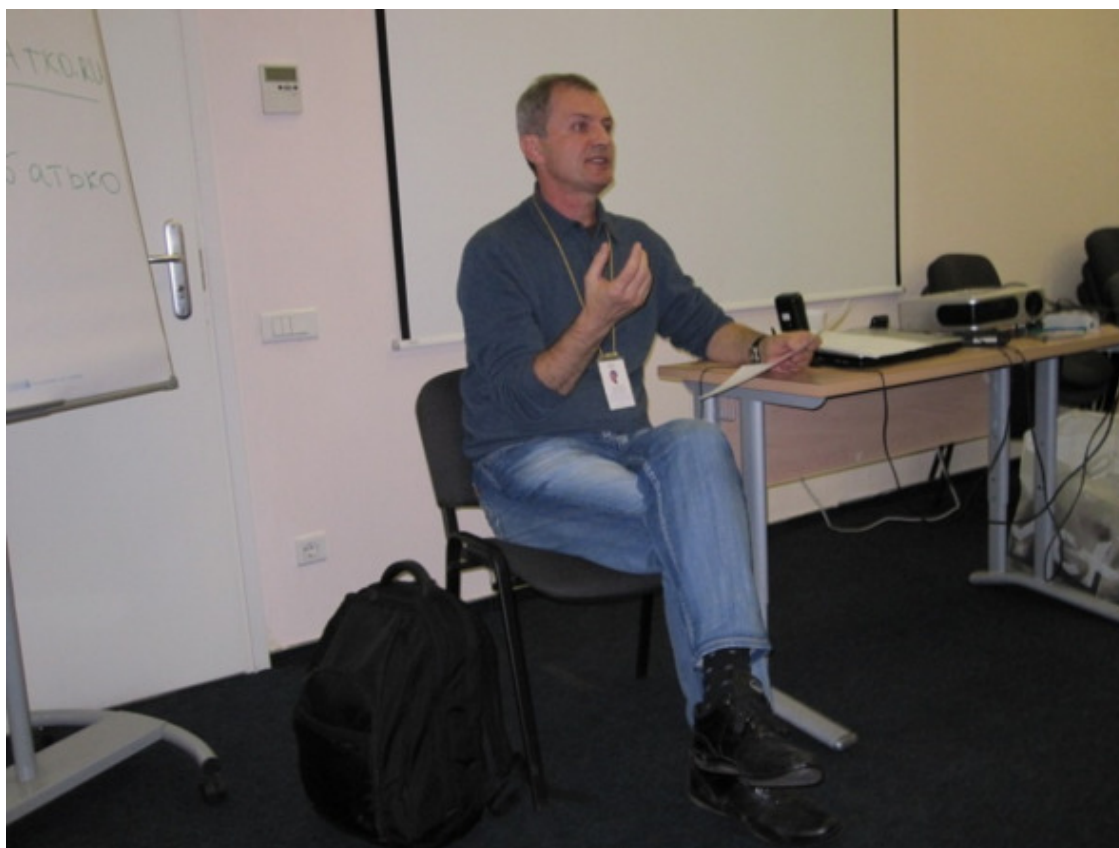
Владимир Майков, основоположник холотропного дыхания в России