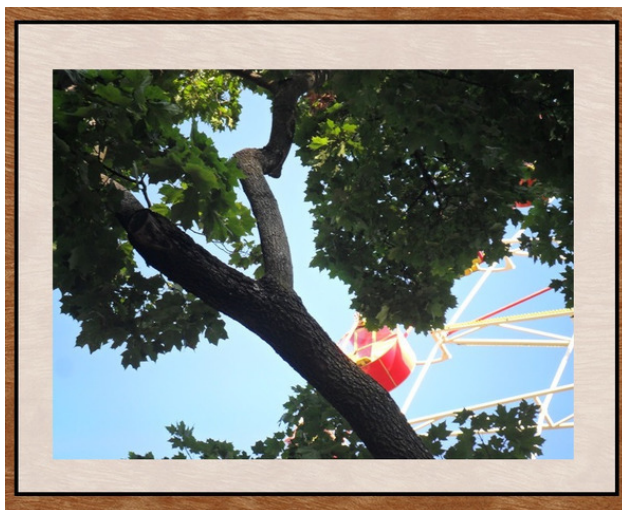
Минск. Парк Горького. Колесо обозрения.