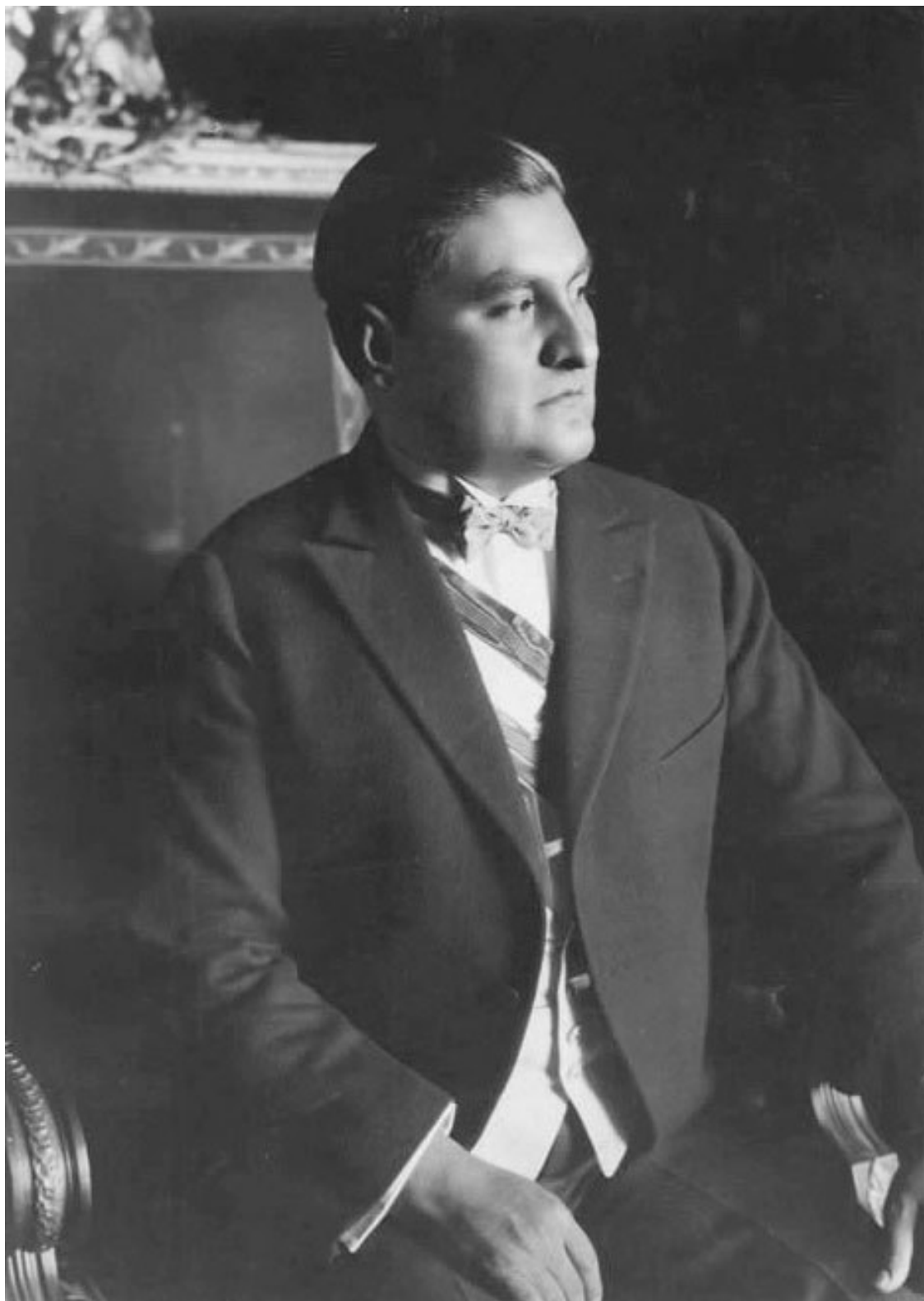
Эмилио Портес Хиль, президент Мексики в 1929–1930 годах

5 сентября 1928 года Кальес собрал ведущих генералов, прибывших в столицу для того, чтобы прослушать его послание Конгрессу. От Портеса Хиль он наверняка уже знал, что генералы собираются предъявить ему ультиматум и готовы к открытому мятежу. Не теряя присутствия духа, президент ясно дал понять, что выдвижение любым из генералов своей кандида-