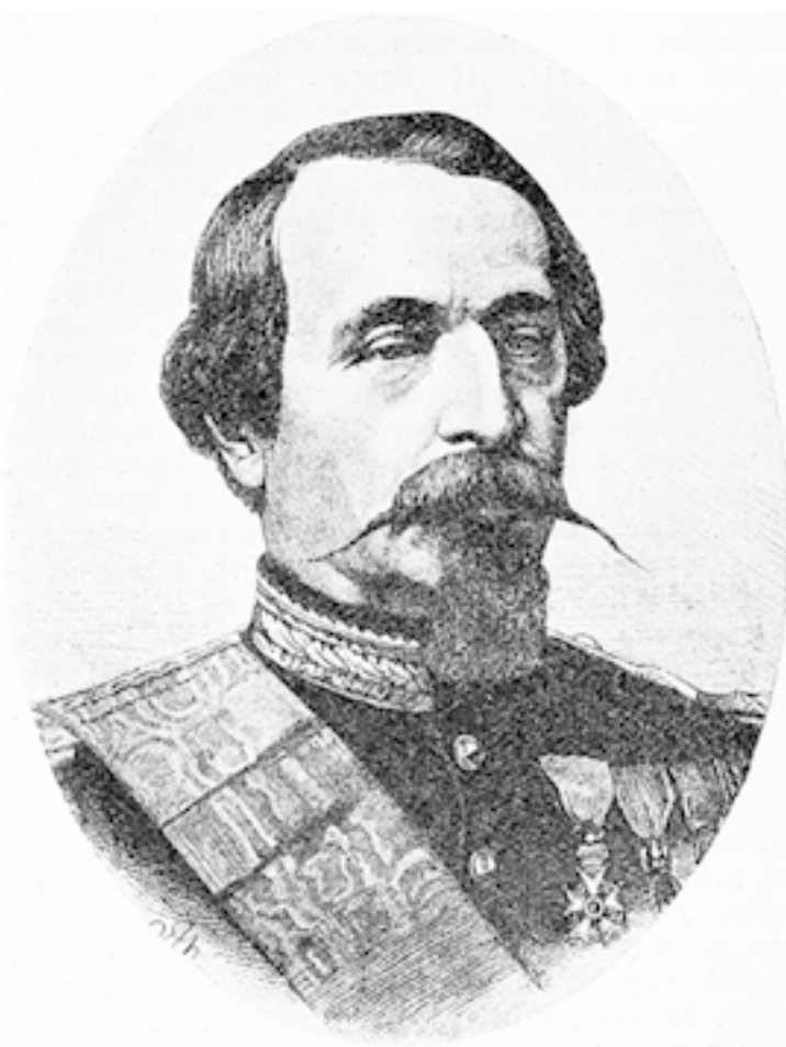
Луи-Наполеон Бонапарт (Наполеон III).

К восьми часам вечера, исполненный чувства глубочайшего удовлетворения от первого дня на борту, он замечает на горизонте свет далекого маяка. Последний знак, посылаемый землею Франции.