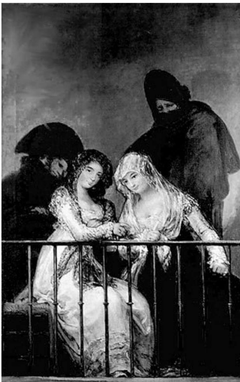
Франсиско Гойя. Махи на балконе.

Дальше – больше. Занятия в коллеже Роллен возобновились. Смысла от того, что Эдуар остался в пятом классе на второй год, никакого: по сравнению с прошлым годом он так и не достиг лучших результатов, кроме разве истории, где один-единственный раз, в мае, был удостоен второго места. «Этот ребенок мог бы успевать куда лучше; правда, намерения у него хорошие, но он несколько легкомыслен и не так прилежен в выполнении школьных заданий, как хотелось бы». Но дядюшку Фурнье это ничуть не интересует – он одно вбил себе в голову и как-то за воскресным обедом настоятельно советует г-ну Мане записать Эдуара на дополнительные уроки рисунка, которые проводятся в коллеже Роллен.