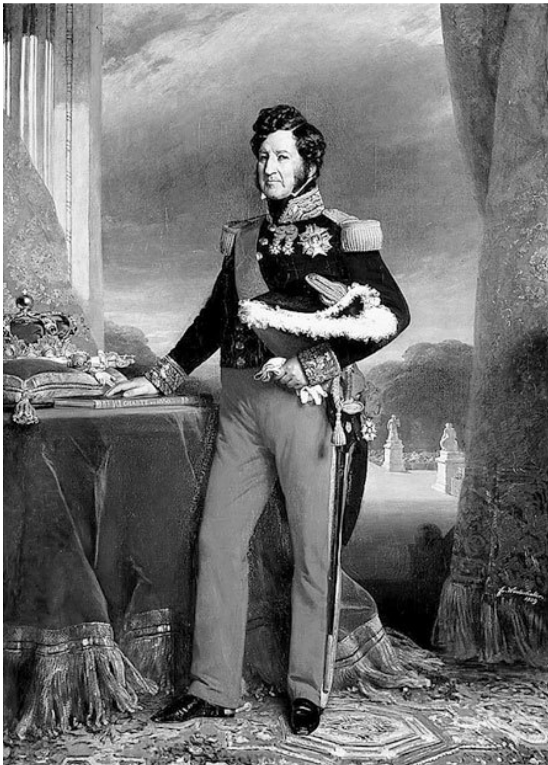
Франц Ксавье Винтерхальтер. Портрет Луи-Филиппа.

Отметки подростка вряд ли могли смягчить отношение г-на Мане к офицеру, возмнившему себя рисовальщиком. Риторика – «посредственно»; математика – «удовлетворительно»; история – «весьма поверхностно»... Что касается оценки «очень хорошо», полученной за рисунки, то для отца это хуже всякого порицания. Ученик Мане упорствует в своих так хорошо известных ошибках. «Прилежание и поведение: нам не удалось констатировать здесь никаких сдвигов». Имеет ли смысл при таком положении подавать на конкурс в Мореходную школу? В