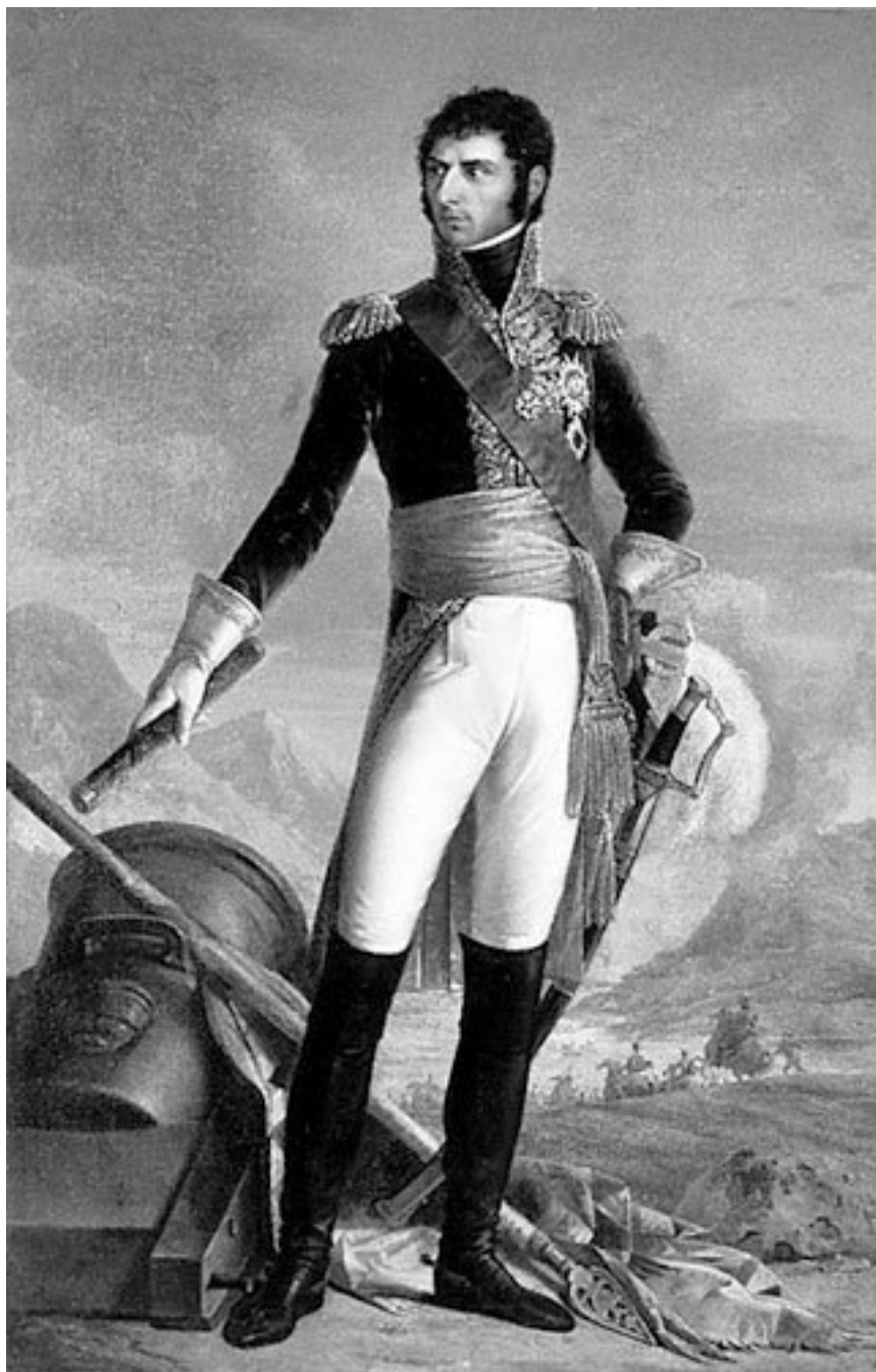
Жозеф-Николя Жуи. Копия с оригинала Франсуа-Жозефа Кинсона. Карл XIV Юхан (Жан-Батист-Жюль Бернадот).

В 1810 году, когда разворачивались события в Швеции, Жозеф-Антуан-Эннемонд Фурнье 13 , прежде занимавшийся коммерцией в Ганновере, а затем в Гётеборге, обанкротился. Он вернулся во Францию.