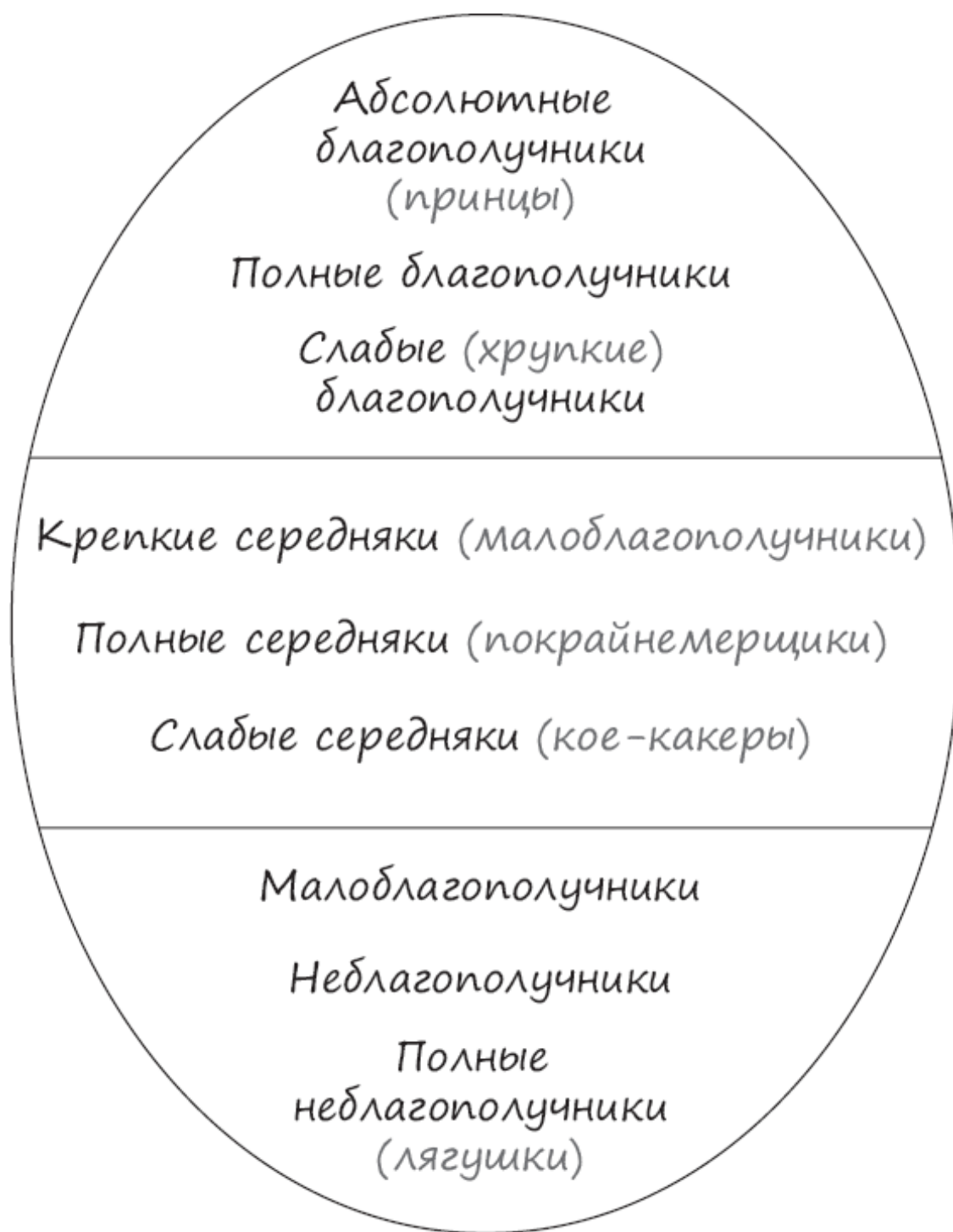
Рис. 2. Уровни благополучия с подуровнями

При этом обнаружилось, что благополучие и его уровни можно (и нужно) рассматривать не только, так сказать, в целом, но и по отдельным его (благополучия) аспектам – здоровью, взаимоотношениям, любви/сексу, работе и материальному благосостоянию. Всему тому, что я – еще во времена оные – представил в виде так называемой рабочей модели «Звезда благополучия – СК (Сергей Ковалев)» (рис. 3).