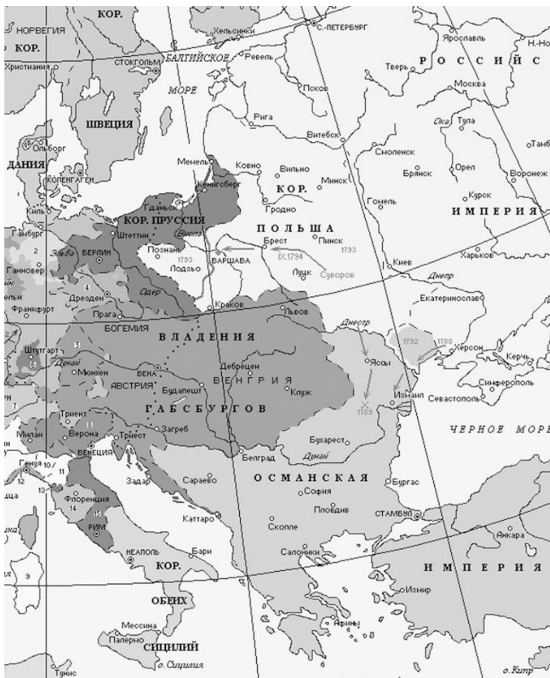
Рис. 3. Карта Европы. 1794 г.

под рисунком: Проспект Непской перспективной дороги от Адмиралтейских триумфальных ворот к востоку); б) гравюра Бенуа. Строганов дворец в нач. XIX в.