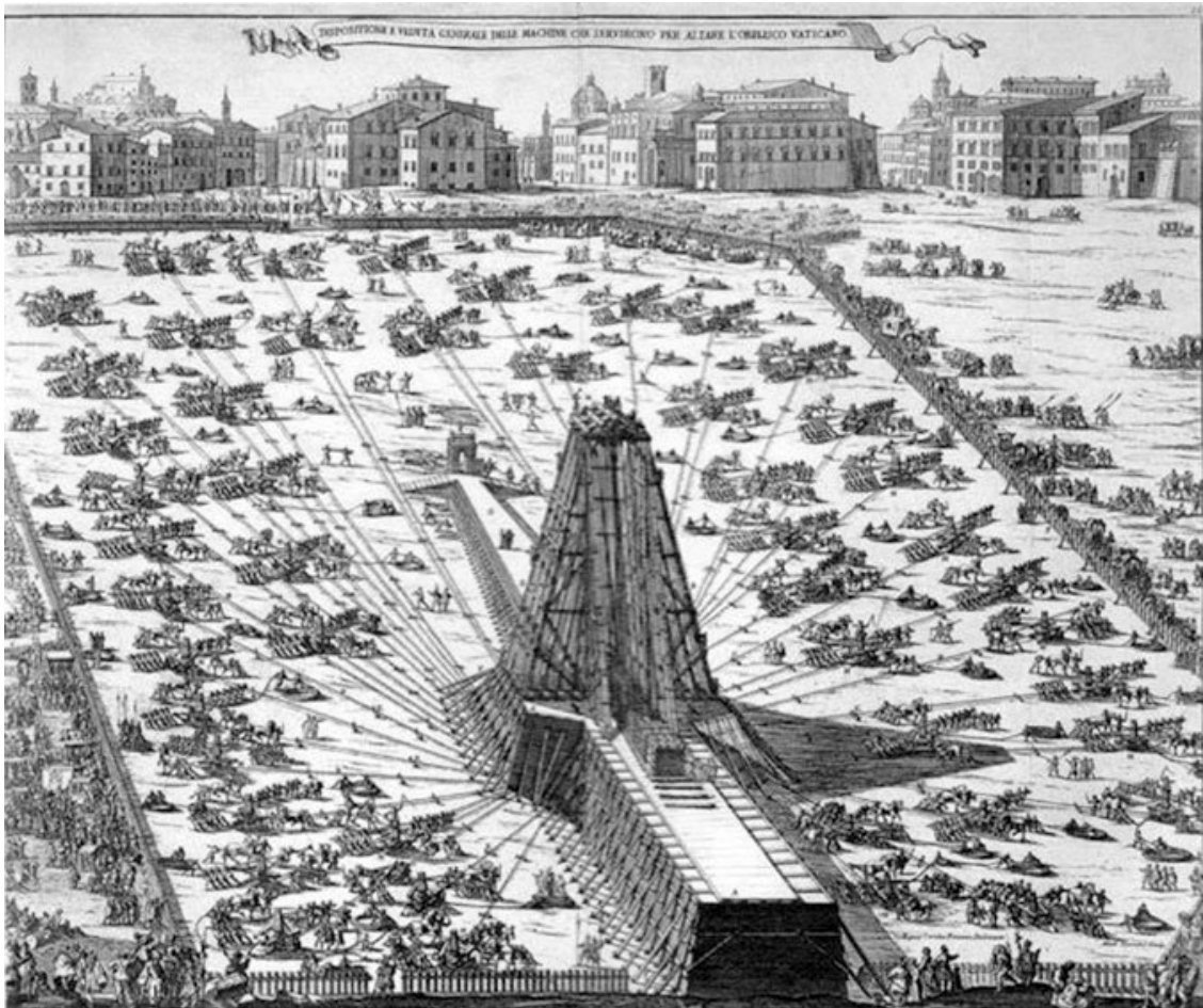
Рис. 5. Установка обелиска Нерона перед собором Св. Петра. По рисунку Доменико Фонтана. XVI в.

Император Нерон в своих гонениях на христиан и в досаде на апостола Петра за обращение в христианство двух любимых жён, приказал заключить его в темницу и потом казнить. Незадолго до этого по просьбе верующих Пётр пошёл было ночью вон из Рима, чтобы спастись; но в то время, как он выходил из города, ему в видении явился Господь, входящий в Рим. «Господи, куда Ты идёшь?» – спросил Его апостол. «Иду в Рим, чтобы опять быть распятым», – отвечал ему Господь. Пётр понял, что удаление его не угодно Господу, и возвратился в город. Здесь он был схвачен воинами, заключён в темницу и через несколько дней предан казни.