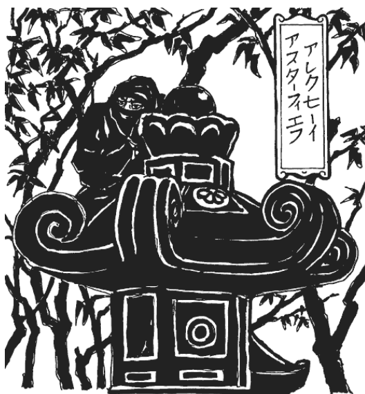
Ниндзя маскируется под каменный фонарь. Рисунок по мотивам японских гравюр

Фудзибаяси Ясутакэ, автор этой книги и предположительно глава организации ниндзя ( дзёнин ) из Ига, разделяет шпионское искусство на два основных раздела: Ёнин («Светлое ниндзюцу », или «искусство невидимости на свету») и Иннин («Темное ниндзюцу », или «искусство невидимости в темноте»).