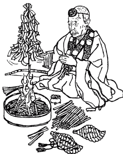
Ямабуси Симода Мохэй, патриарх школы будзюцу Кираку-рю. Со старинной гравюры

Последователей Эн-но Гёдзя, удалявшихся в горы для аскетической практики, называли ямабуси – «спящие в горах» (другие названия: яма-но хидзири – «горные мудрецы»; сюэн-дзя – «занимающиеся практикой для обретения чудотворных сил», сюгёся – «занимающиеся аскезой»; «гёдзя» – «аскеты»). Далеко не все из них оставались в горах постоянно, ведя жизнь отшельников в полном смысле слова. Подавляющее большинство совершало восхождения в горы лишь эпизодически. В остальное время они либо находились в храмах, связанных с сюэндо , либо странствовали, забредая подчас в самые отдаленные уголки Японии. Постепенно они обрастали приверженцами из числа мирян. Когда наступало время восхождения на святые горы, ямабуси становились для мирян проводниками в святые горы и наставниками в постижении таинств горного отшельничества. Таких ямабуси стали называть сэндацу .