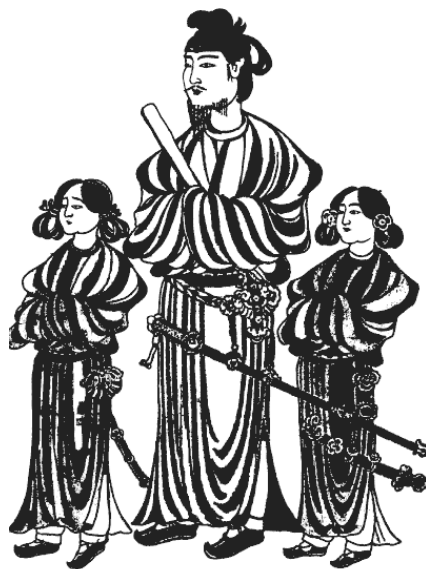
Сётоку Тайси. Со старинной гравюры

Чем же конкретно занимался Отомо-но Сайдзин? В популярных книгах по истории ниндзюцу говорится, что в 587 г. он по приказу Сётоку-тайси проник в лагерь мятежника Мононобэ-но Мория и добыл важную информацию о составе вражеских войск, чем способствовал победе принца. Однако в источниках, повествующих о войне Сётоку-тайси против Мононобэ-но Мория, например в «Нихонги», об этом ничего не сообщается. Да и имени Отомо-но Сайдзин там не найти.