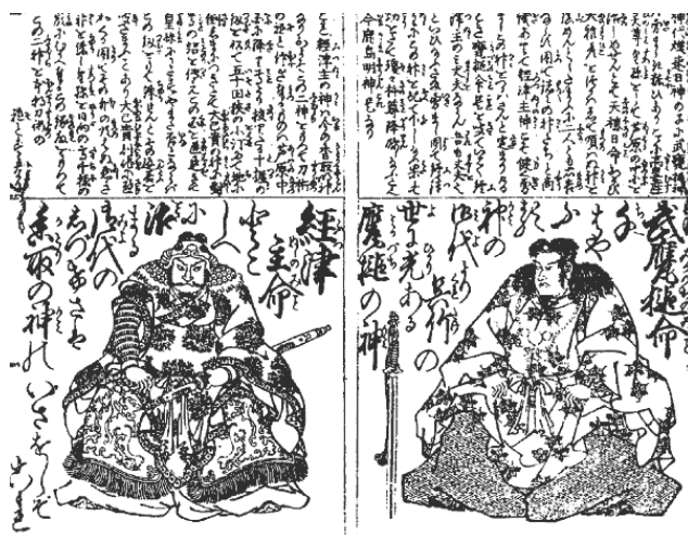
Воинские божества Фуцунуси-но микото (слева) и Такэмикадзутти-но микото (справа). Со старинной гравюры

В качестве таких «разведчиков» в «Кодзики» и «Нихонги» упомянуто несколько богов, в том числе и покровители воинов и воинских искусств Такэмикадзутти-но микото и Фуцунуси-но микото. Интересно, что с важнейшими центрами почитания этих богов, храмами Касима-дзингу и Катори-дзингу, связаны две крупнейшие школы японского боевого искусства: Касима синто-рю и Катори синто-рю, каждая из которых включает в свою программу свой вариант системы шпионажа и разведки – синоби-но дзюцу .