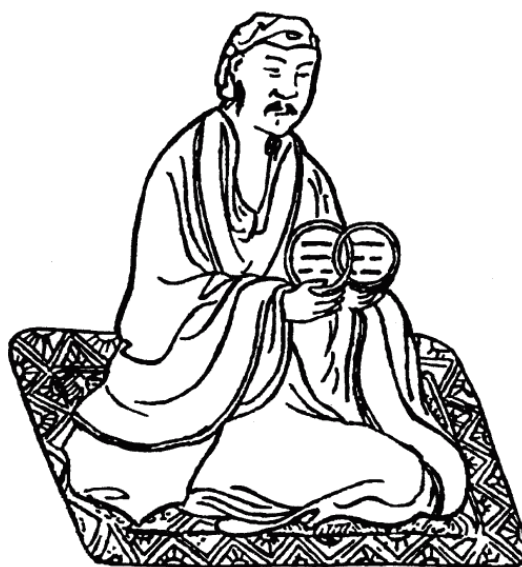
Даос. Со старинной гравюры

Точных сведений о Сюй Фу не сохранилось. Имя его известно лишь из легенд жителей Кии. Они утверждали, что Сюй Фу был выдающимся даосским мудрецом, магом и служил придворным лекарем китайского императора Цинь Шихуан-ди (246–210 гг. до н. э.). Цинь Шихуан славился половой распущенностью и неумеренностью. Он очень любил свою сладкую жизнь, страшно боялся смерти и потому приблизил к себе большую группу даосских мудрецов, активно искавших эликсир бессмертия. С их помощью Цинь Шихуан рассчитывал сохранить вечную молодость. Одним из этих мудрецов и был Сюй Фу.