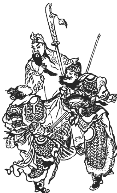
Китайские военачальники. Со старинной гравюры

К области военной подготовки Сунь У относит формирование армии, ее оснащение, хорошую организацию, надлежащим образом поставленное руководство и налаженное снабжение. Из всего этого складывается полнота боевой подготовки. Сунь У в весьма энергичных выражениях требует: «Правило ведения войны заключается в том, чтобы не полагаться на то, что противник не придет, а полагаться на то, с чем я могу его встретить; не полагаться на то, что он не нападет, а полагаться на то, что я сделаю его нападение на себя невозможным для него».