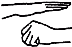
Мудра невидимости ( онгё-ин )

эзотерических учения: тонко и ходзюцу . Особая форма заклинания и волшебства ( ёдзюцу ), способная сделать тело воина невидимым для врага, называется тонко », — сообщает он.