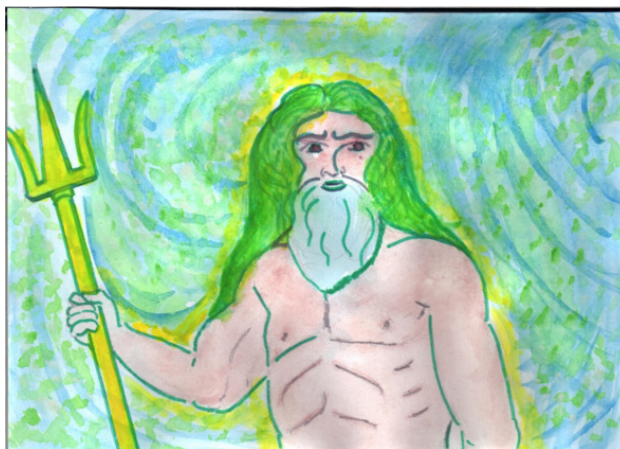
Рисунок Татьяны Абрамовой.

Белые кони с зелёною гривой... Как усмирить этих резвых коней? Быстрой волною, лёгкой, игривой, С ветром помчались они в табуне.