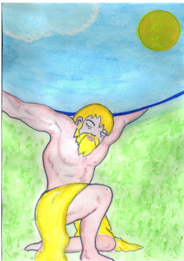
Рисунок Татьяны Абрамовой.

Атлант, держащий неба толщу, Громаду каменного свода,