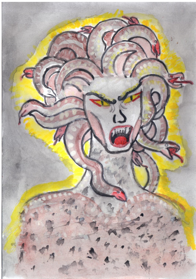
Рисунок Татьяны Абрамовой.