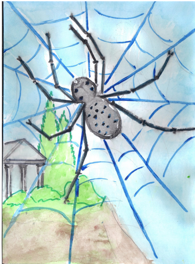
Рисунок Татьяны Абрамовой.

Ткала леса, моря и реки, И вышивала нежной гладью, Как пылью лёгкою на веки, На лица... В позолоте рамы,