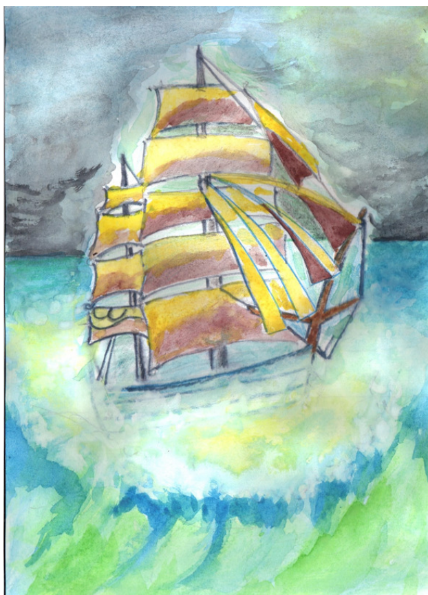
Рисунок Татьяны Абрамовой.