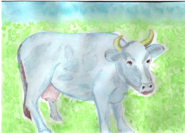
Рисунок Татьяны Абрамовой.

Помочь решил ей бог небес, Премудрый и великий Зевс, На пастбище слетал Гермес И усыпил он пастуха, Сто глаз закрылись на века.