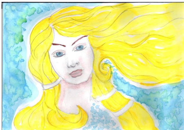
Рисунок Татьяны Абрамовой.

Манят нас склоны Геликона, И вдохновения бокалы Наполним влагой Гиппокрена, Даров божественных подарок.