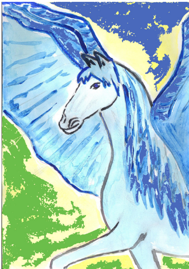
Рисунок Татьяны Абрамовой