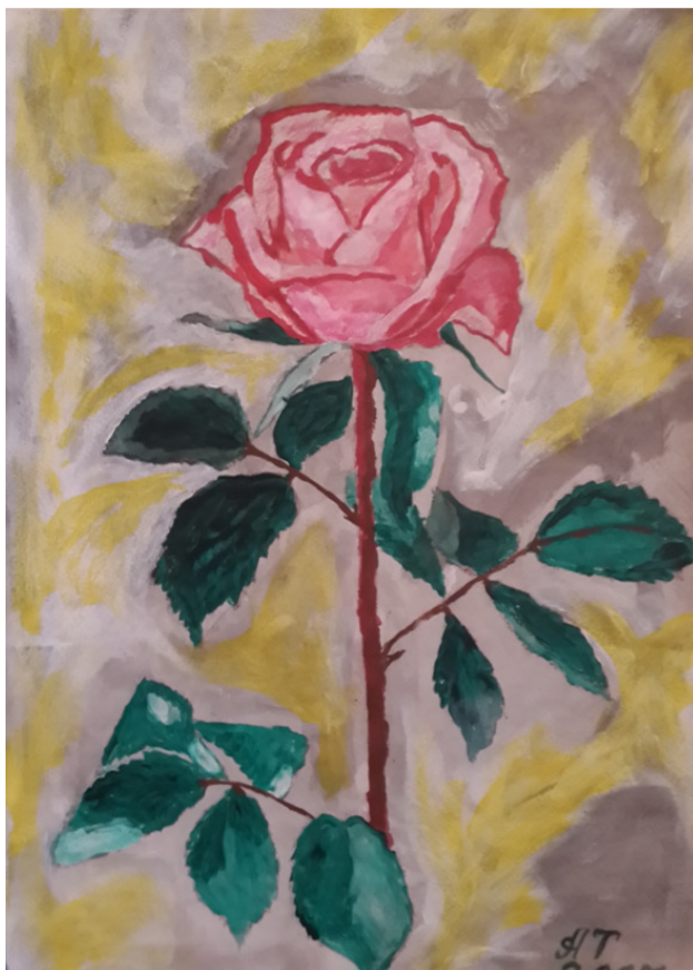
Рисунок Татьяны Абрамовой

Земля блистала белым телом, И ослеплённая комета Застыла в небе. Робкий Парис Олимп оставит без ответа? 2017.04.23