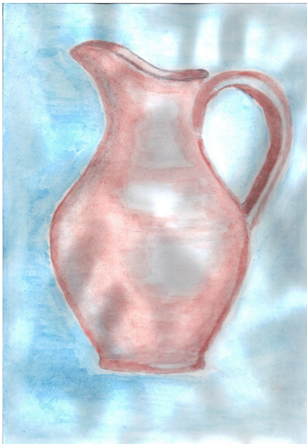
Рисунок Татьяны Абрамовой

– Худо-бедно, но мы живём, И гостям мы всегда ведь рады, Свой последний хлеб отдаём,, За ночлег не попросим злата.