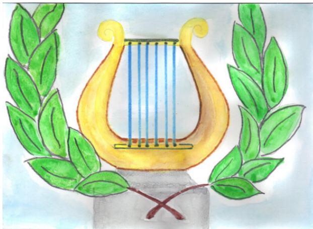
Рисунок Татьяны Абрамовой.

И лира – на небе, в ней музыка Грига, И Баха, Бетховена, песни поэтов, Мне лира напела историю эту. 2017.04.19.