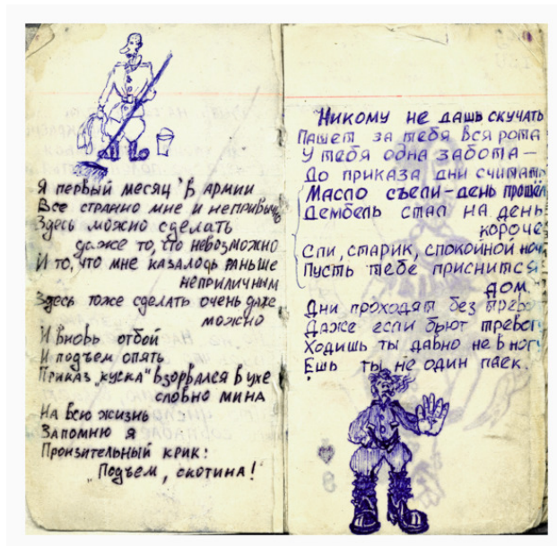
Из тетради по политзанятиям (1986—87)

Не тони в потоке забот, И хоть раз на себя оглянись. Жизнь давно уж куда-то идёт, А ты толком не понял жизнь. Что к чему? Для чего? Почему? Парадоксов бесчисленный рой. Или я для чего-то живу, Или жизнь лишь придумана мной. Память – словно зеркальная гладь, В ней лишь образы прожитых дней, И в них я отражаюсь опять... Иль они отразились во мне?..