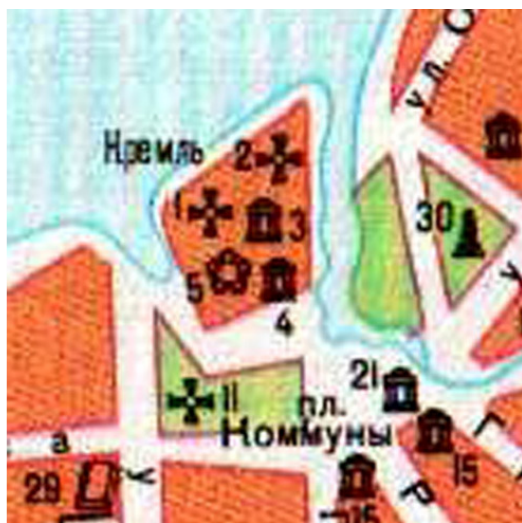
Угличский кремль на полуострове

– Как-как? – не поверив, я потянул к себе книгу.