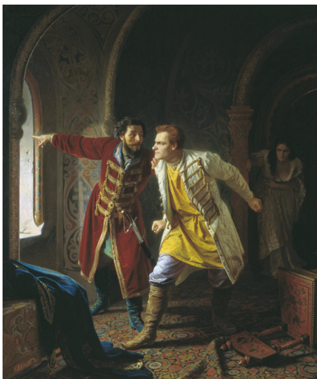
Карл Вениг. Последние минуты самозванца Дмитрия

Никакого бунта и мятежа народных масс в Угличе не было. Все беспорядки, описанные в следственных документах, происходили в Москве. Там действительно был бунт, народное возмущение, в результате которого Лжедмитрий I выбросился из окна.