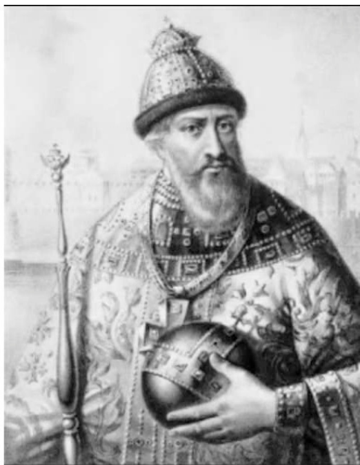
Царь Василий Шуйский

– Кто?.. Что?! Да вы с ума сошли! Да его там и близко не было! Он даже в Угличе-то появился только вместе со следственной комиссией. То есть по меньшей мере через несколько дней или даже недель после происшествия.