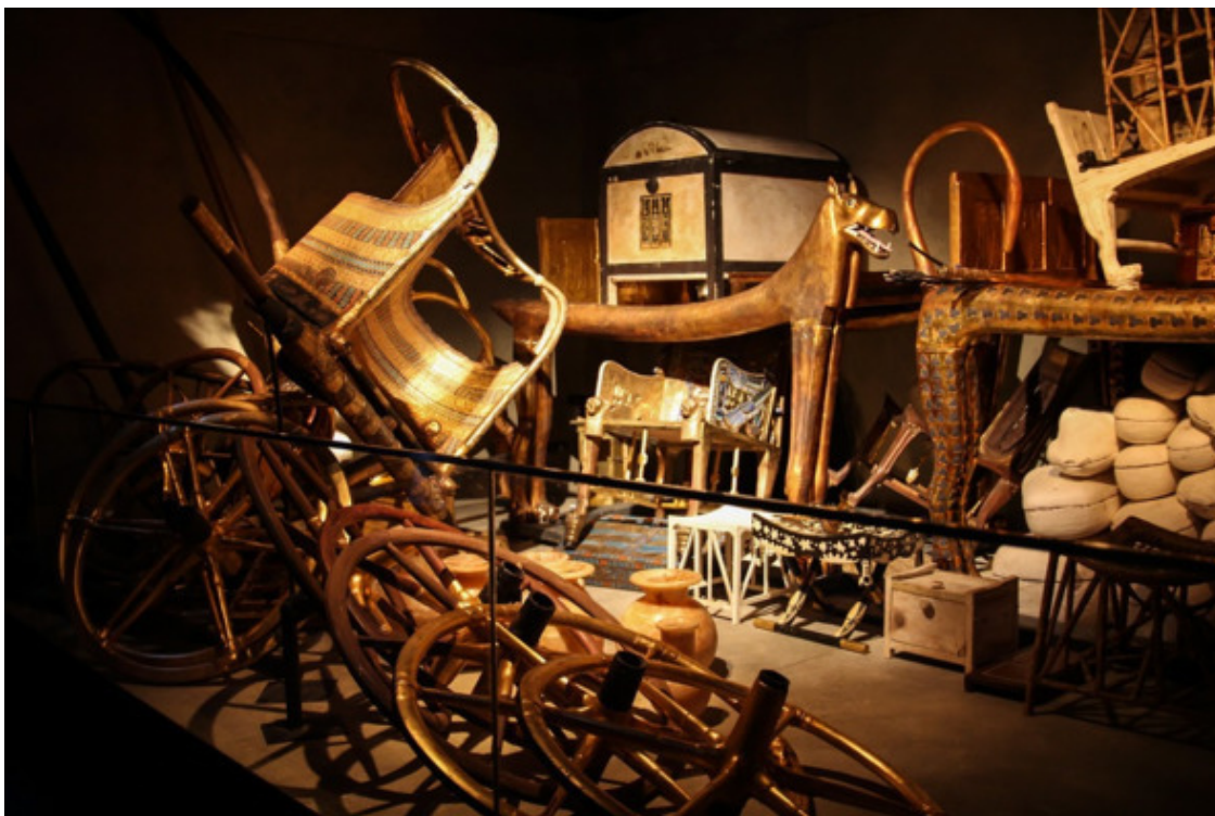
Сокровища в передней комнате

Сменялись эпохи, рождались и гибли империи... Половина истории человечества миновала! А эта гробница была замурована и хранила прикосновения людей, даже память о которых давно растворилась в бесконечной череде веков.