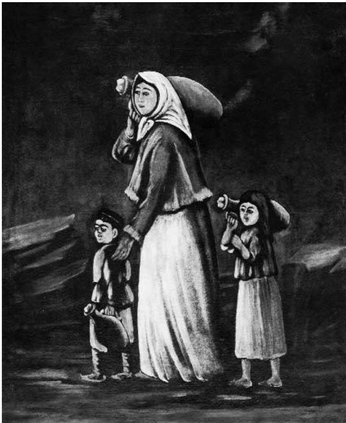
Нико Пиросмани. Крестьянка с детьми идет за водой

Государственный музей искусств Грузии, Тбилиси