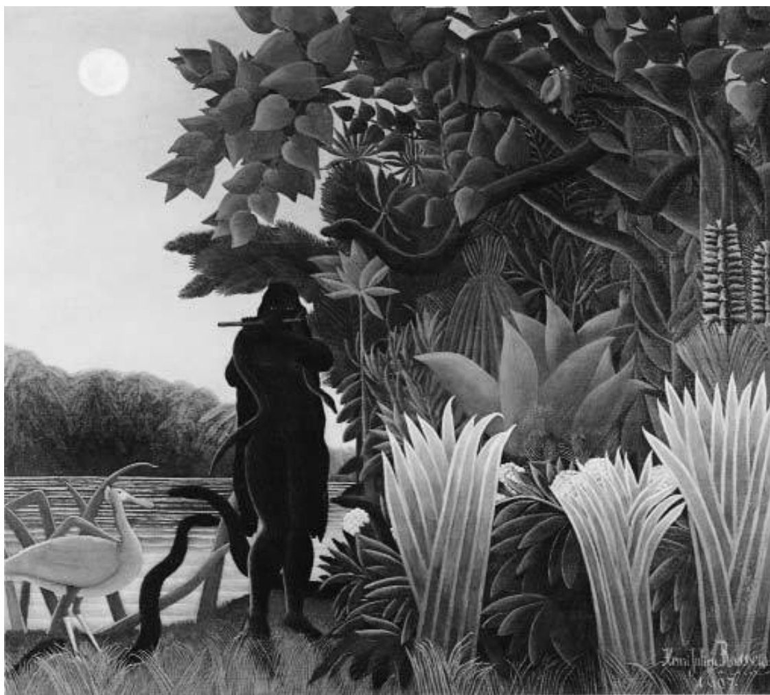
Анри Руссо. Заклинательница змей . 1907

и возвышенной духовности. (Таким же он предстает и на портрете Пикассо, исполненном в 1910 году в манере аналитического кубизма: на нем облик Уде отличается какой-то особой хрупкостью.)