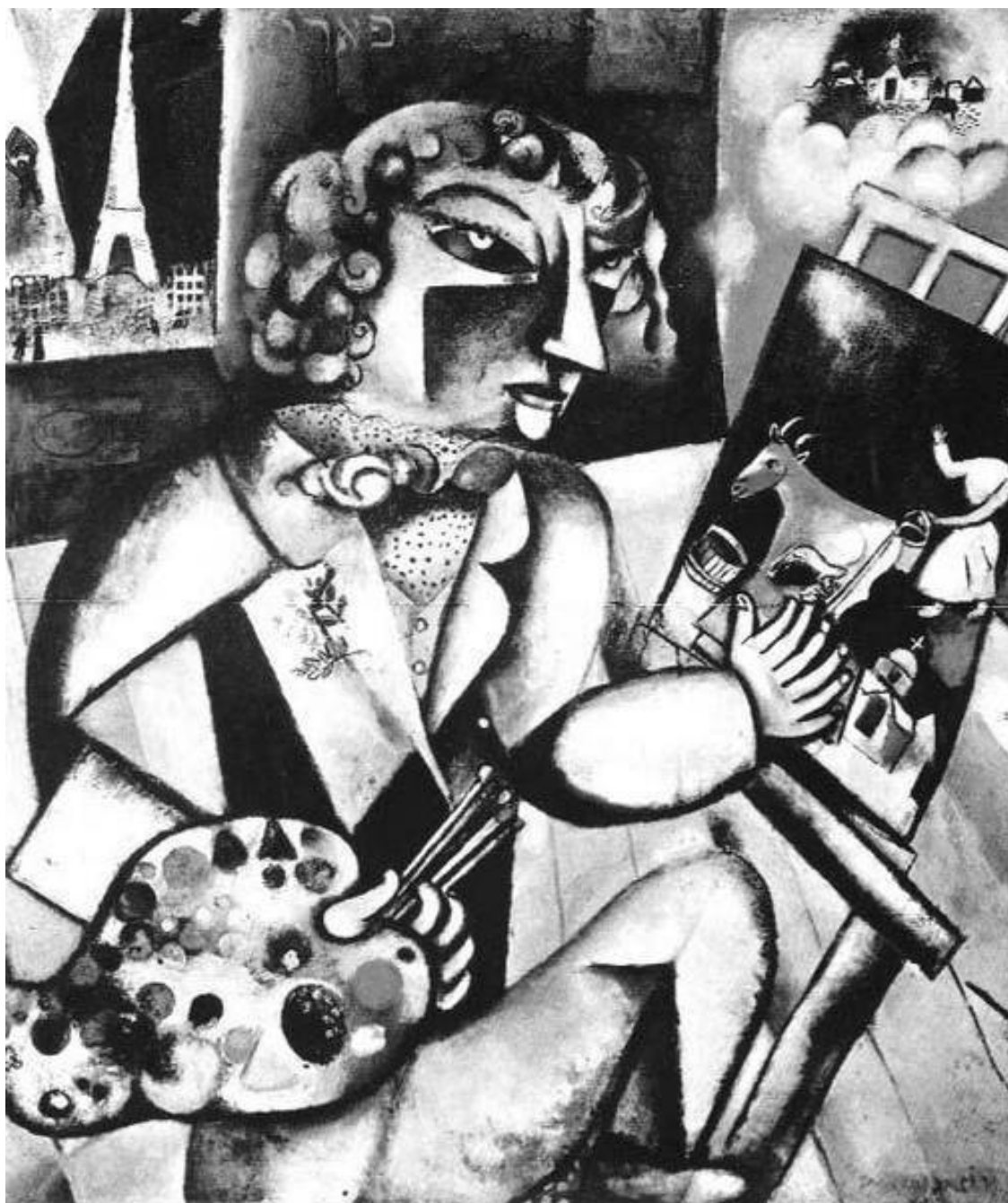
Марк Шагал. Автопортрет с семью пальцами. 1912.

обращение к символам Руссо мы встречаем и в работе Шагала Париж. Вид из окна , где он цитирует Эйфелеву башню и характерные парижские домики с дымоходами с картины Руссо. Наконец, Руссо является для Шагала как бы личным примером, частью его экзистенции: только что умерший нищий художник, никогда не выходивший за пределы собственного внутреннего мира и воплотивший в своих звериных циклах и магнетических портретах тайный, скрытый смысл земных образов, поддерживает Шагала в стремлении сделать свою скрытую жизнь, полную не меньших тайн, главной темой его живописи. И он находит в этом отклик у своих парижских друзей, лидеров кубизма, новых поэтов.