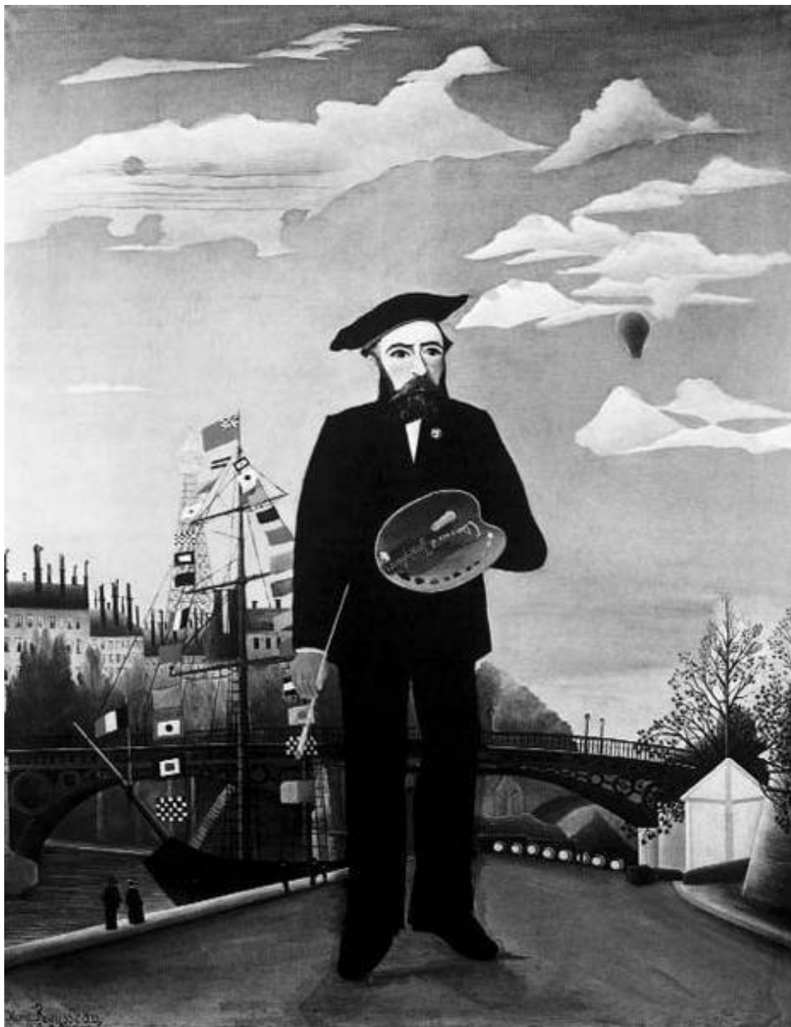
Анри Руссо. Автопортрет-пейзаж. 1890