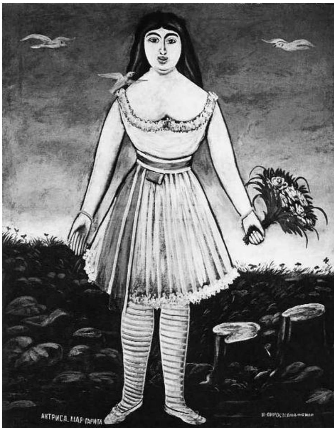
Нико Пиросмани. Актриса Маргарита

Государственный музей искусств Грузии, Тбилиси