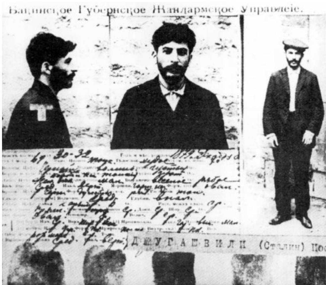
Фотодокумент, появившийся во время преследования царской жандармерией Джугашвили (Сталина) за революционную деятельность. На фото надпись: Бакинское Губернское жандармское управление.