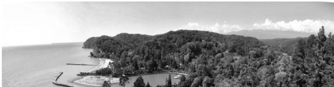
Панорама Черного моря и бухты в районе поселка Мюссера.

Заинтересовавшись вертикальными камнями и кругами, находящимися недалеко от моего дома, я настроился на один из таких вертикальных камней и со всё более возрастающим удивлением последовал за волнами энергии, которую он испускал. Становилось всё более и более очевидно, что это было тайной древних – они использовали эту естественную теллурическую энергию, концентрируя её в определённых местах для неких собственных целей».