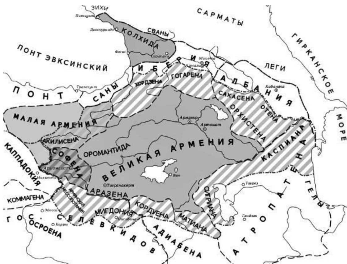
Закавказье в II–I вв. до н. э. (Карта из т. 2 «Всемирной истории». М., 1956 г.)

ников». И название Колхидская низменность появилась здесь не зря, – в древние времена эта земля принадлежала государству Колхида, по этим местам путешествовали аргонавты в поисках золотого руна.