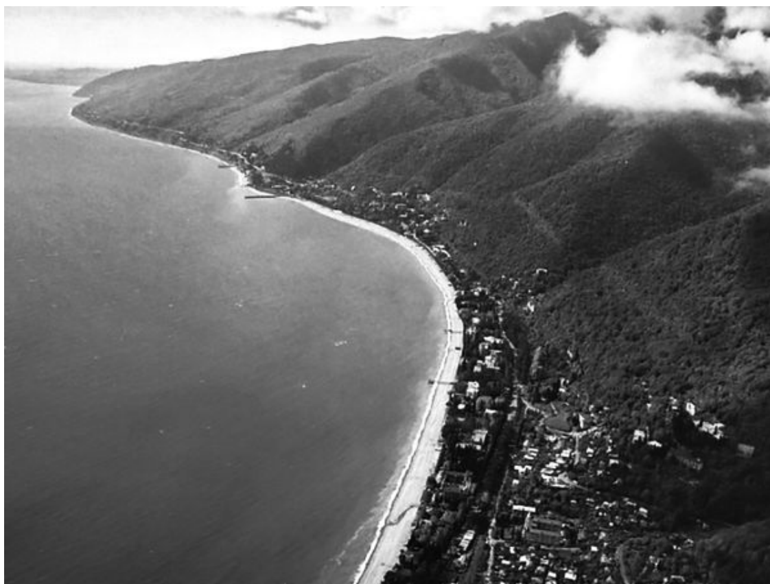
Поселок Мюссера в бухте на берегу Черного моря.

Не многие знают, что первая государственная дача на территории Абхазии была построена рядом с поселком Мюссера; старейшая государственная дача УД ЦК ВКП (б) получила аналогичное поселку название.