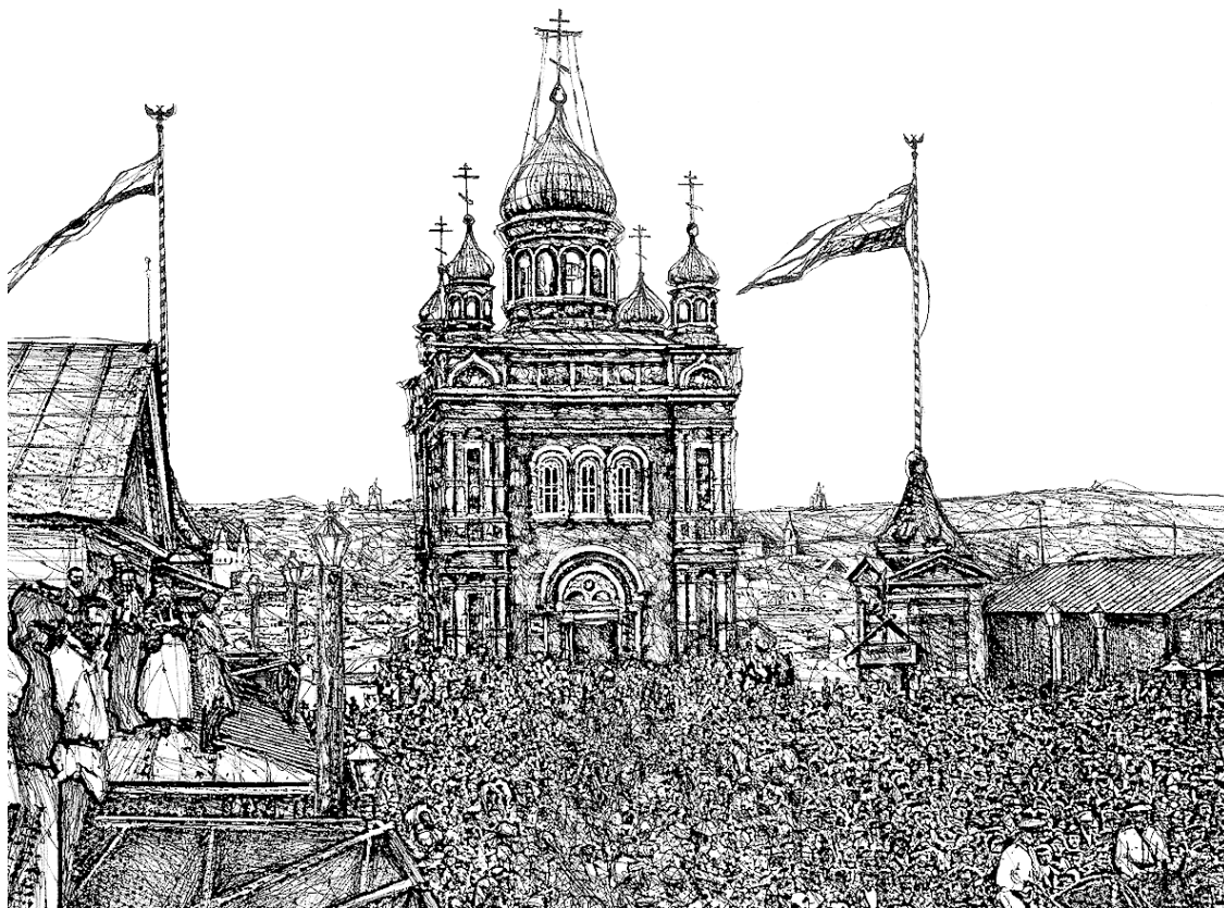
Открытие ярмарки. Макарьевская часовня и флачные башни.

Ярмарка открылась, как водится, с архиерейского служения в Спасо-Преображенском соборе. По окончании литургии крестный ход торжественно, через всю ярмарку, через Главный дом прошел к Макарьевской часовне, перед которой искони стояли флачные башни. После молебна в присутствии губернатора, предводителя дворянства, городского головы, председателя ярмарочного комитета и прочего начальства помельче, ярмарочные флаги окропили святою водою и подняли. Толпа в несколько тысяч человек заревела, множество глаз было устремлено на флаги: как развернутся, так и пойдет ярмарка, в чью сторону потянутся полотнища, тем купцам будет хороший торг. Примета это старинная и верная: в 72-м году флаги дружно скосились на Пески, и точно, выгорела вся Сибирская пристань с миллионными залежами товаров, стоящая в противоположной Пескам стороне.