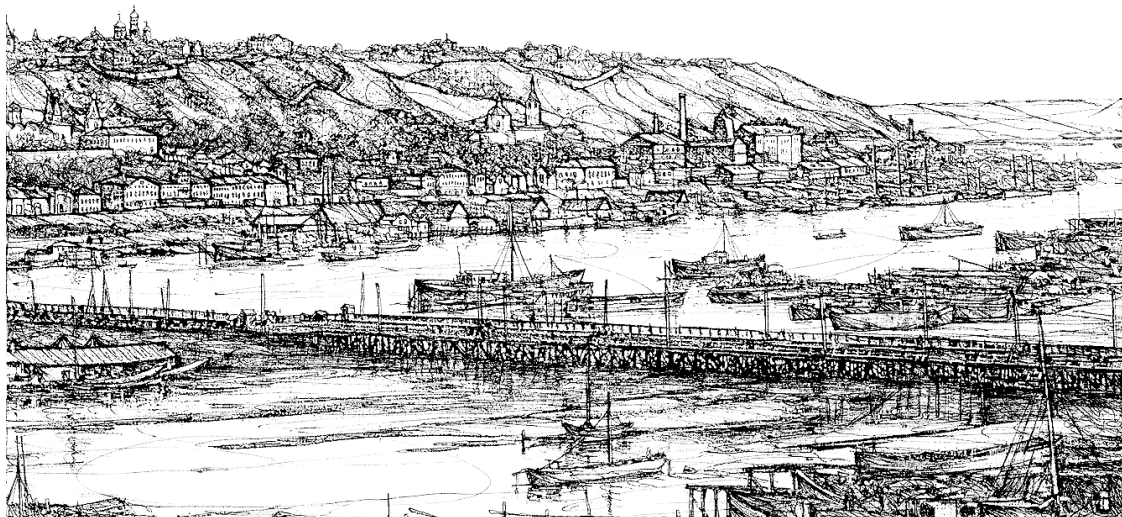
Вид на Нижний Новгород с ярмарочной стороны.