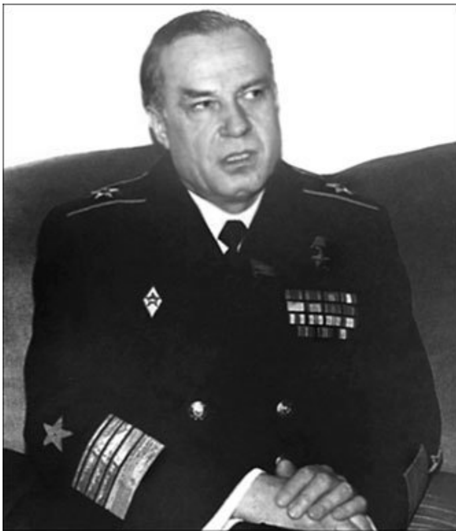
Адмирал флота В.Н. Чернавин, главком ВМФ СССР в 1985 – 1992 гг., – один из первых осознал необходимость изучения ДОП в интересах флота

Вскоре события принимают другой оборот. Над горами Скандинавии неожиданно появляются желтые и зеленые неопознанные летающие объекты, а над фиордами иногда видели вертолеты – черные и без опознавательных знаков. На высочайших скоростях они совершают немыслимые маневры. За всем этим с величайшим напряжением наблюдают не только военные, но и сотни местных жителей. Электронная техника на противолодочных кораблях выходит из строя. В результате неизвестные подводные объекты незамеченными выскальзывают из заливов. После этой бесславной затеи норвежские власти заявили, что это были, вероятно, не подводные лодки.