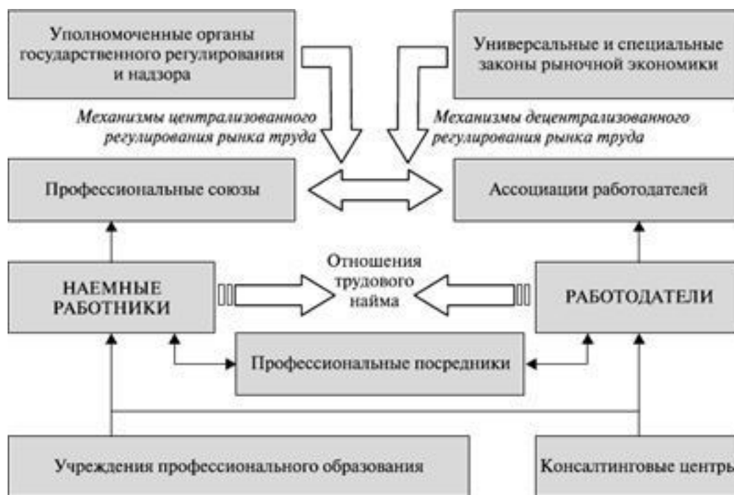
Рис. 2. Общая инфраструктура рынка труда

В графическом виде ее можно проиллюстрировать рис. 2.