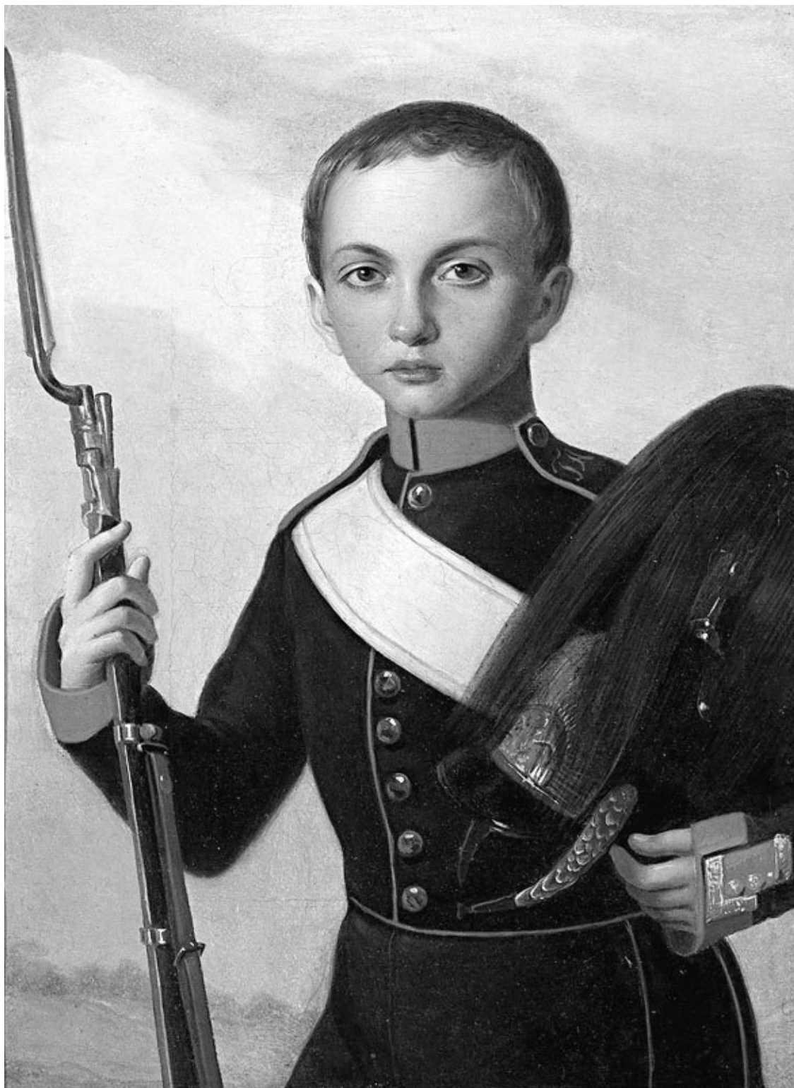
Кадет Новгородского графа Аракчеева кадетского корпуса. Вторая половина 1840-х гг. Неизвестный художник

Состоя на службе, бывшие ученики получали повышение по удостоению своего начальства и достигали офицерских чинов. Кроме того, в делах школ встречаются указания на то, что ученики их получали назначения и вне военного ведомства. Так, в 1784 году несколько инженерных учеников было отослано на Сибирские горные заводы в должность шихтмейсте-