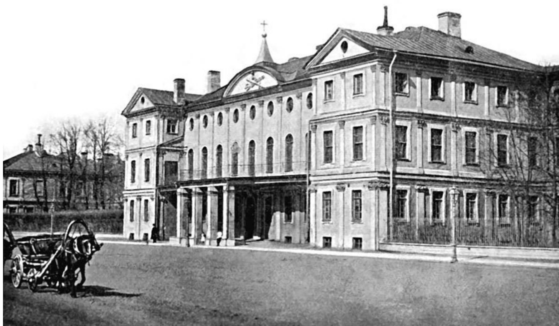
Здание Первого кадетского корпуса в Санкт-Петербурге. Меншиковский дворец на Васильевском острове