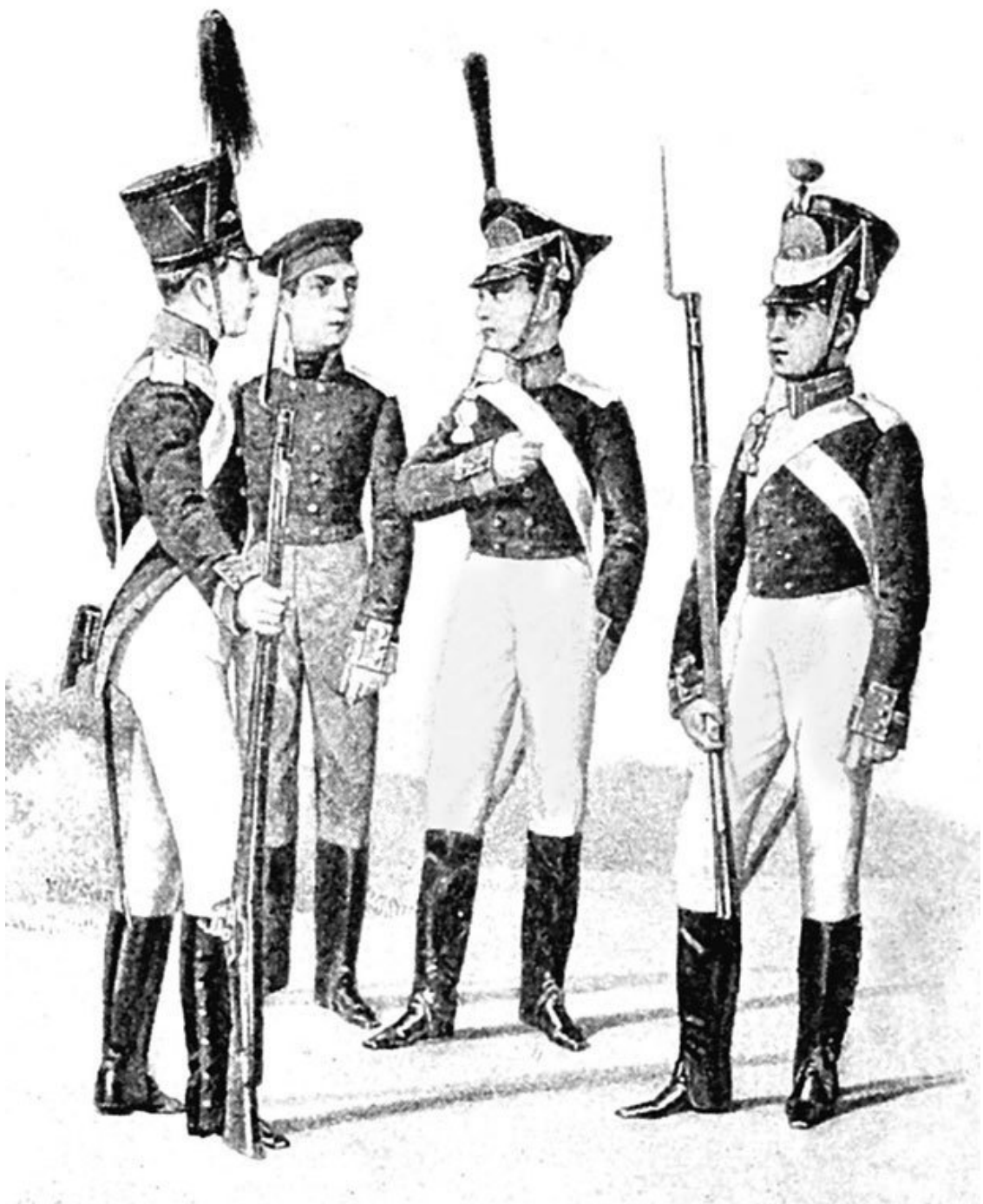
Форма кадетов XVIII века. Первый кадетский корпус. Рисунок

Пробыв шесть лет в малолетнем отделении, я был переведен в роты, в 1819 году в числе пяти кадет удостоился поступить в гренадерскую Его Высочества цесаревича роту 11 . В то время