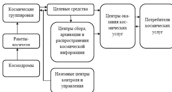
Рисунок 1.2.1 – Элементы инфраструктуры сферы космических услуг

Космические аппараты имеют чрезвычайно широкий спектр как по назначению и функциональным возможностям, так и по габаритно-массовым характеристикам. Среди космических аппаратов можно выделить: наноскопические аппараты (масса до 1 кг); малые (масса до 500 кг); средние (масса 1–2 т); тяжелые (масса 3–6 т и более). Отдельно стоит вопрос о космических аппаратах, направляемых к Луне или к другим небесным телам в научных целях. Вес их может достигать десятков и даже сотен тонн в зависимости от назначения.