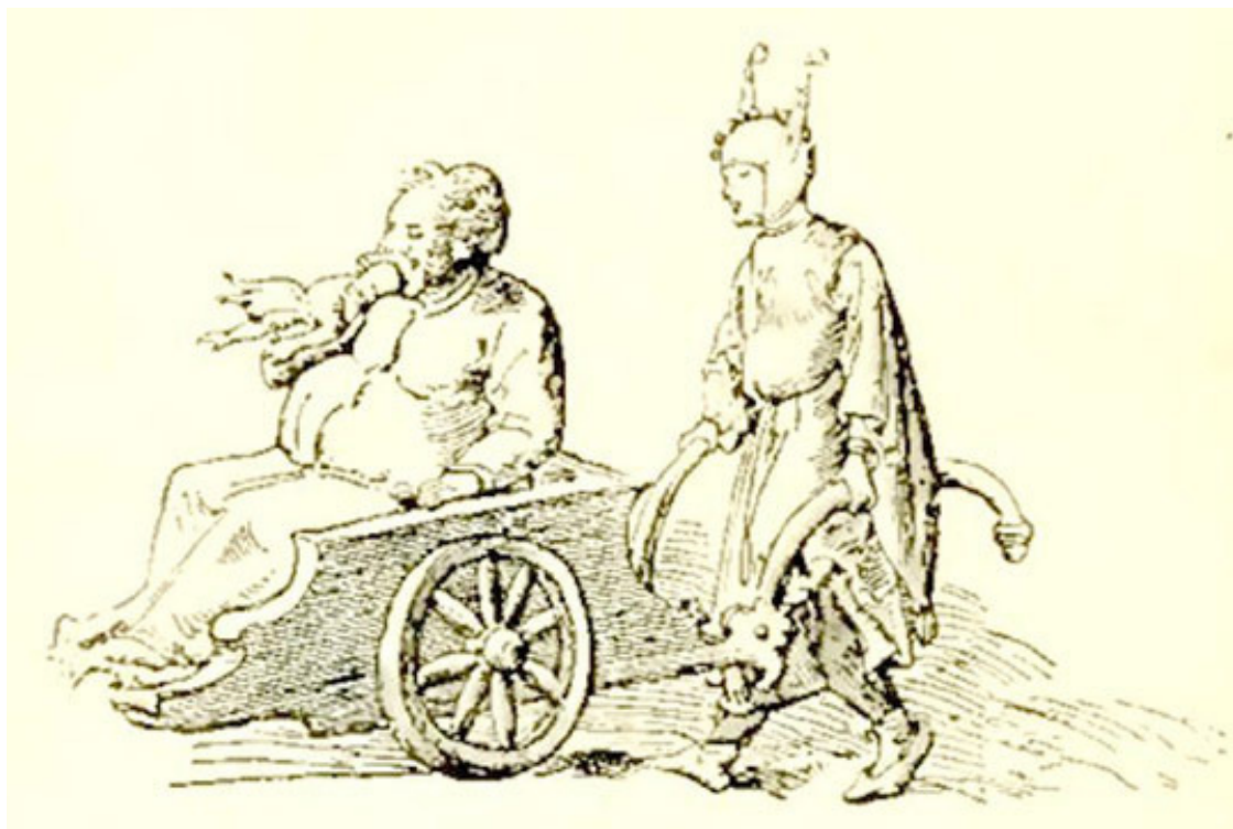
Рис. 14. Шут, везущий Силена. (Из коллекции Эстергизи в Пемсте. набросок Альберта Дюрера)

«Начальствующий в Кассиие сказал, что получил приказание от герцога надеть на вас то платье, которое он нам показал и которое состояло из саржевых полос наполовину желтого и зеленого цветов; зеленые полосы были обшиты желтыми позументами, а желтые полосы – зелеными. Между полосами была вшита желтая и зеленая тафта, как и между позументами. Один чулок был из зеленой саржи, а другой из желтой; затем колпак был также наполовину желтого и наполовину зеленого цвета и с длинными ушами...»