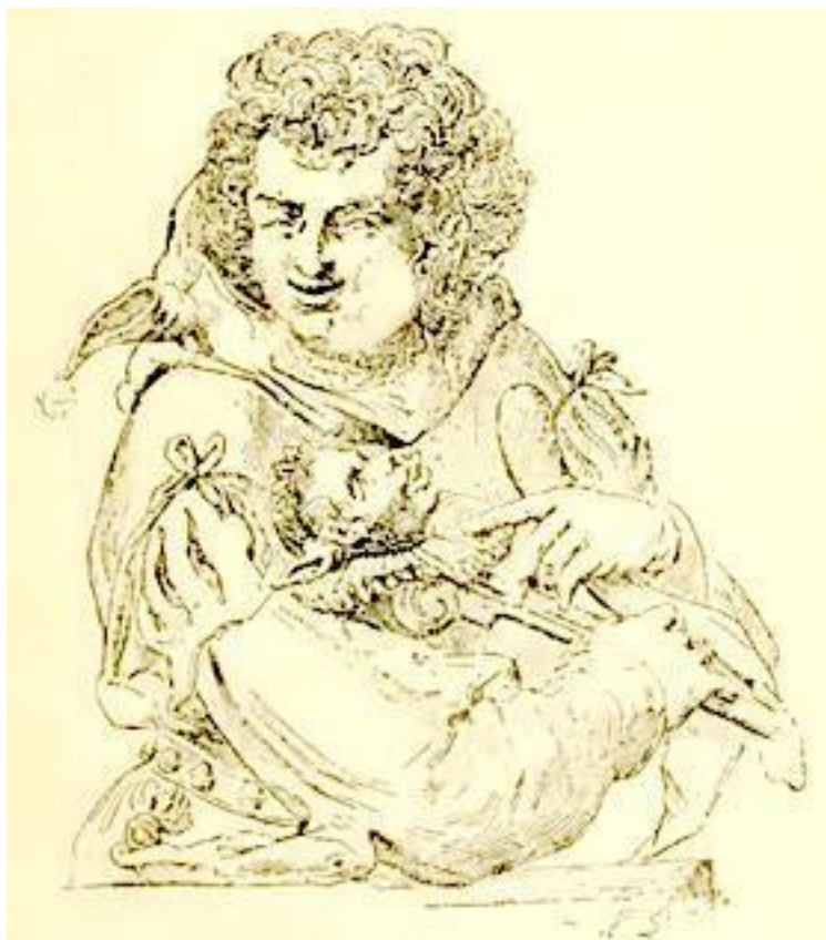
Рис. 2. Шут (по рисунку Гольцуса)

Большей частью, такой шут походил на Эзопа, как им его изобразил Плануд. Чем более он был безобразен и уродлив, тем большим успехом он пользовался; и чем более хозяева замка ласкали и баловали такого шута, тем более его ненавидели паж и прислуга; но за то и шуты хорошо умели мстить за себя, выбирая и пажей и прислугу мишенью для своих шуток и острот. Если какой-нибудь шут недостаточно хорошо знал свое ремесло, то ему давали учителя, который обязан был его усовершенствовать в этом искусстве. «Шут, живущий в знатном доме, — говорит Жакоб в своем «Рассуждении о шутах французских королей», воспитывался с таким же старанием, с таким же трудом и такими же издержками, как и ученый осел... К нему приставлялся наставник... Он должен был заучивать прыжки, поговорки, прибаутки, песенки. Часто случалось, что если он дурно приготавливал свой урок, то его стегали ремнем и затем отправляли обедать на кухню, вместе с поварятами.