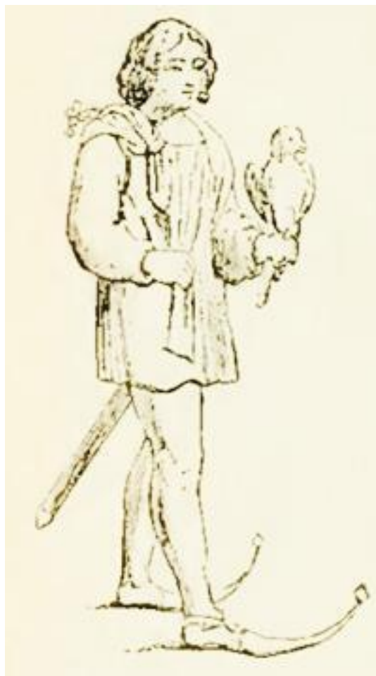
Рис. 11. Одежда шута. Башмаки с бубенчиками

На одной из старинных гравюр, взятой из одного немецкого сочинения, под заглавием “Schelmenzunft” (сонмище шутов), изданной в 1572 году, изображен шут в колпаке, остроконечности которого загнуты одна на правый бок а, другая на левый; на шее у этого шута привешено нечто в роде салфетки, из которой он вынимает маленьких шутов; у этих последних или только одна голова или один бюст; большой шут сеет их по деревне; такие зародыши шутов должны вырасти и потом узнают друг друга, как и самого сеятеля, по знаменитому колпаку, с тою только разницею, что у маленьких – остроконечности стоят прямо наподобие ослиных ушей.