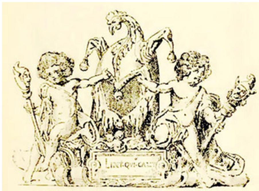
Рис. 10. Шутовской герб (по рис. Генриха Гюдиуса)

словаре биографии и истории упоминает о некоторых из этих бродячих шутов, которые часто давали представления в присутствии коронованных лиц, как например, Карла VI и королевы Анны Бретанской.