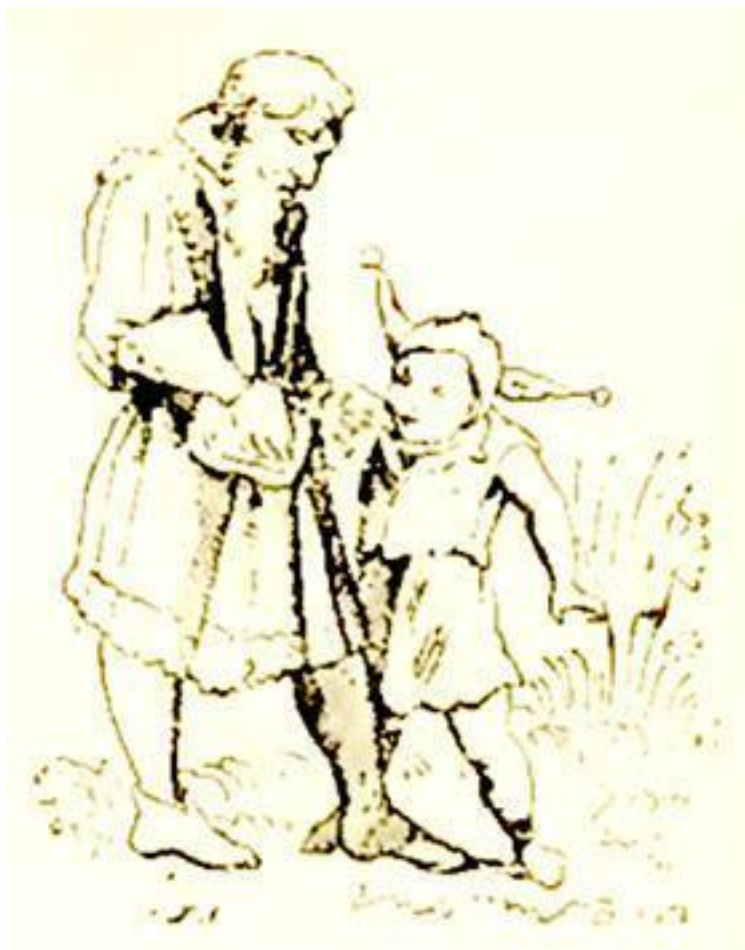
Рис. 3. «Похвала Глупости», из книги Эразма Роттердамского (Рис. Гольбейна).

Некоторые из этих шутов были, однако, люди с сердцем. Под их плащом шута билось действительно прекрасное сердце; это же сердце точно так же, как и сердце их повелителей, разрывалось на части от страданий. Трибулэ, которого изобразил Виктор Гюго в своей пьесе «Король забавляется», вовсе не похож на настоящего Трибулэ, как это мы докажем в следующей главе; но он может сойти за бессмертный тип тех шутов, которых, вероятно, было достаточно и которые, под тяготением всеобщего презрения или терзаемые какою либо печалью, должны смеяться по обязанности в то время, как их глаза, готовы были наполниться слезами, или когда их душа была исполнена негодования и отвращения!