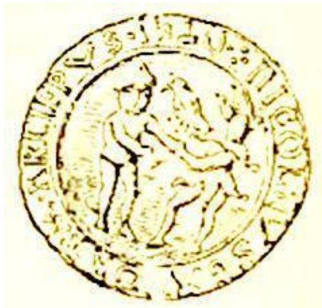
Рис. 5. Свинцовый жетон Патриарха невинных

словом, эти люди вели себя, как помешанные: они играли в кости, в карты, гоняли по всей церкви чад от кадилъниц, в которые вместо ладана были положены обрезки старых подошв.