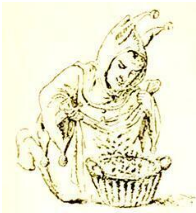
Рис. 4. «Шут», из коллекции Геннена.

Доказательством этому может служить «Празднество Глупцов», которое продолжалось до XVI столетия. Ученый дю-Тильо в одном из своих сочинений, изданном в Лозанне, в 1741 году и озаглавленном «Мемуары, которые могут служить для истории «Празднеств Глупцов» которые справлялись при многих Церквах» и, дает интересные подробности относительно этого странного обычая.