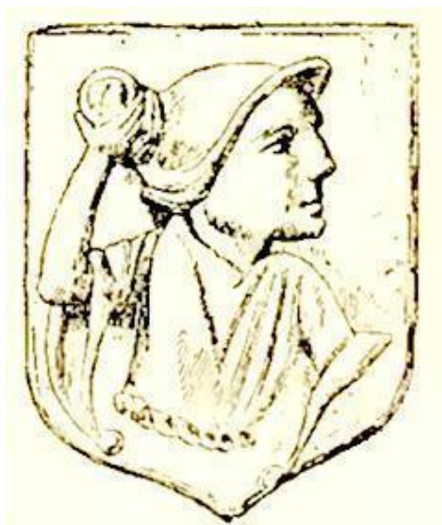
Рис. 8. Лепное изображение в церкви св. Маллона в Корнваллисе

Мишель Мено, делая в своей проповеди выговор женщинам, что их сборы в церковь бывают уже слишком продолжительны, между прочим говорил: «Скорее можно очистить от навоза конюшню, в которой стояло сорок четыре лошади, чем женщина окончит свой туалет.»