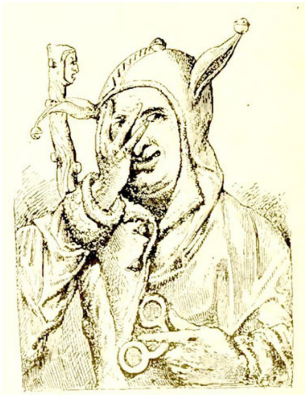
Рис. 13. Шут в парадном дурацком костюме

Панург с любопытством посматривал на него и сказал: «Мне еще никогда не доводилось видеть шута и вряд ли удастся видеть такого, который не пил бы вина большими глотками и с особыми удовольствиями. Следовательно, употребление вина также составляло необходимую принадлежность шутов.