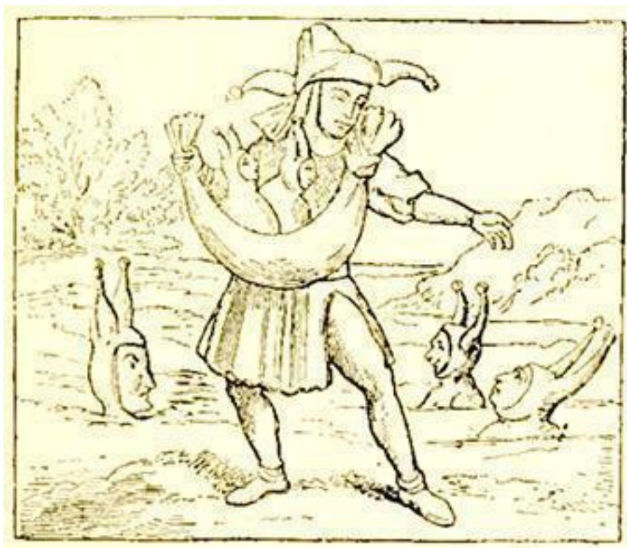
Рис. 12. Сеятель глупцов

Что же касается самого костюма шута, то он состоял из жакетки, вырезанной острыми углами; на эту жакетку надевалась деревянная золоченная шпага, а иногда и раздутый свиной пузырь, наполненный сушеным горохом; такой пузырь привязывался к небольшой палочке. Это именно и есть те подарки, которые Панург преподнес Трибулэ, как это рассказывается в III книге, гл. XLV «Пантагрюэля». Панург, по своем прибытии, дал ему свиной пузырь, который очень громко бренчал, потому что был наполнен сухим горохом, затем вызолоченный кусок дерева, потом черепаховый ягдташ и наконец бутылку хорошего бретонского вина в ивовой плетенке и четверик яблок. Трибулэ опоясался шпагою, надел ягдташ, взял в руки пузырь, съел часть яблок и выпил всё вино.