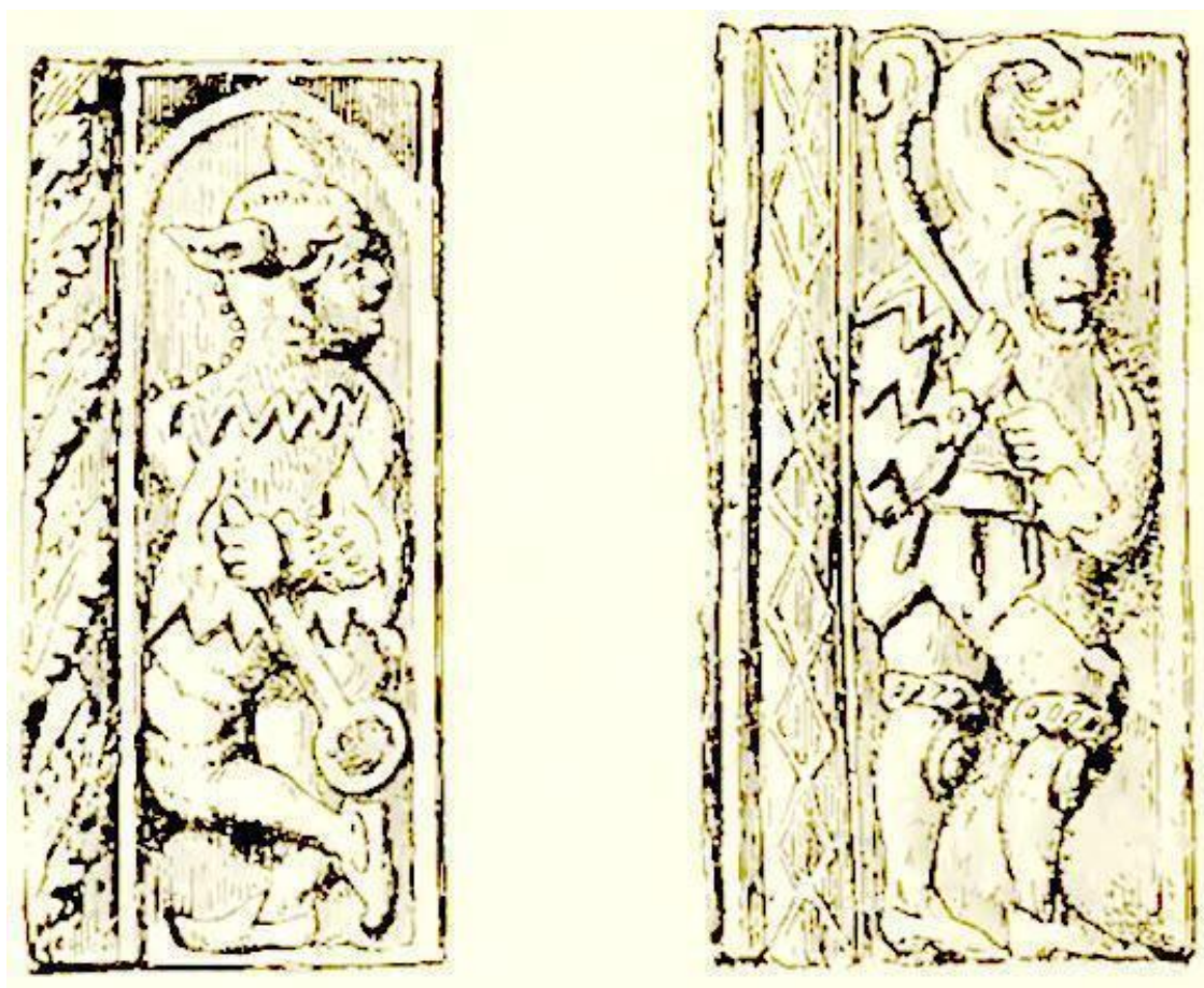
Рис. 9. Придворные шуты (Резное изображение на дереве в церкви св. Левана в Корнваллесе)

Здесь кстати упомянем еще о том, что многочисленные изображения фигур глупцов встречаются как на наружных, так и на внутренних стенах многих соборов. Так в деревне Шампо, находящейся в двенадцати километрах к северо-востоку от Мелуна, в тамошней церкви находится множество изображений крайне странных и между прочим три головы шутов в остроконечных колпаках и с погремушками. Здание этой церкви относится к XII столетию. Точно также в одной из парижских церквей, построенной в XV веке, мы видим резные украшения, изображающие епископа с шутовским жезлом в руке и монаха в колпаке с ослиными ушами и также с шутовским жезлом в руке.