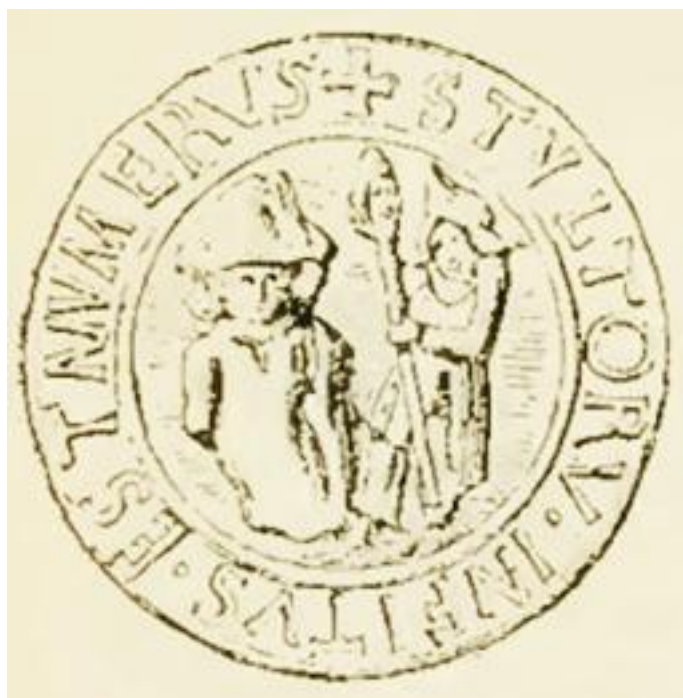
Рис. 6. Жетон «папы глупцов»

Дю-Тильо упоминает еще о мемуарах Антония Лансело, члена Академии надписей (1675–1740), относительно древнего празднества глупцов в Вивизерской епархии. Во время этого празднества происходить сначала выбор аббата духовенства, которого назначал низший клир (молодые каноники и клир). Затем служили молебен, после этого происходила процессия, которая повторялась в течение всех восьми дней празднества.