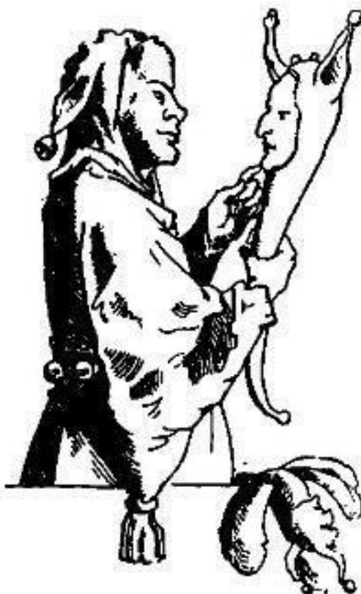
Рис. 1. Шут (рисунок Гольбейна) Из книги Эразма Роттердамского «Похвала глупости».

Эразм 6 в своей замечательной книге «Похвала Глупости» рассказывает нам, как боги Олимпа любили развлекаться, во время своих пиршеств, выходками шутками других богов.