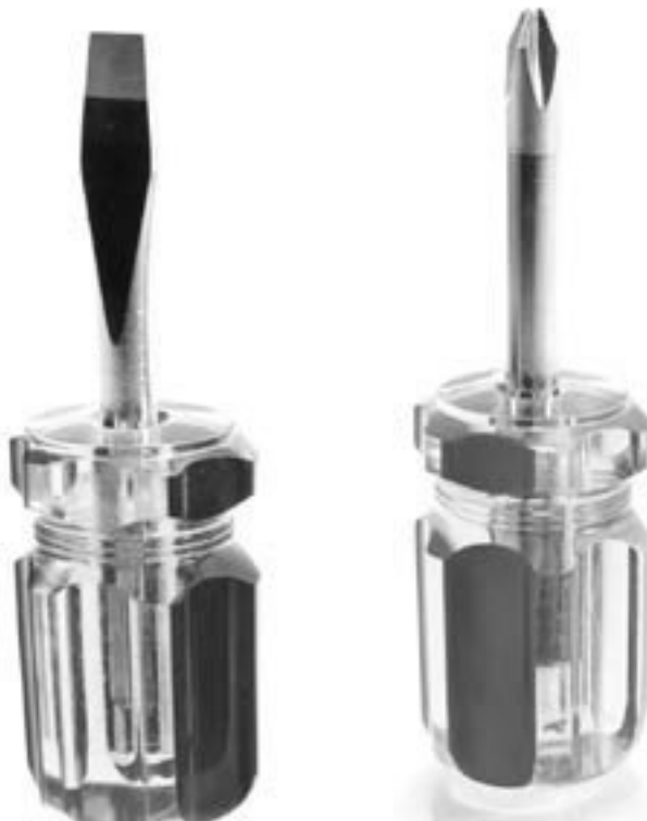
Плоская отвертка «Шлиц» и крестовая отвертка «Филипс»