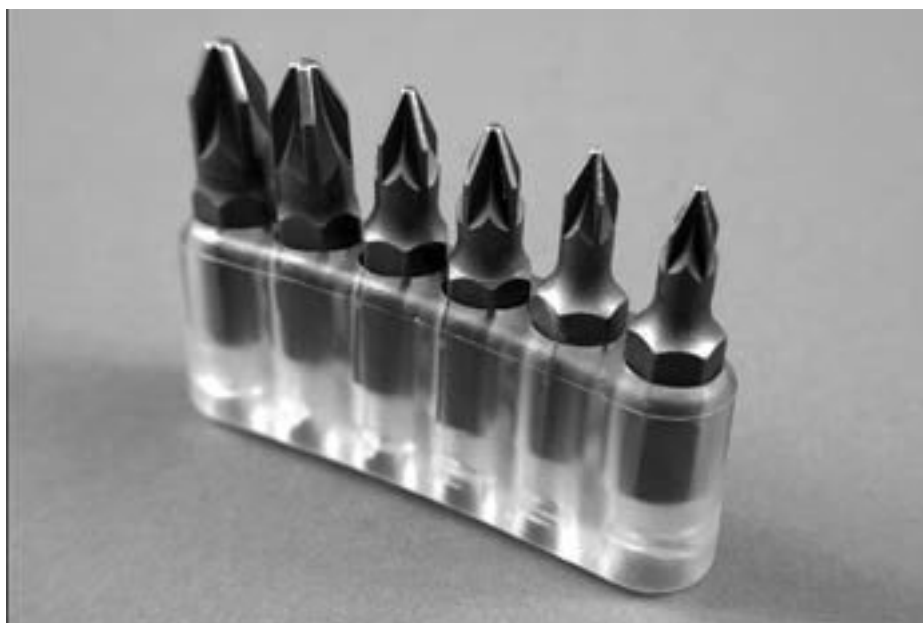
Съемные насадки «Позидрайв»

Кроме различий в форме жала, отвертки имеют разную длину и форму рукоятки или стержня, чтобы мастер мог подобрать наиболее удобный в данный момент вариант. Например, отвертки с длинной ручкой удобны при работе в труднодоступных местах, а с укороченной, наоборот, – там, где «не развернуться». Отвертка с «пистолетной» рукоятью имеет улучшенный крутящий момент, у отвертки с шестигранным стержнем этот момент можно увеличить, проворачивая ее ключом. Отвертка с храповым механизмом удобна тем, что ее можно кру-