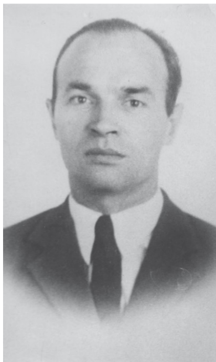
Анатолий Марченко, 1966–1968