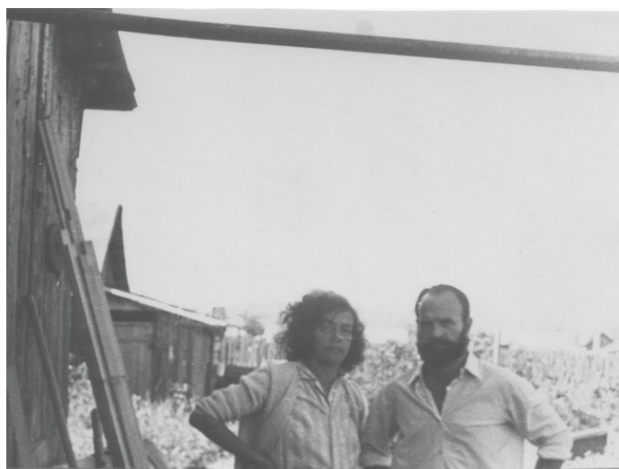
Лариса Богораз, Анатолий Марченко. Чуна, 1975–1978