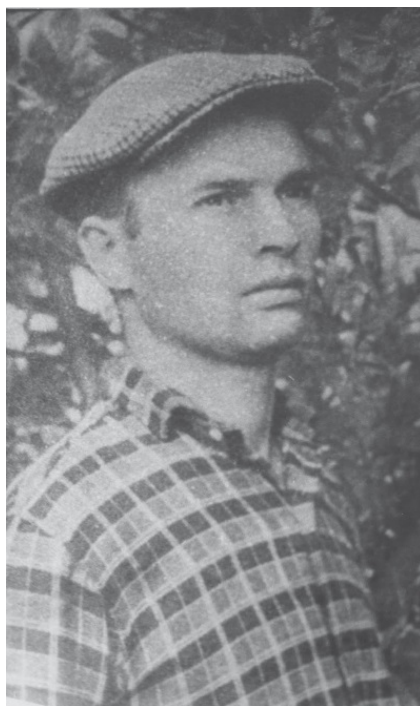
Анатолий Марченко. Карлаг или Дубравлаг, конец 1950-х – начало 1960-х

4 августа объявил бессрочную голодовку, требуя освободить всех политических заключенных СССР. В конце ноября прекратил голодовку (по некоторым сведениям – после получения заверений, что процесс освобождения политзаключенных вскоре начнется). 8 декабря скончался в Чистопольской тюрьме, по официальному заключению – от острой сердечно-легочной недостаточности. Похоронен на городском кладбище.