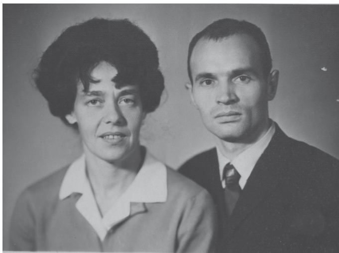
Лариса Богораз, Анатолий Марченко. Москва (?), 1966–1968