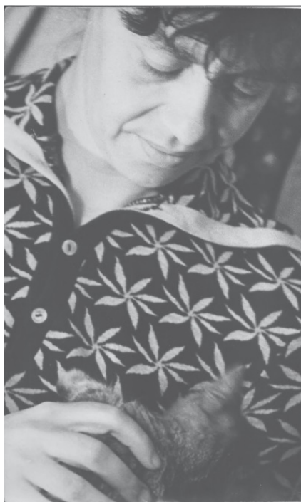
Лариса Богораз, середина 1960-х