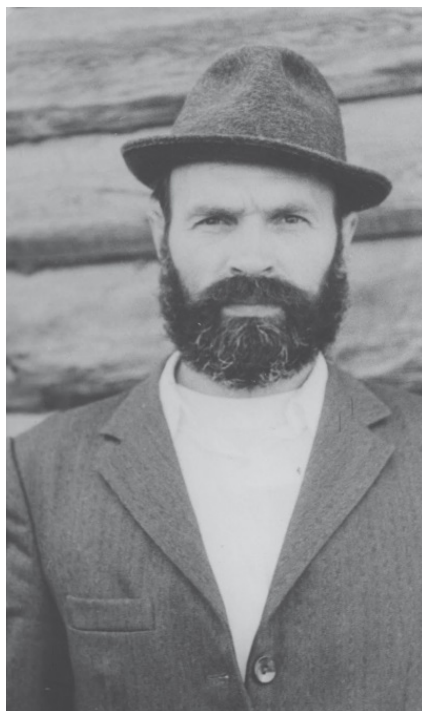
Анатолий Марченко. Чуна, 1975–1978