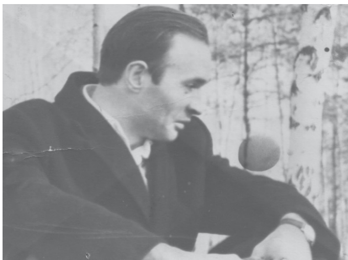
Анатолий Марченко. Москва (?), 1973