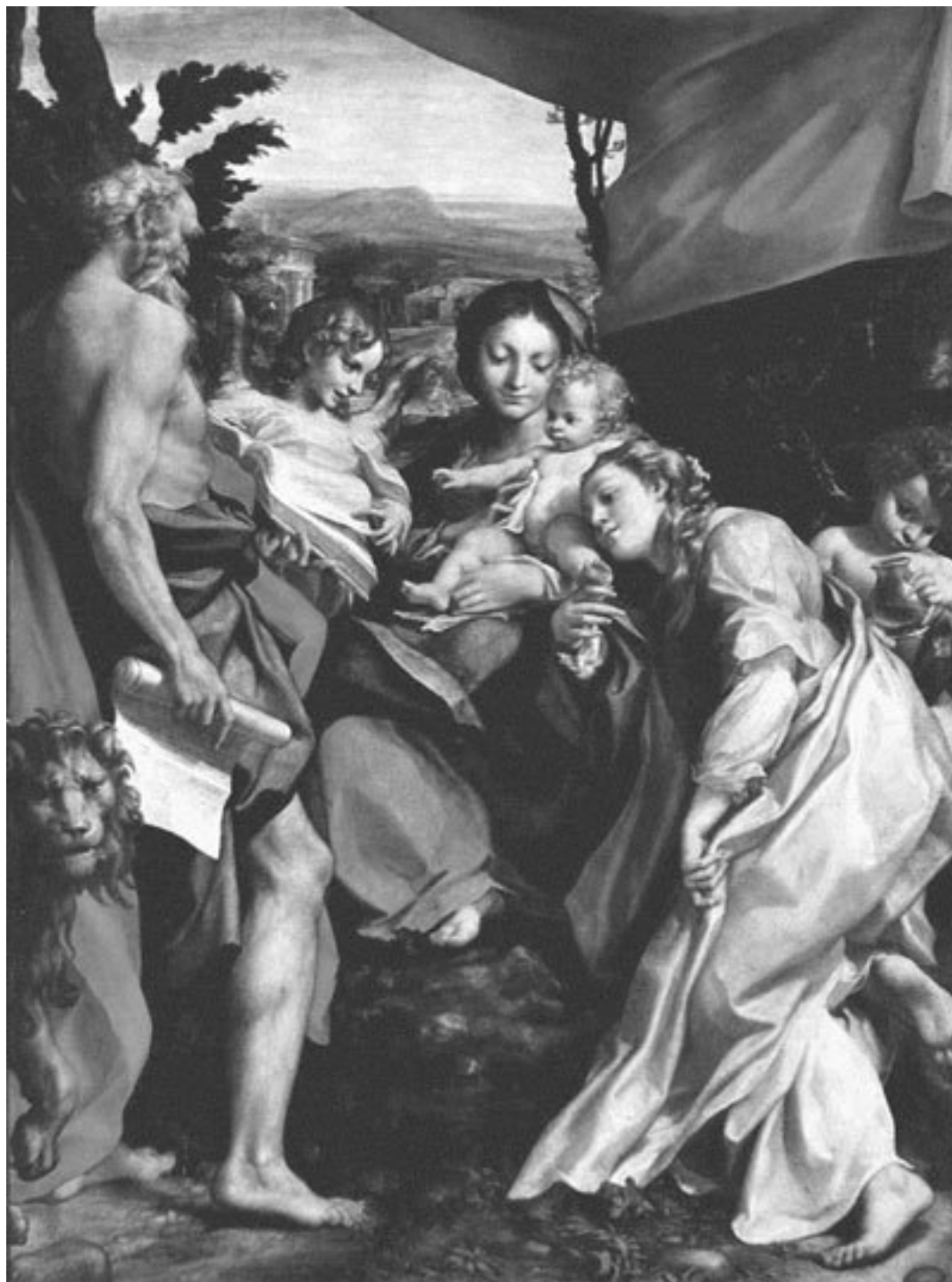
Антонио да Корреджо. Мадонна со святым Иеронимом

Но собратья-профессионалы все равно кривились: «Этот Антонио только и может, что малевать своих толстокожих чад да клушу-жену!» И чем не угодила им Джиролама? Что только они про нее не выдумывали! Что, мол, она криклива и тяжела на руку, держит мужа под каблучком, бьет его и не дает общаться с приятелями. Да и сам он хорош! Скуп и прижимист. Никогда не пригласит друзей ни на обед, ни на вечеринку, даже в тратторию не позовет. Идиоты! У него же было четверо детей – после сына родились еще три прелестные дочурки. Так неужто он должен отрывать деньги от семьи и отдавать на очередную попойку?! Еще не хватало! Корреджо никогда не любил шумных компаний, а уж упиваться дешевым вином да злословить