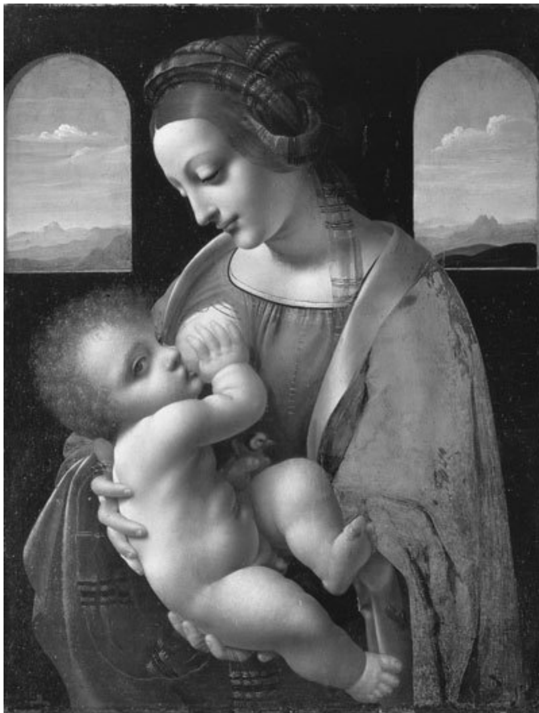
Леонардо да Винчи. Мадонна Литта

Откуда картина, написанная Леонардо на небольшой доске, взялась в семействе Литта, доподлинно неизвестно. Существовала, правда, легенда, по которой выходило, что великому художнику позировала одна из красавиц этого старинного миланского рода. Поговаривали, что она была влюблена в Леонардо и тот даже ответил ей взаимностью. Впрочем, за триста лет события прошлого покрылись мраком – быль и небыль смешались.