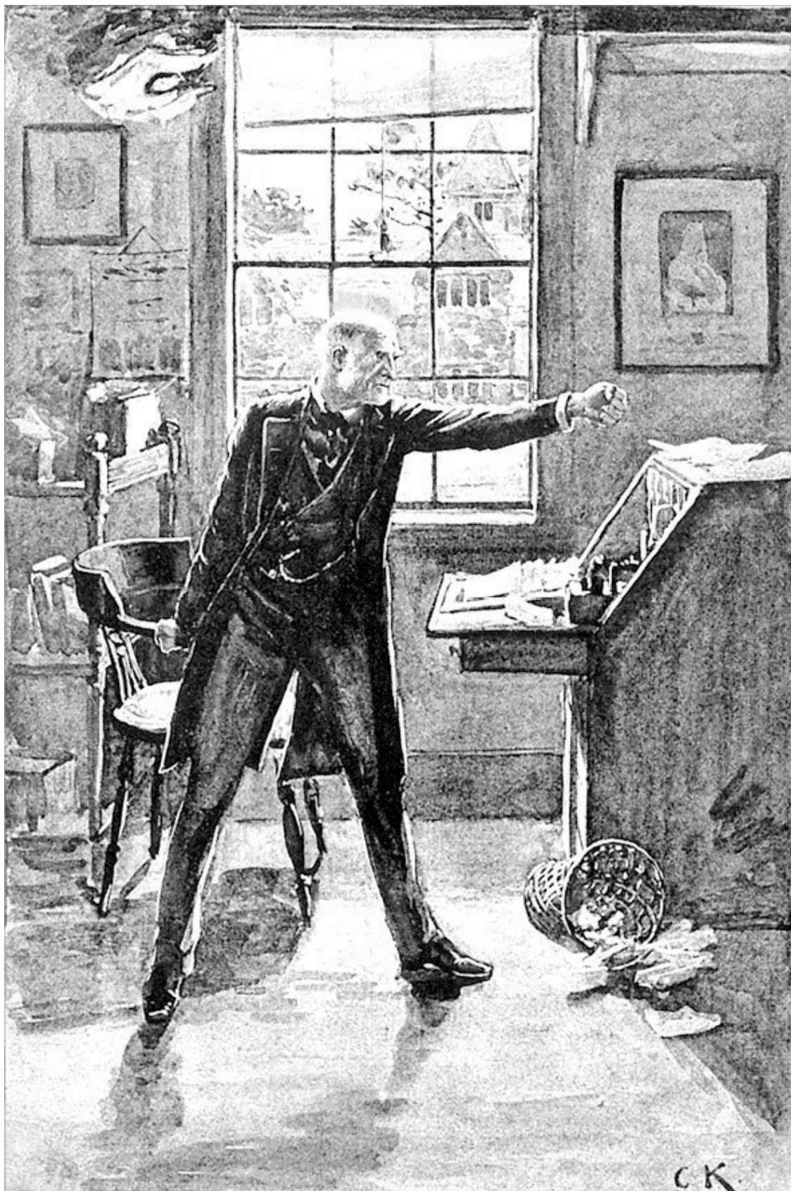
Он сжал кулаки и потряс ими в сторону закрывшейся двери