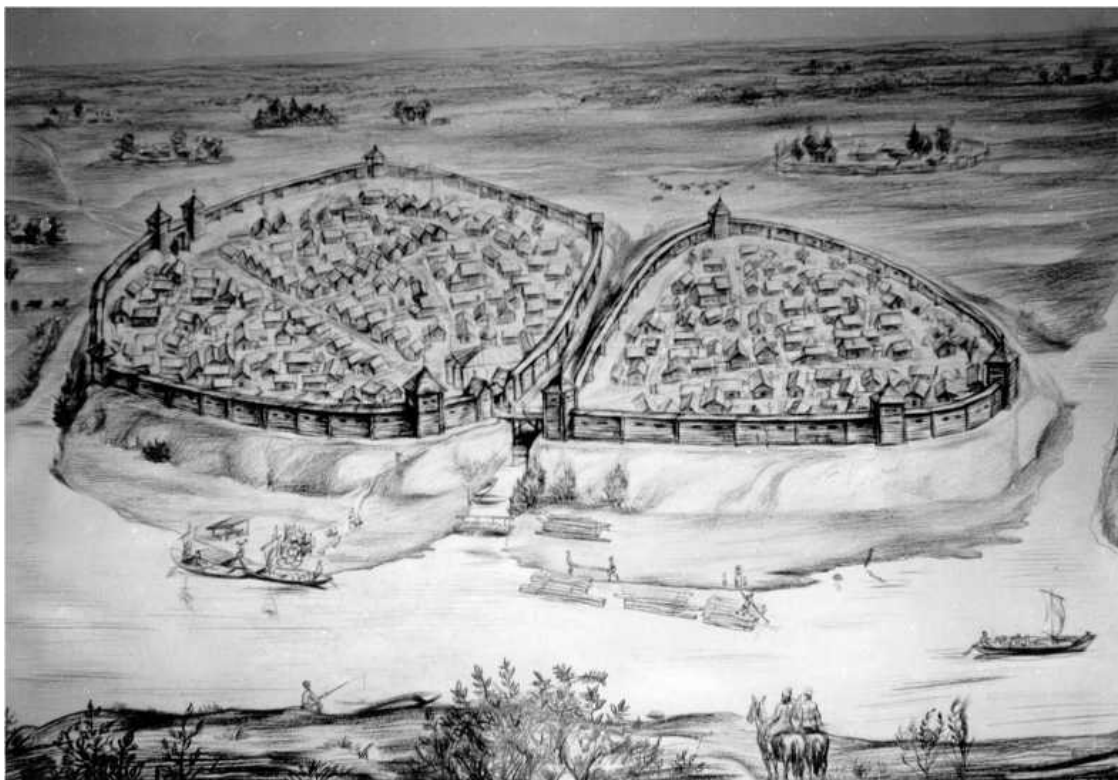
Древний Туров в начале XIII в. (реконструкция П. Ф. Лысенко, художник Е. Г. Коробушкин)

Наиболее полно освещаются события Волынской и Туровской земель в Ипатьевской летописи. В связи с разными событиями Туров упоминается в ней 29 раз. Дважды он назван княжеством и четыре раза волостью. Это свидетельствует о столичном положении города, возглавлявшего самостоятельное княжество. Семь раз упоминается о передаче Турова сыновьям, родственникам и союзникам великого князя киевского. Шесть раз упоминается в связи с военными событиями, осадой города, участием туровских князей в военных походах. Один раз упоминается в связи с событиями в семье туровского князя, но непосредственно сам город упоминается лишь четыре раза. В остальных случаях речь идет о перемещениях на княжеских престолах, политических или семейных событиях, изредка о природных явлениях. Поэтому ввиду случайности, краткости и отрывочности летописных сообщений о Турове восстановить жизнь древнего города по письменным источникам практически невозможно. Для того чтобы восполнить недостаток сведений, необходимо привлекать источники другого рода. Самыми достоверными являются археологические исследования.